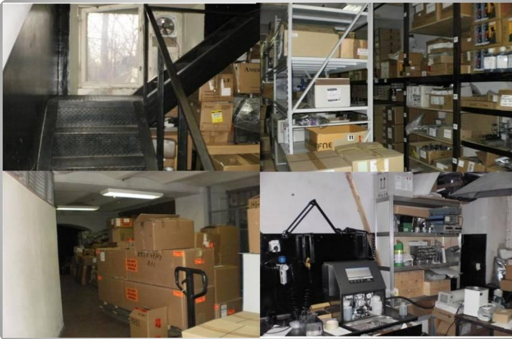
Фото объекта, подвал.