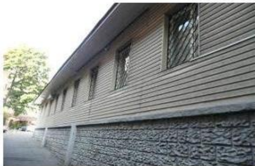
Фото объекта, фасад.