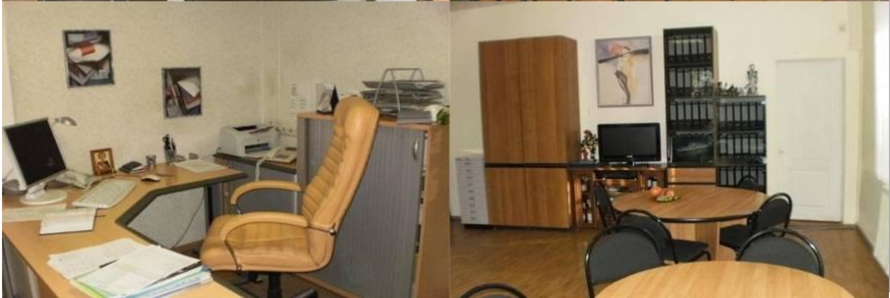
Фото объекта, этаж 1-й, кабинет руководителя, приемная.