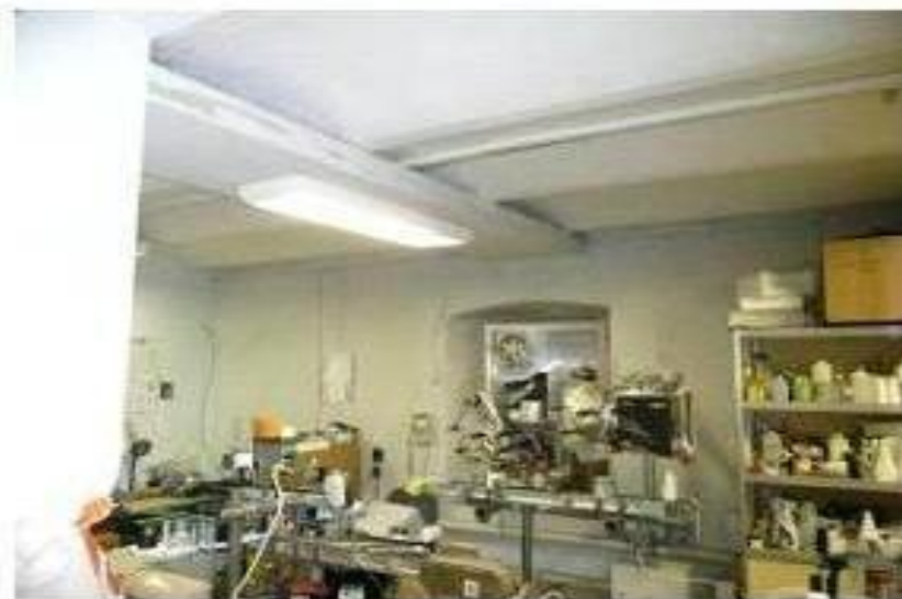
Фото объекта, этаж 1-й, холл, переговорная, кабинеты.