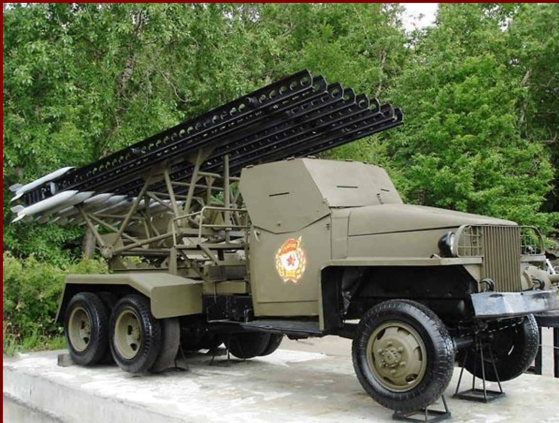
Гвардейский миномет «Катюша»