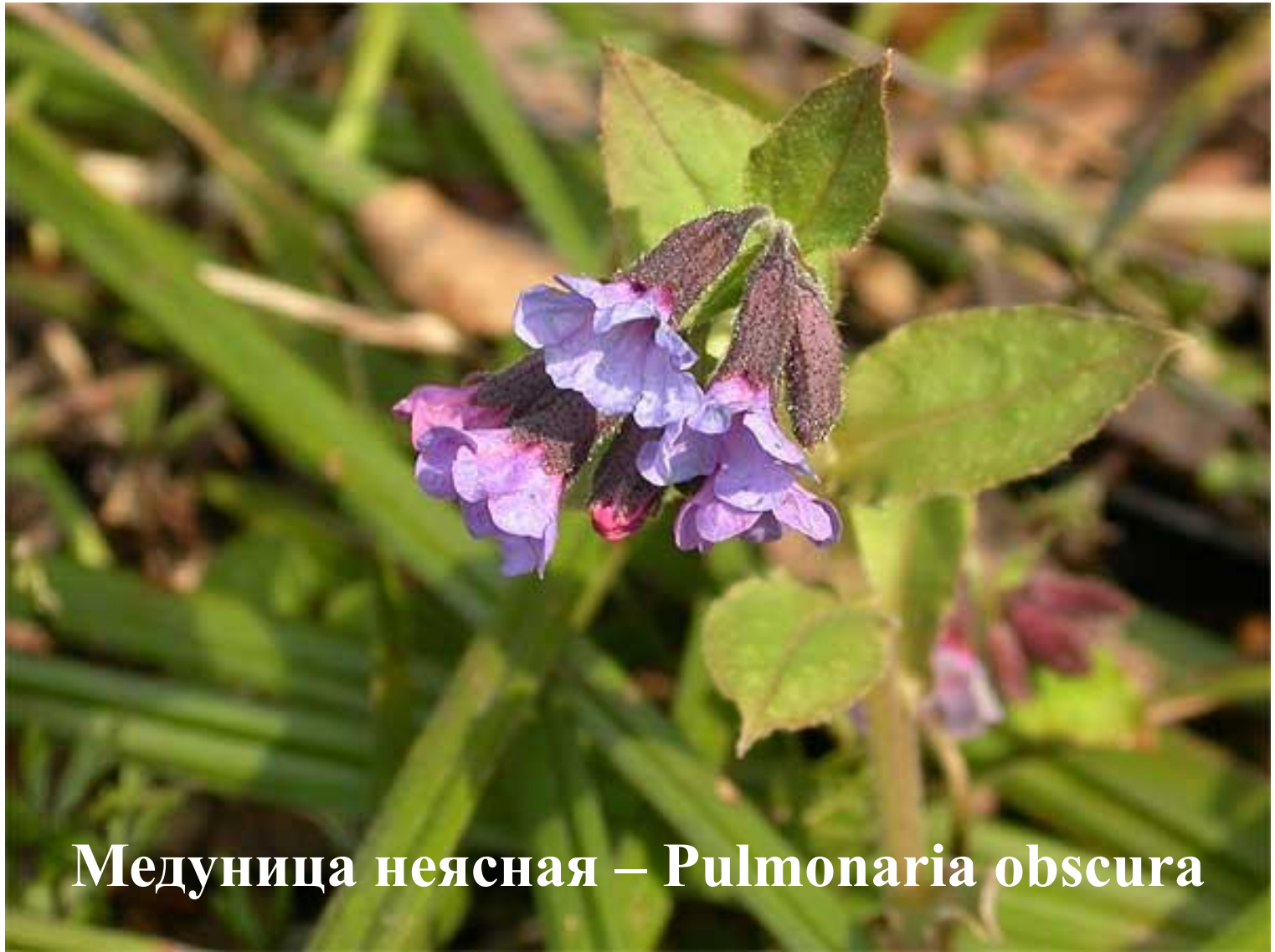
Медуница неясная – Pulmonaria obscura