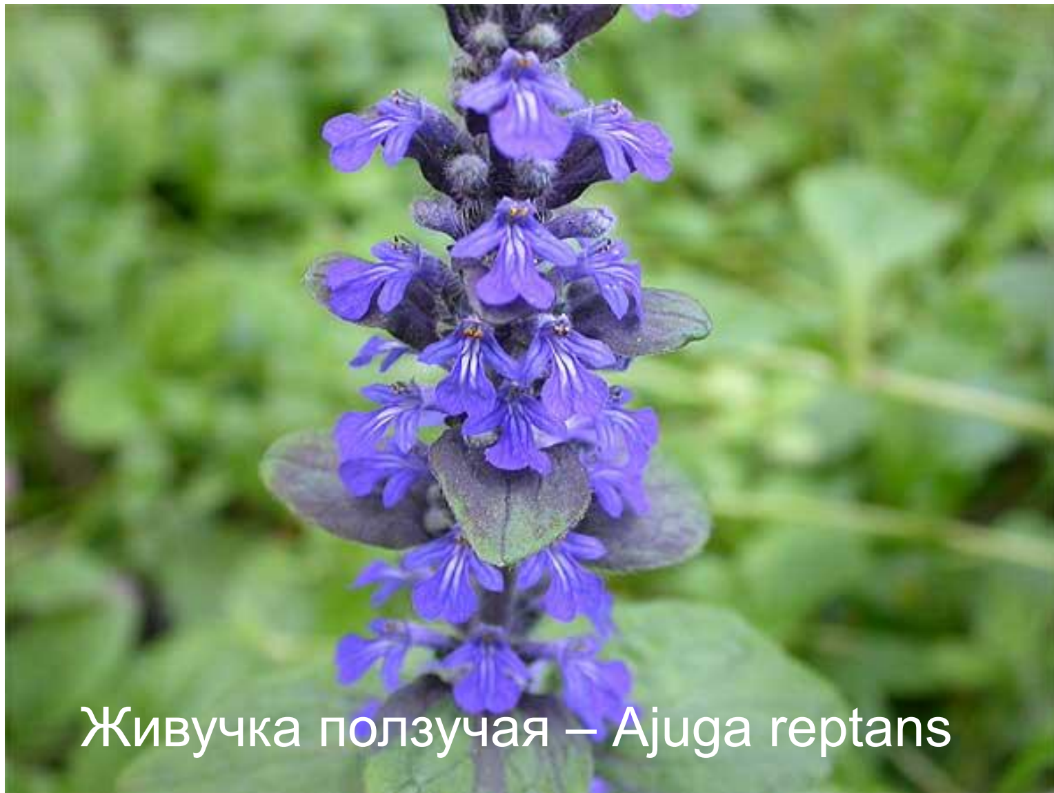
Живучка ползучая – Ajuga reptans