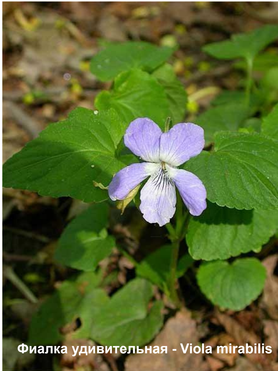
Фиалка удивительная - Viola mirabilis