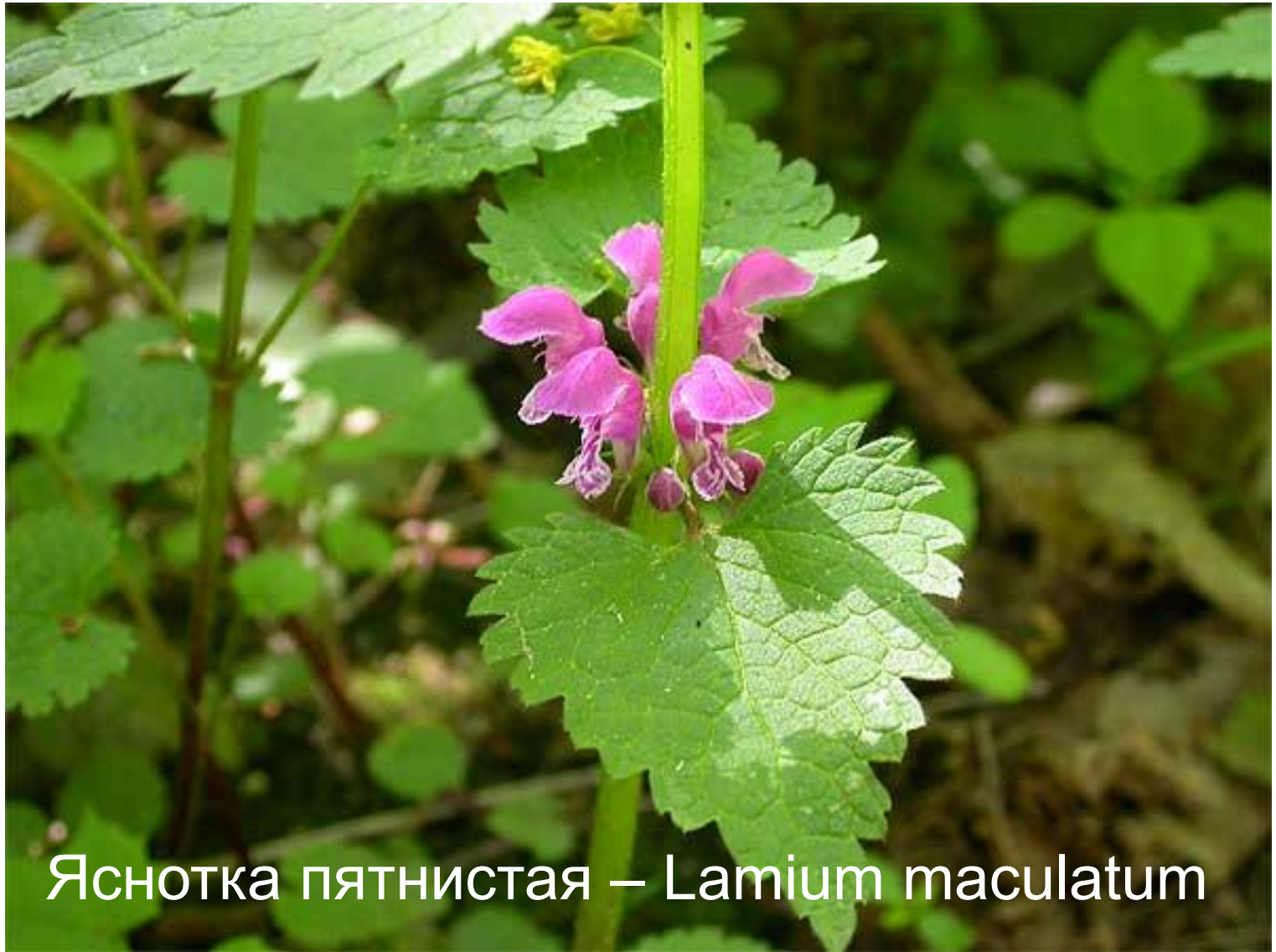
Яснотка пятнистая – Lamium maculatum