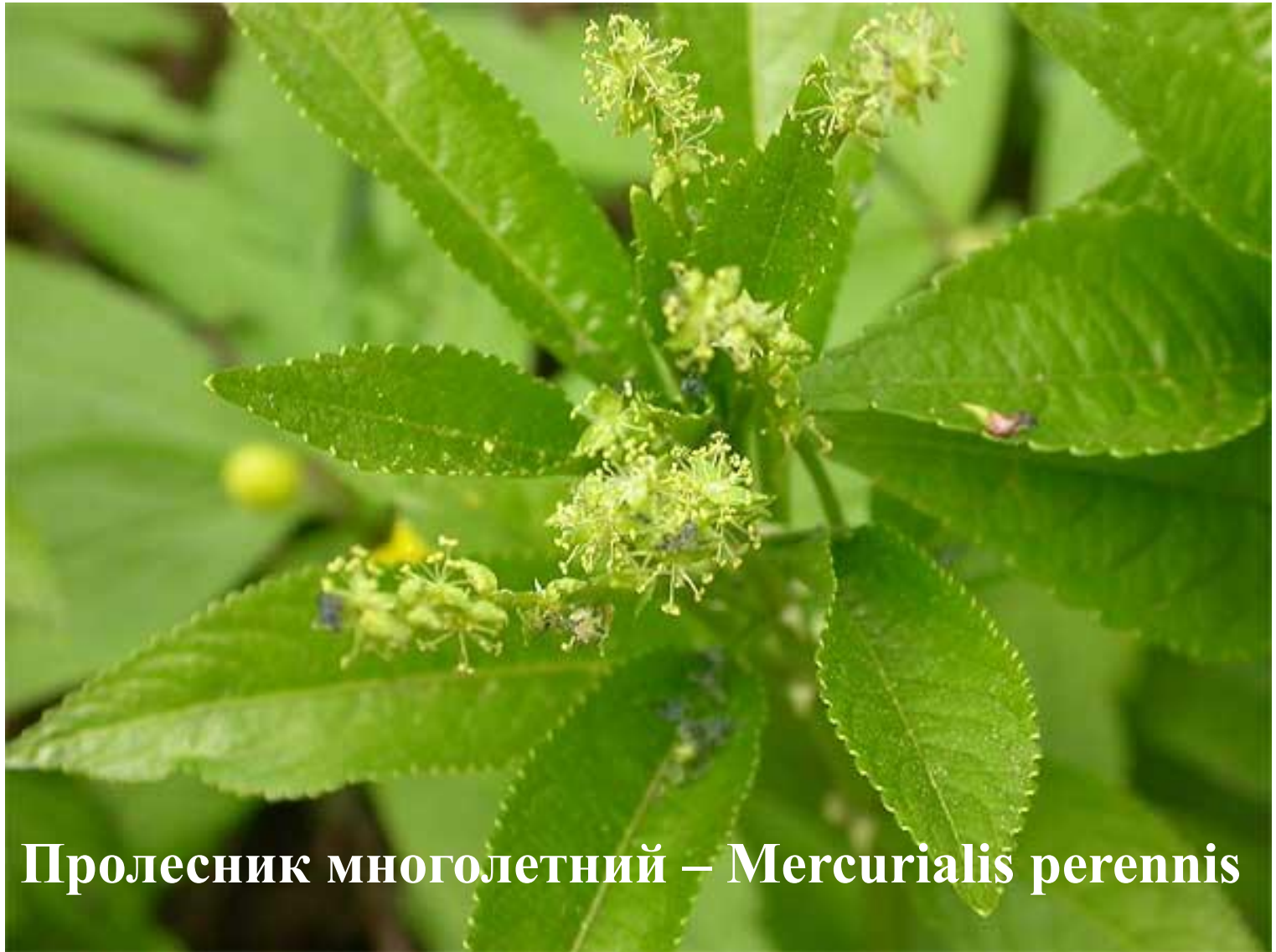
Пролесник многолетний – Mercurialis perennis