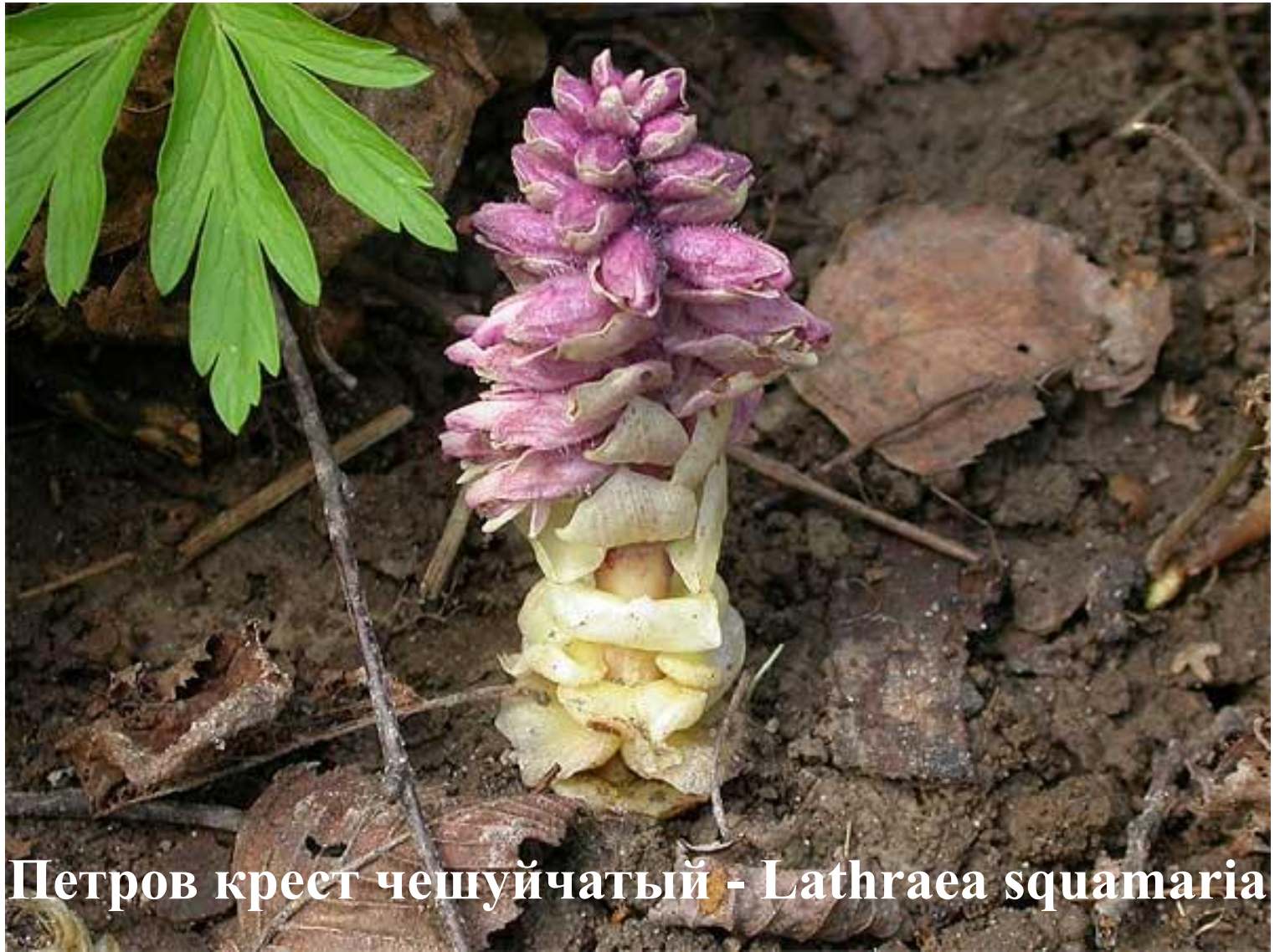
Петров крест чешуйчатый - Lathraea squamaria