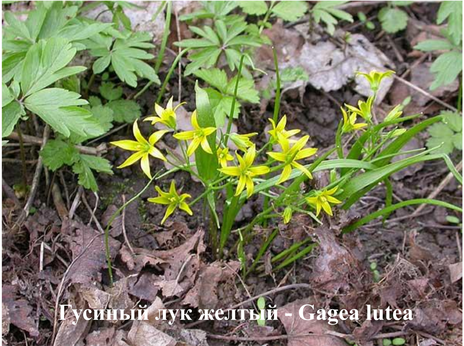
Гусиный лук желтый - Gagea lutea