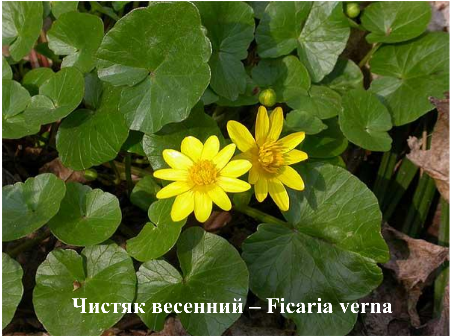
Чистяк весенний – Ficaria verna