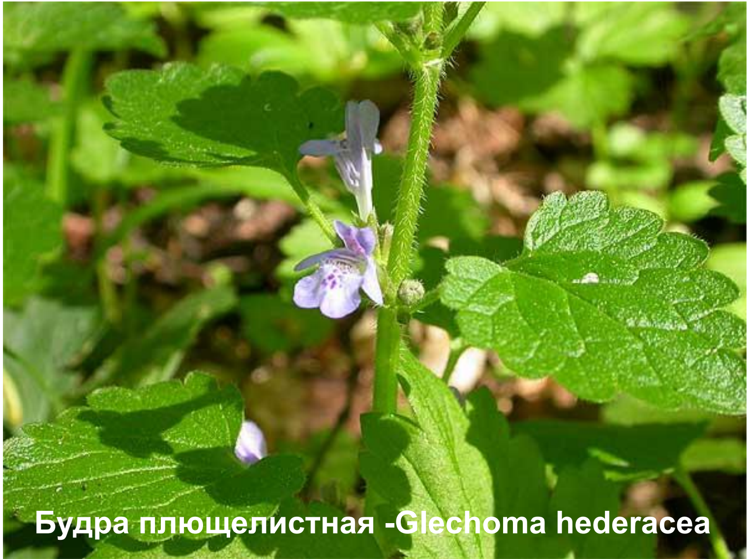
Будра плющелистная - Glechoma hederacea