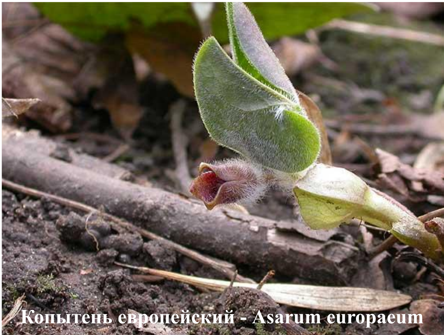
Копытень европейский - Asarum europaeum