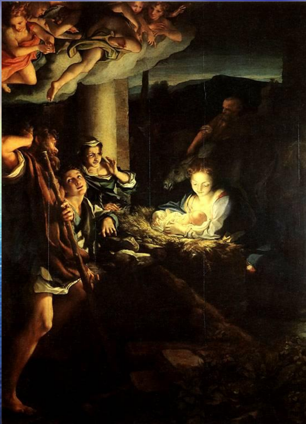
Антонио Корреджо Рождество Христово