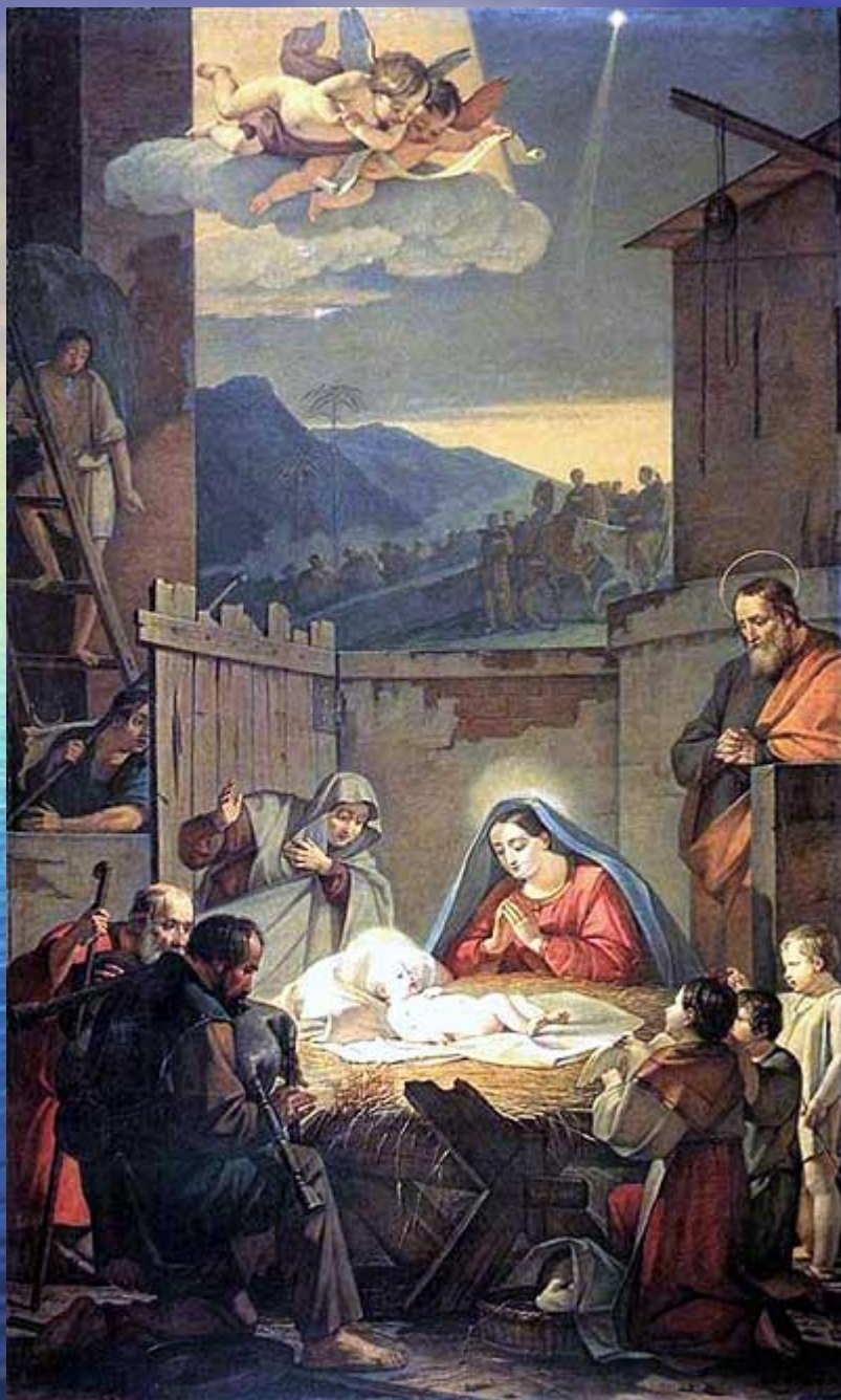
Василий Шебув Рождество Христово (поклонение пастухов)