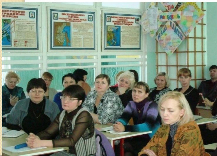
Уровень квалификации ПК