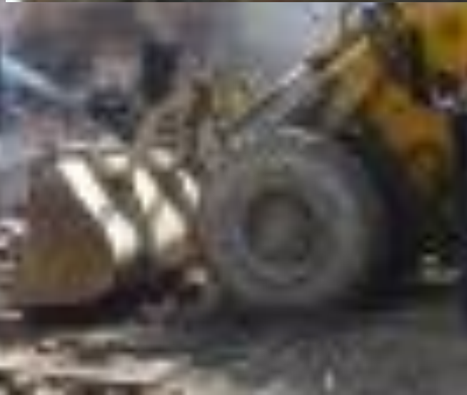
Беслан. Сентябрь 2004 г.