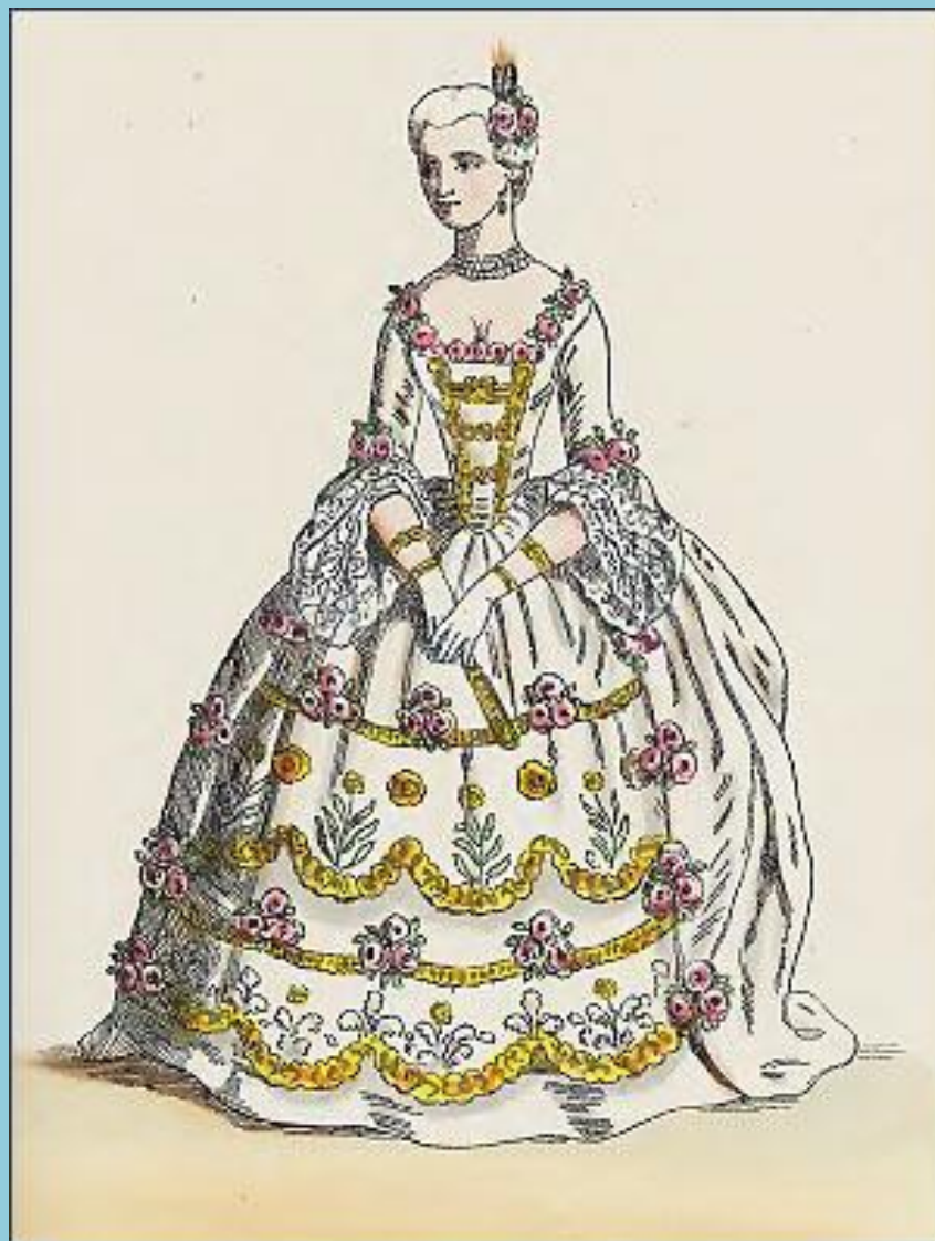
Придворная дама, 1830 г.