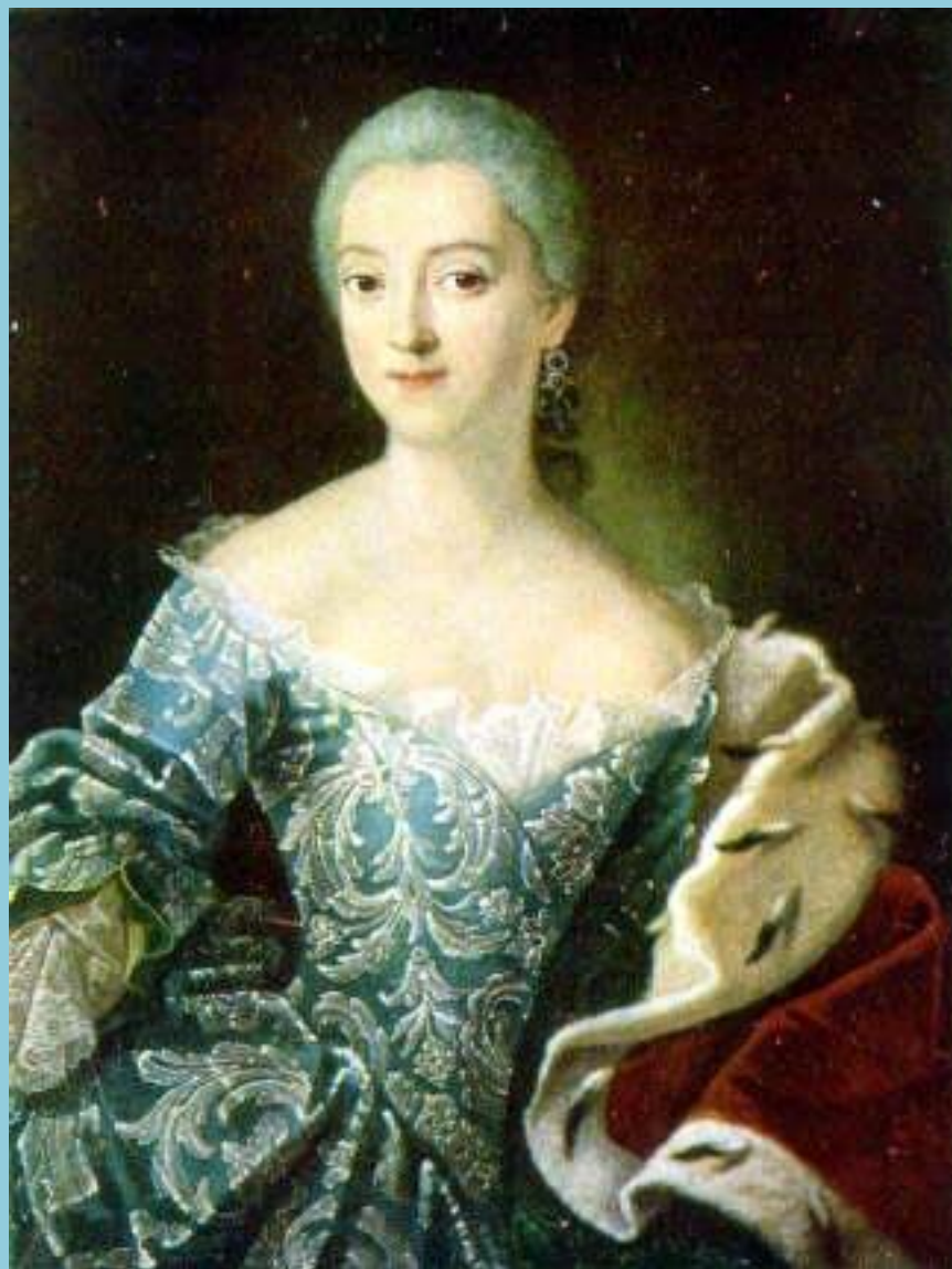
Платье конца XVIII - начала XIX века