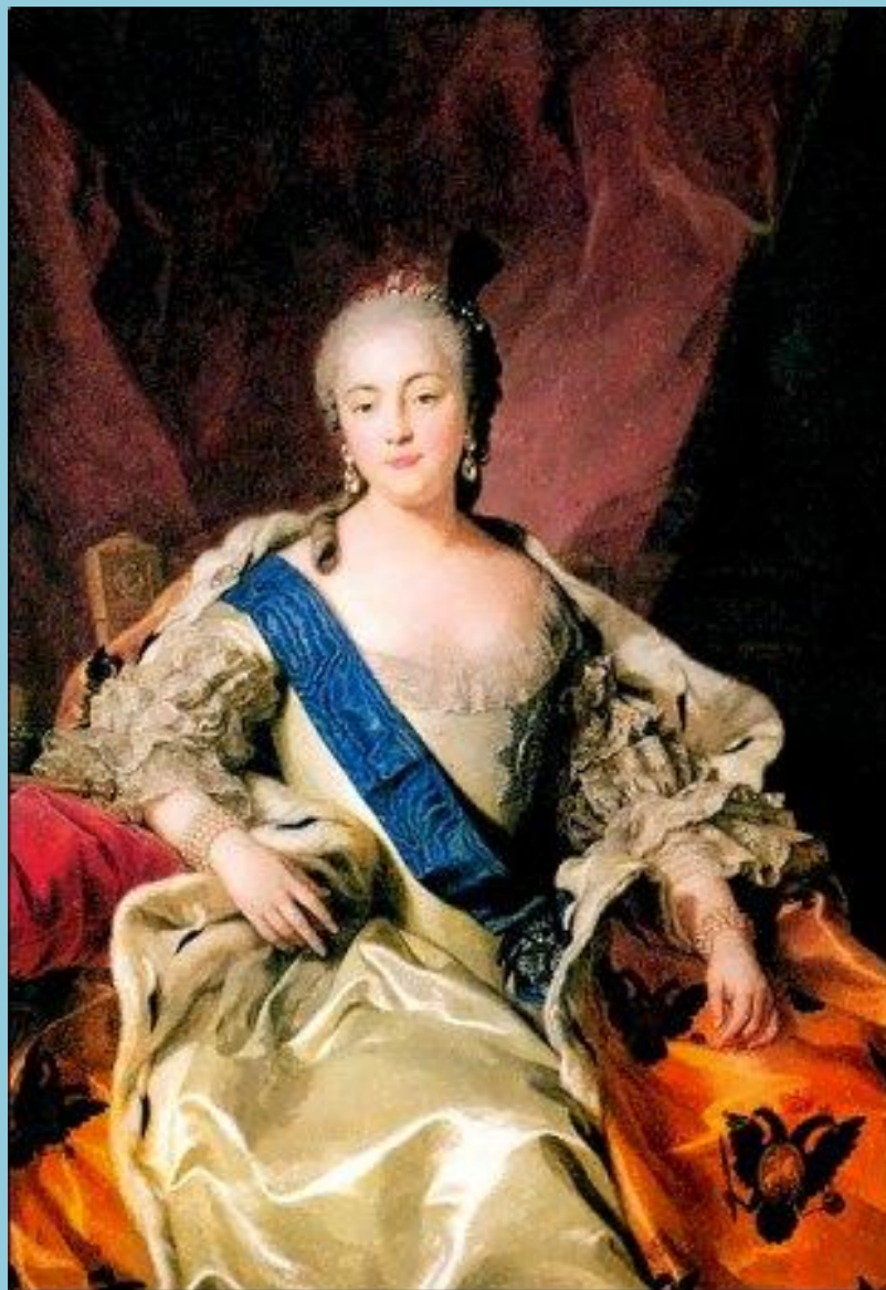
Императрица Елизавете Петровна