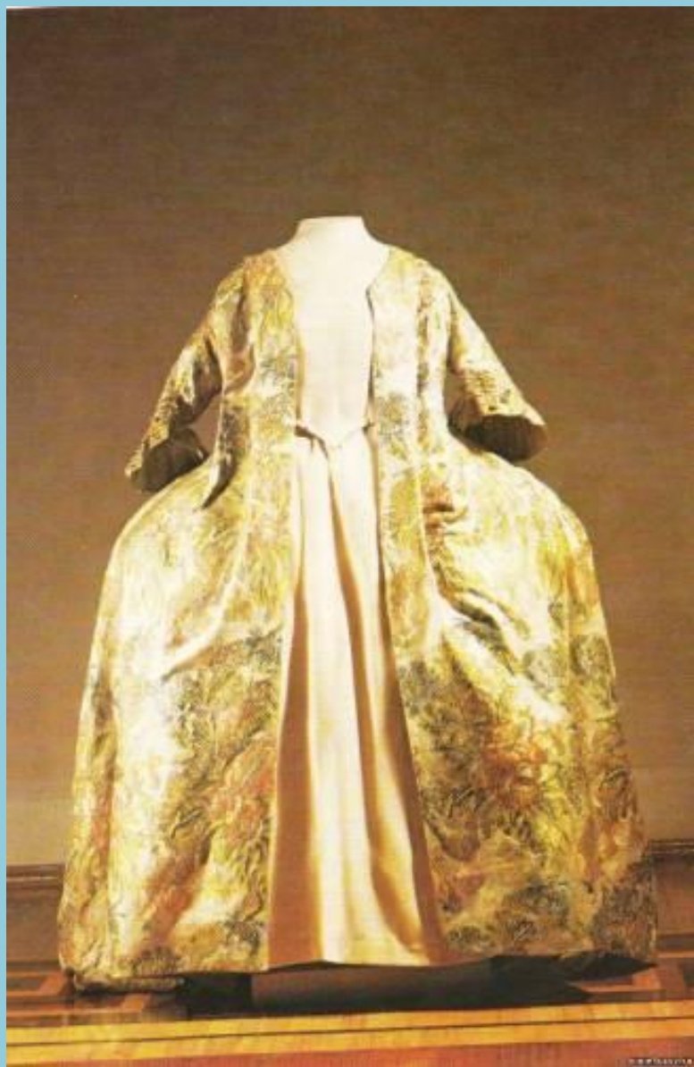
Платье – роба (от франц. «la robe» -