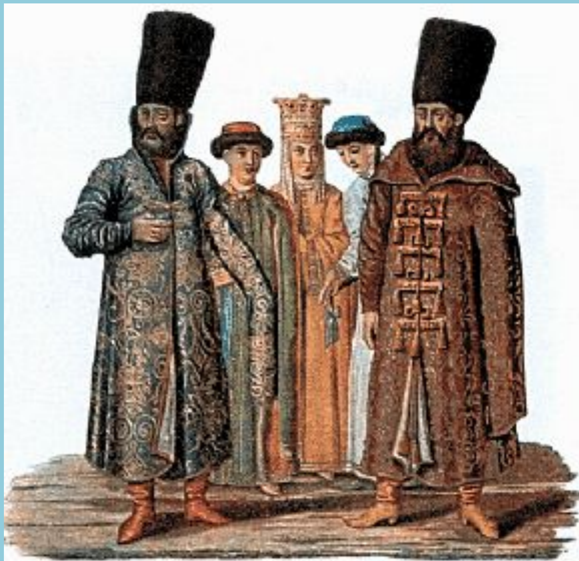
Русская одежда XVII века