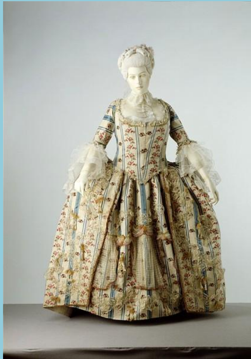
Платье начала XVIII века