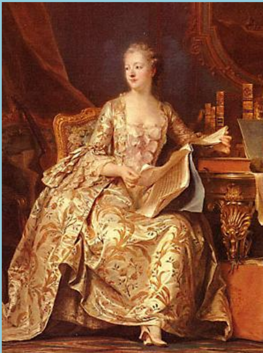
Платье со шлейфом