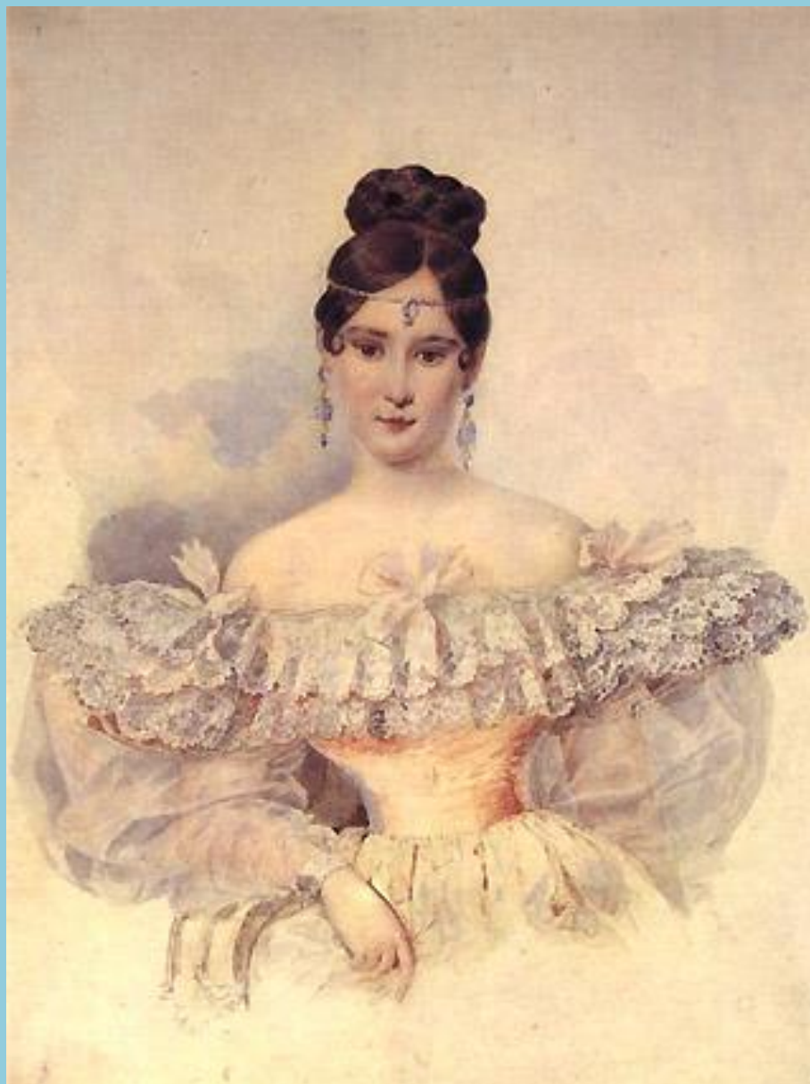
Платье с декольте