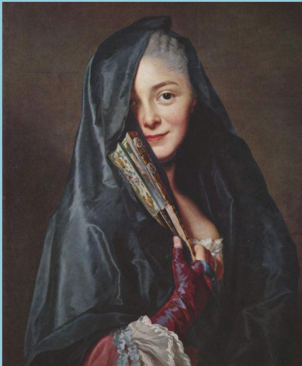
Девушка с веером