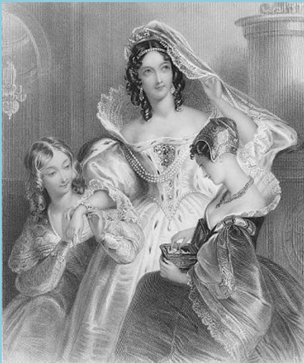
Русская дворянка XVIII века