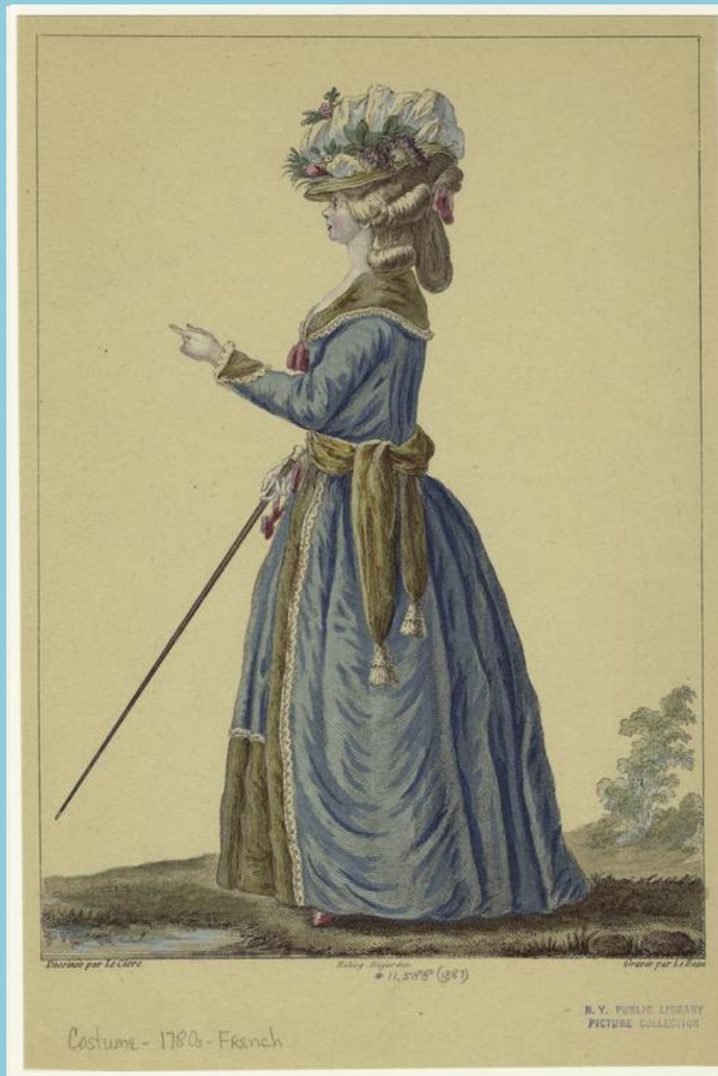
Дама с тросточкой