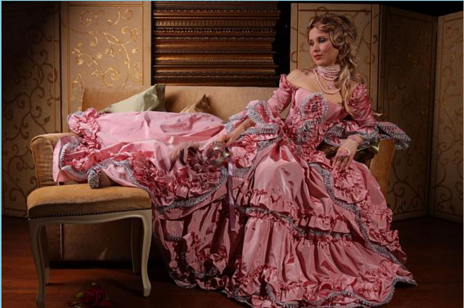
Стиль XVIII века