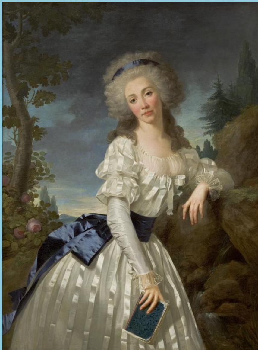
Барышня XVIII века