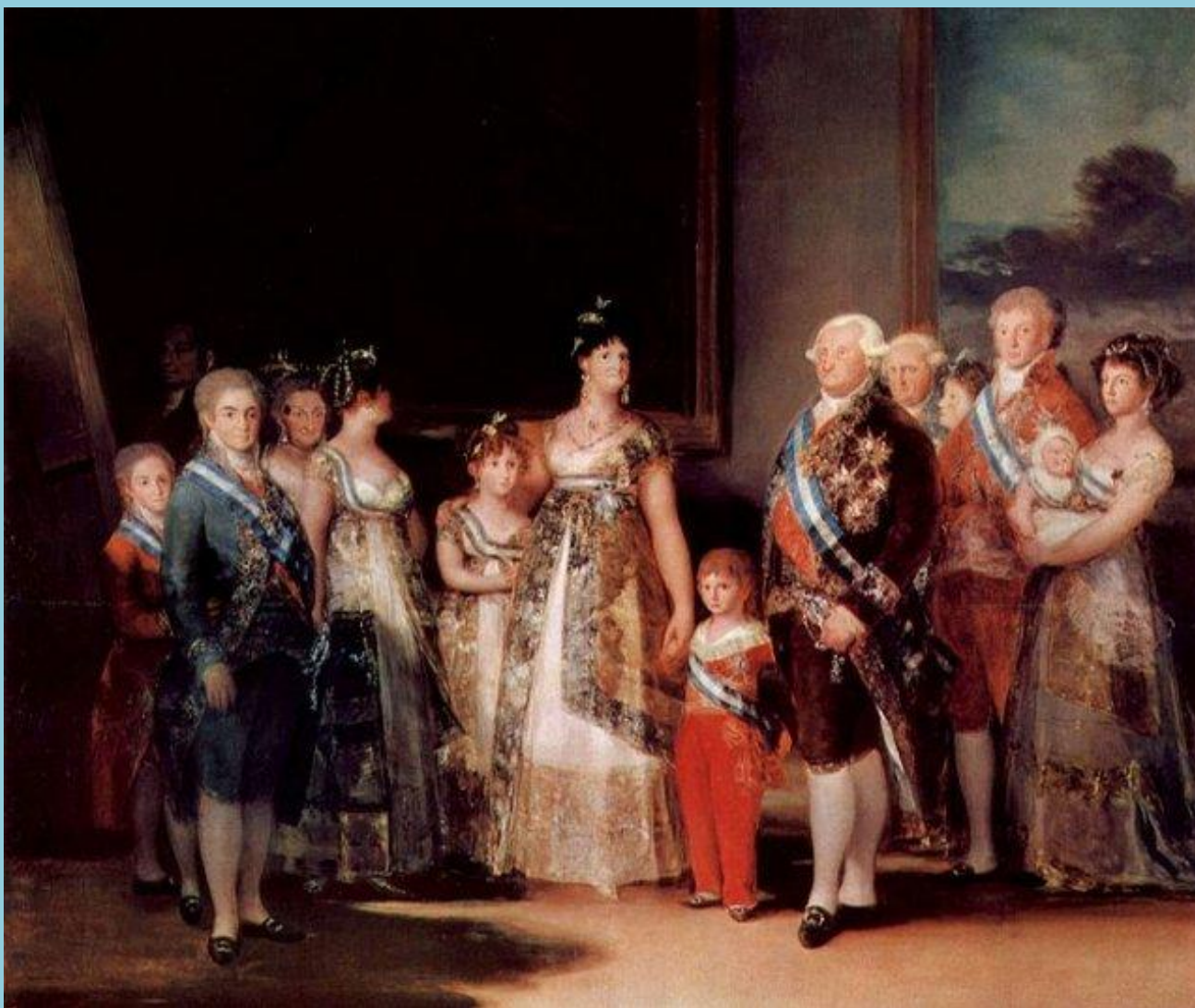
Придворные дамы и кавалеры