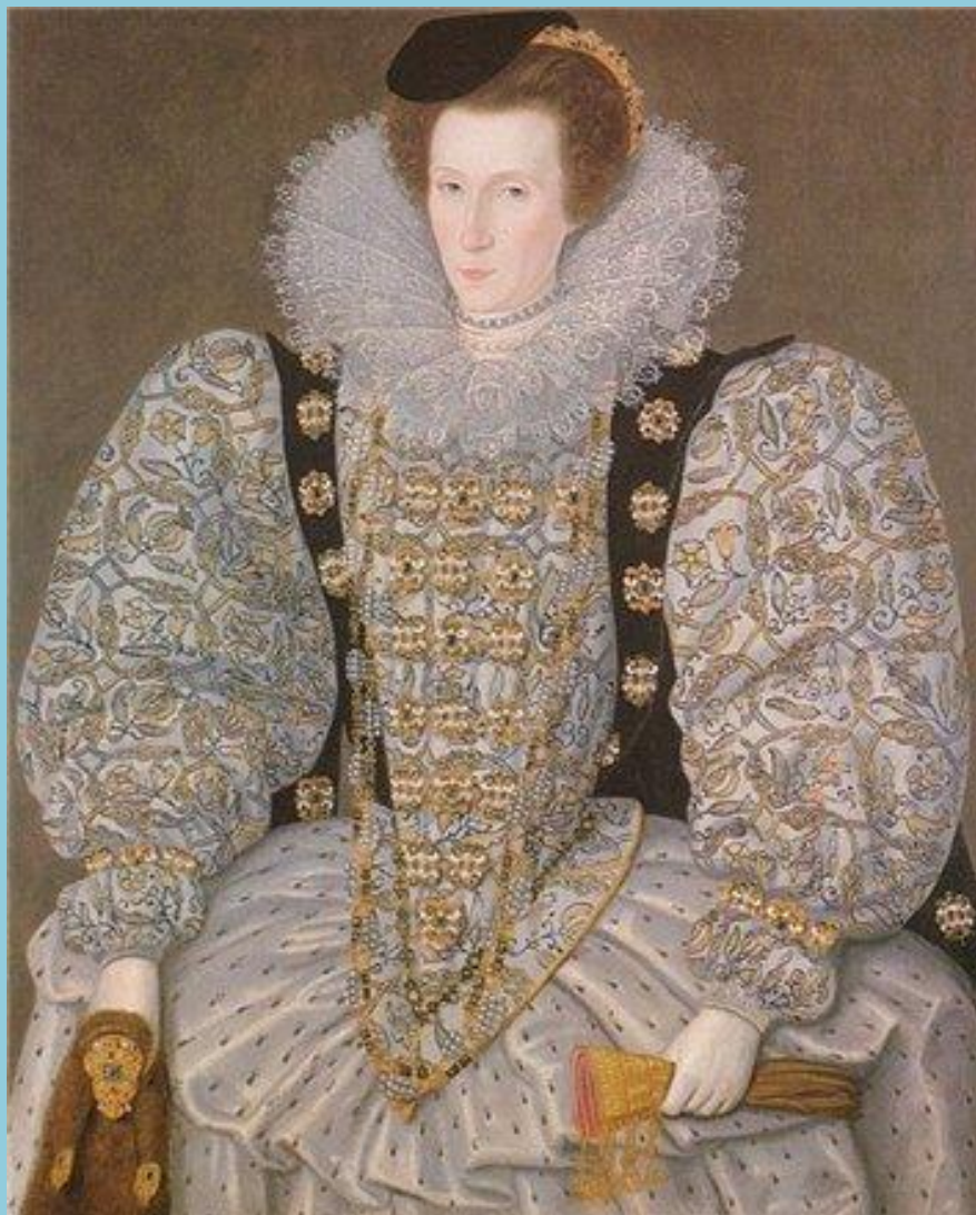
Портрет английской королевы Елизаветы I с блохоловкой