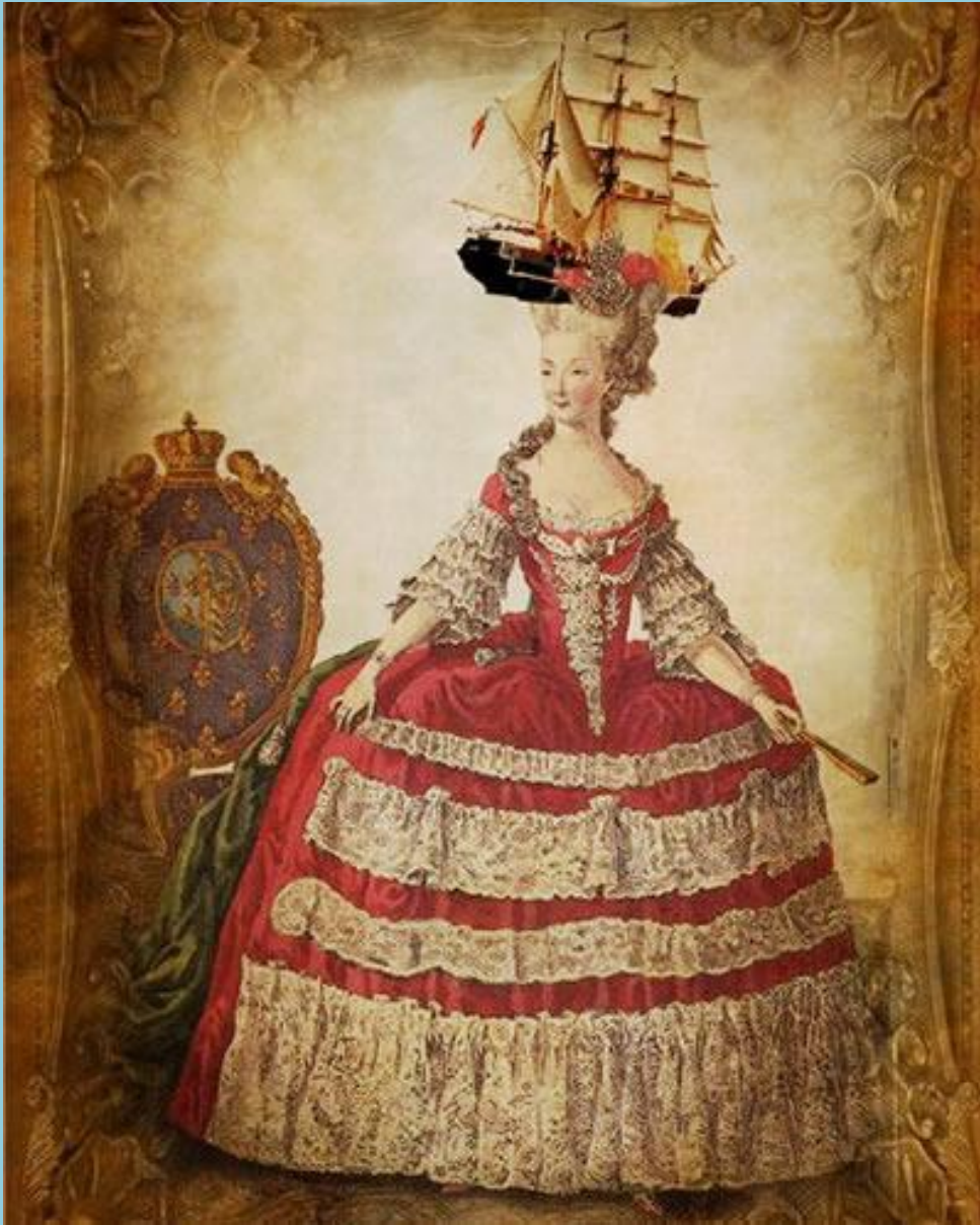
Прически 70-80-е гг. XVIII века