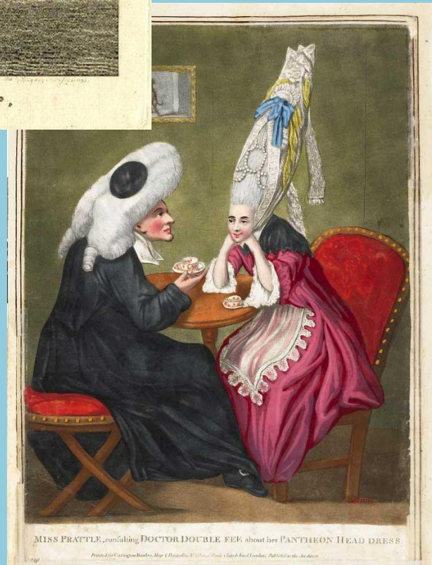
MISS FRATTLE, consulting DOCTOR DOUBLE FEF about her PANTHEON HEAD DRESS