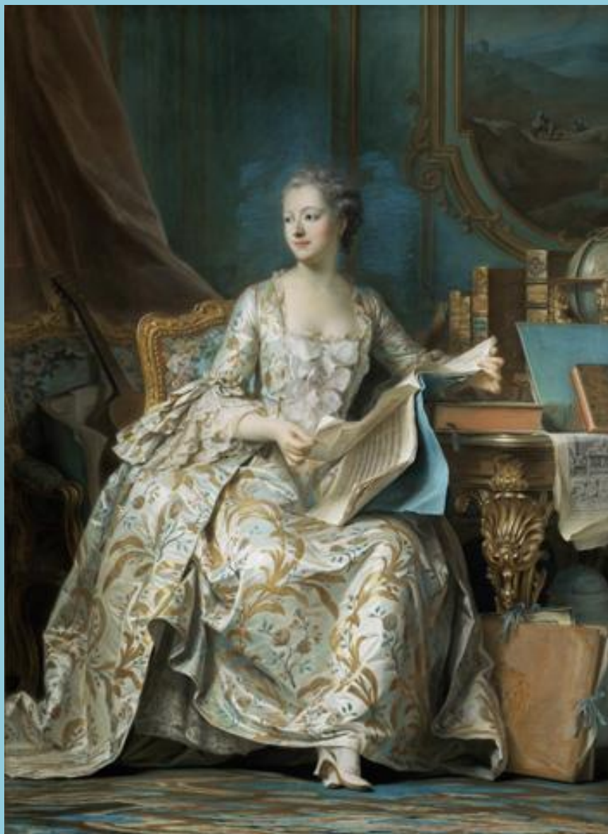
Красавица второй половины XVIII века