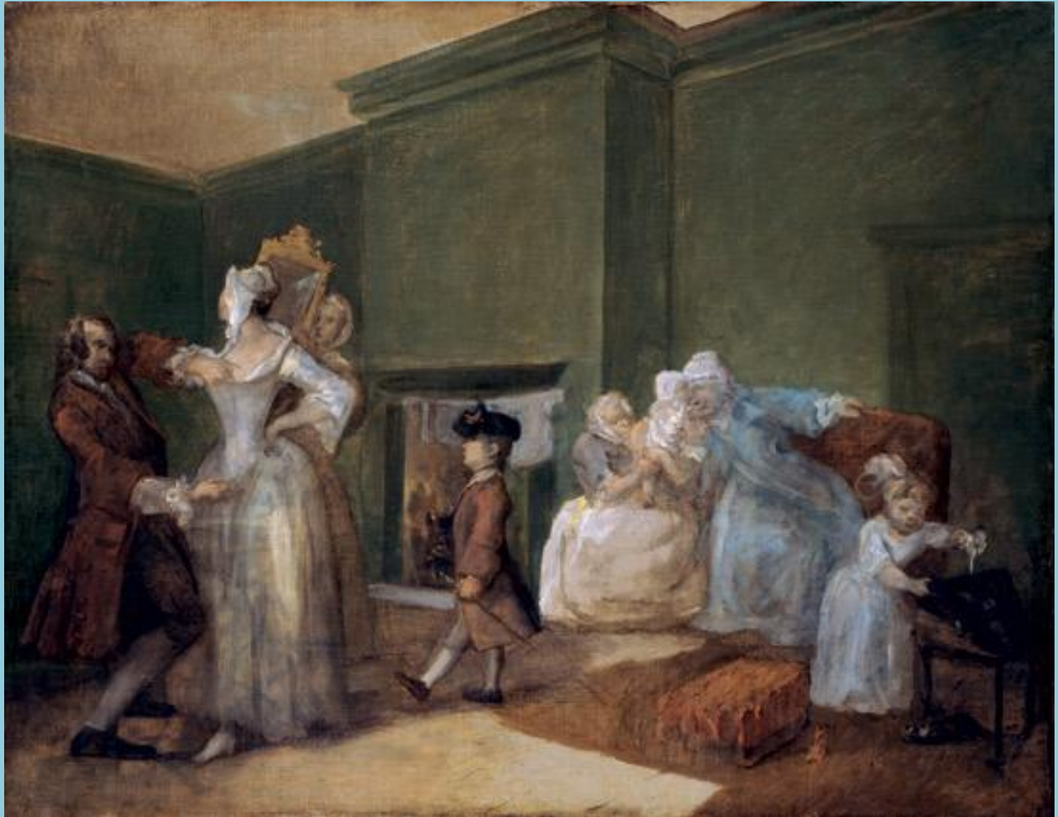
Художник Уильям Хогарт. Корсет.