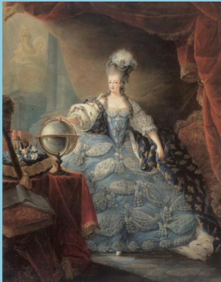
Платье конца XVIII века