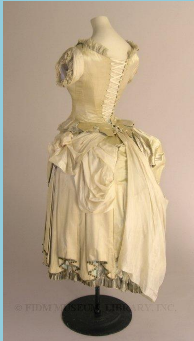
Платье с турнюром