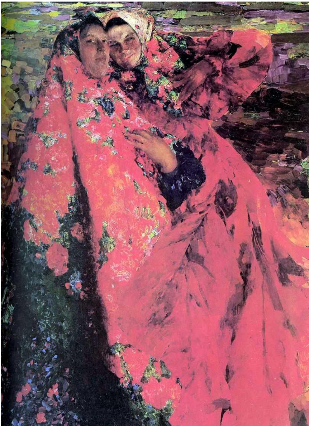
Малявин Филипп Андреевич. Крестьянки. 1904