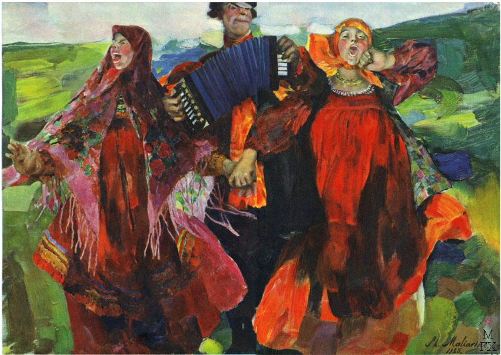
Народная песня. 1925.