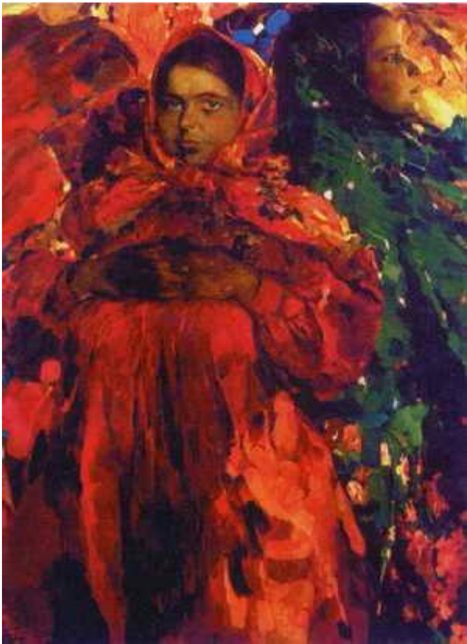
Две девки. 1910г.