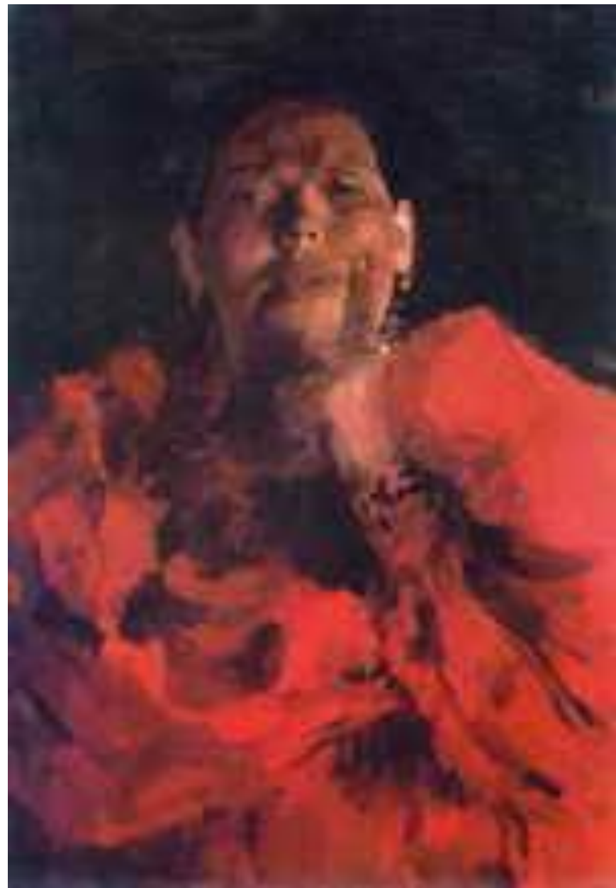
Крестьянка в красном платье. 1900г.