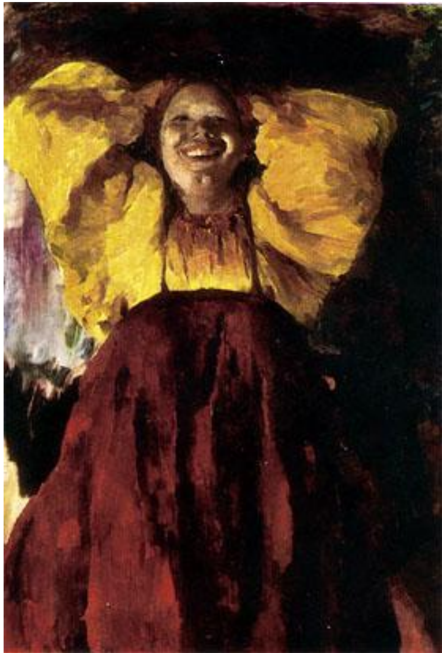
Ф.А. Малявин. Картина : Баба в желтом