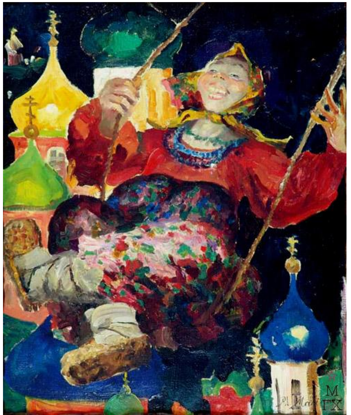
Баба на качелях. 1930-е гг.