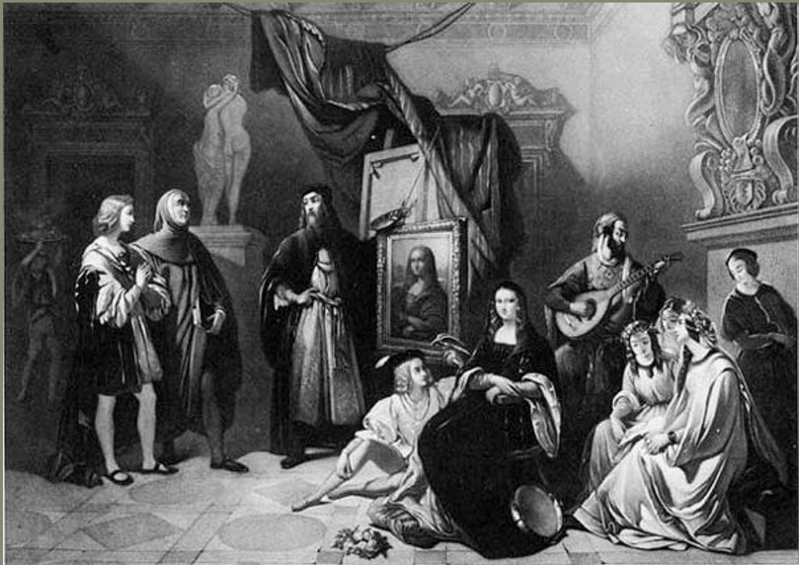
«Студия Леонардо да Винчи» на гравюре 1845 года: Джоконду развлекают шуты и музыканты