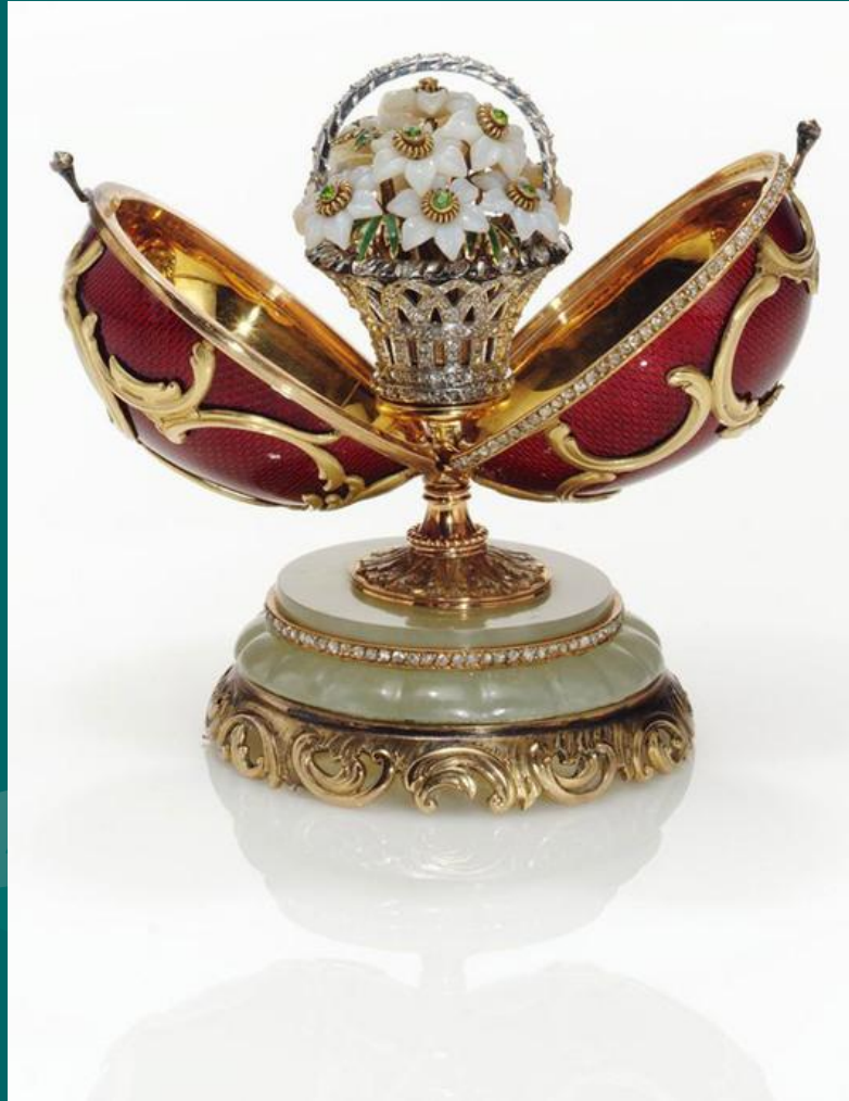
Яйцо - часы