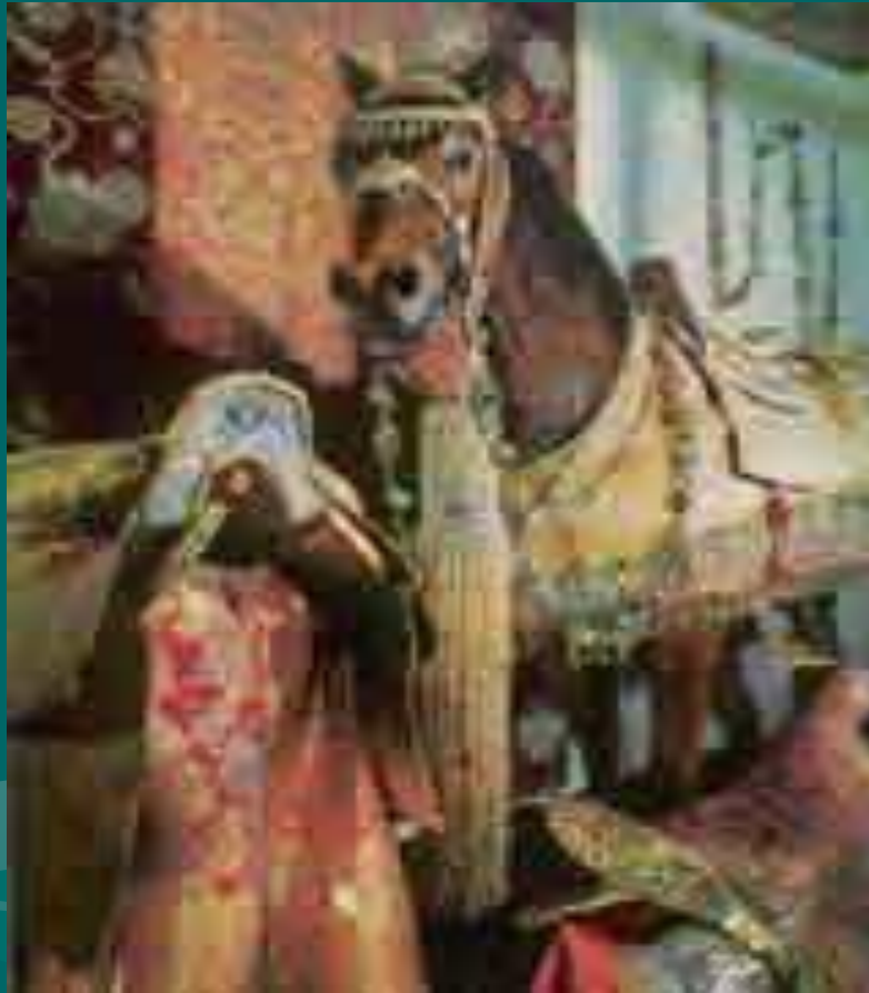
Парадное убранство коня