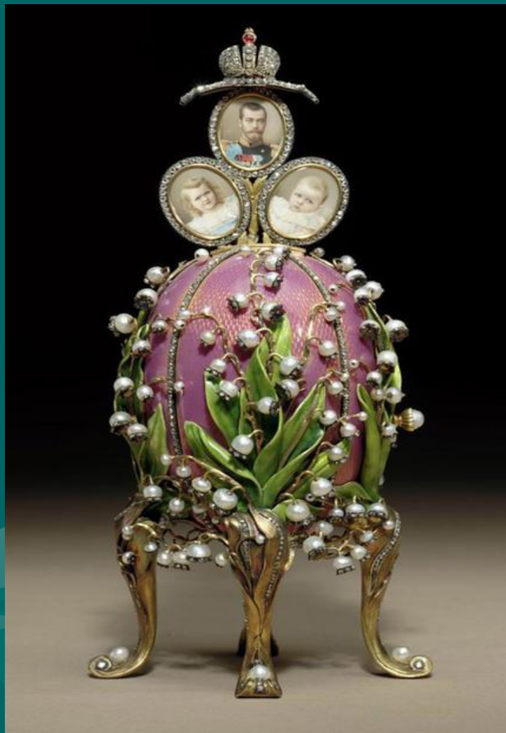
Яйцо с портретами детей Николая II