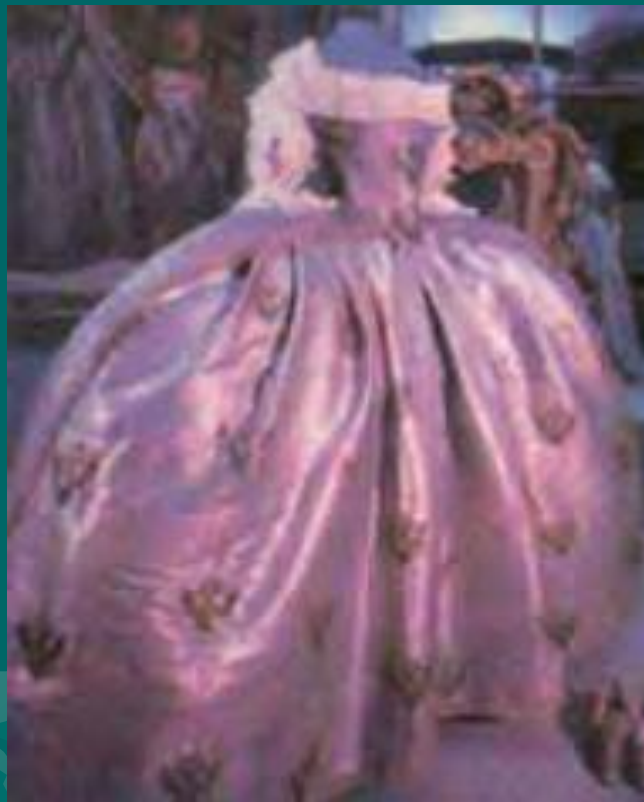
Платье Екатерины II, выполненное из серебряного глазета