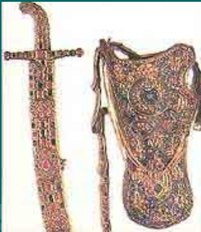
Сабля и колчан царя Алексея Михайловича