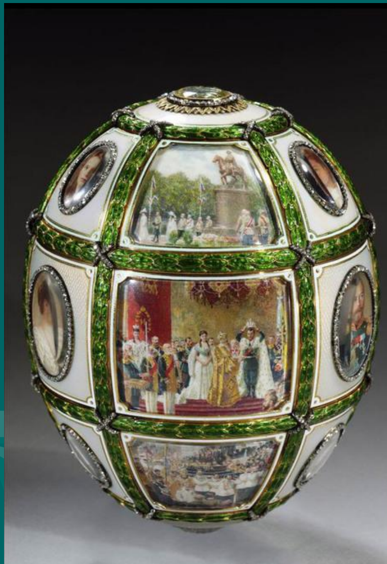
Яйцо «Трёхсотлетие дома Романовых»