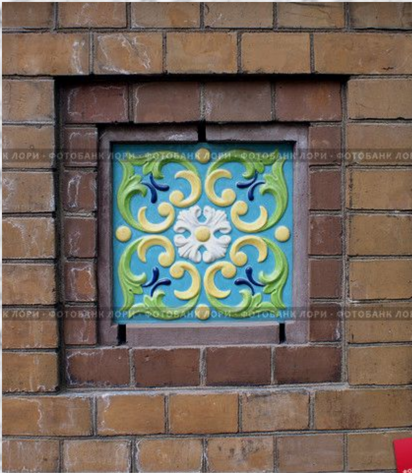
Изразец на воротах ограды Михайловского сада у церкви Спаса - на крови