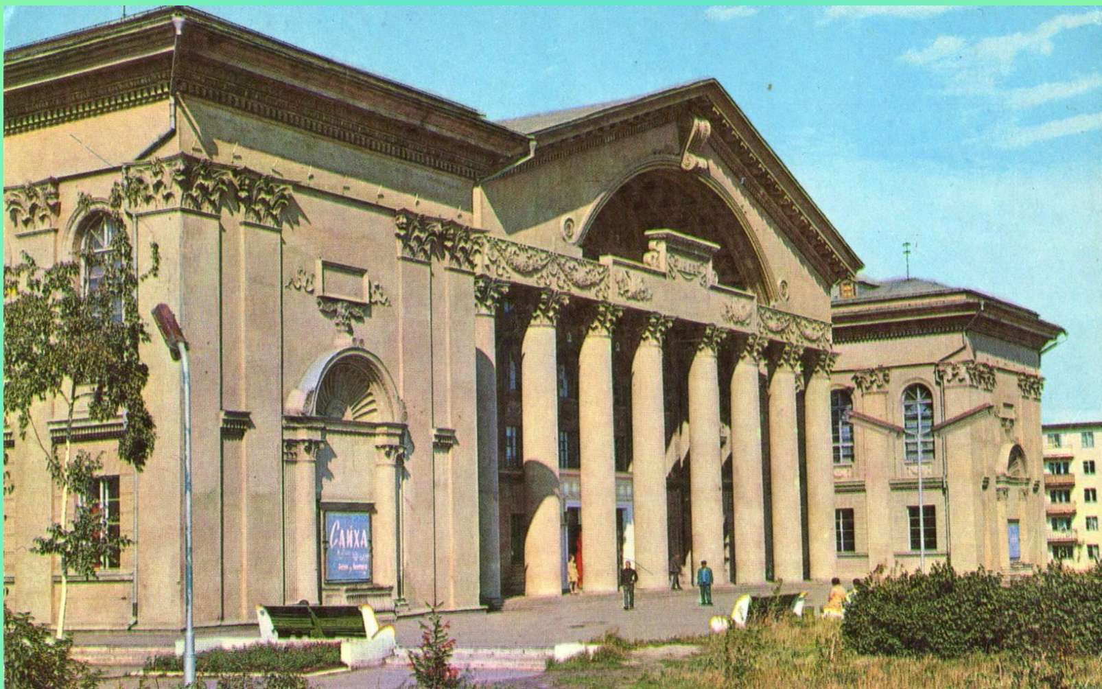
Дворец культуры химиков