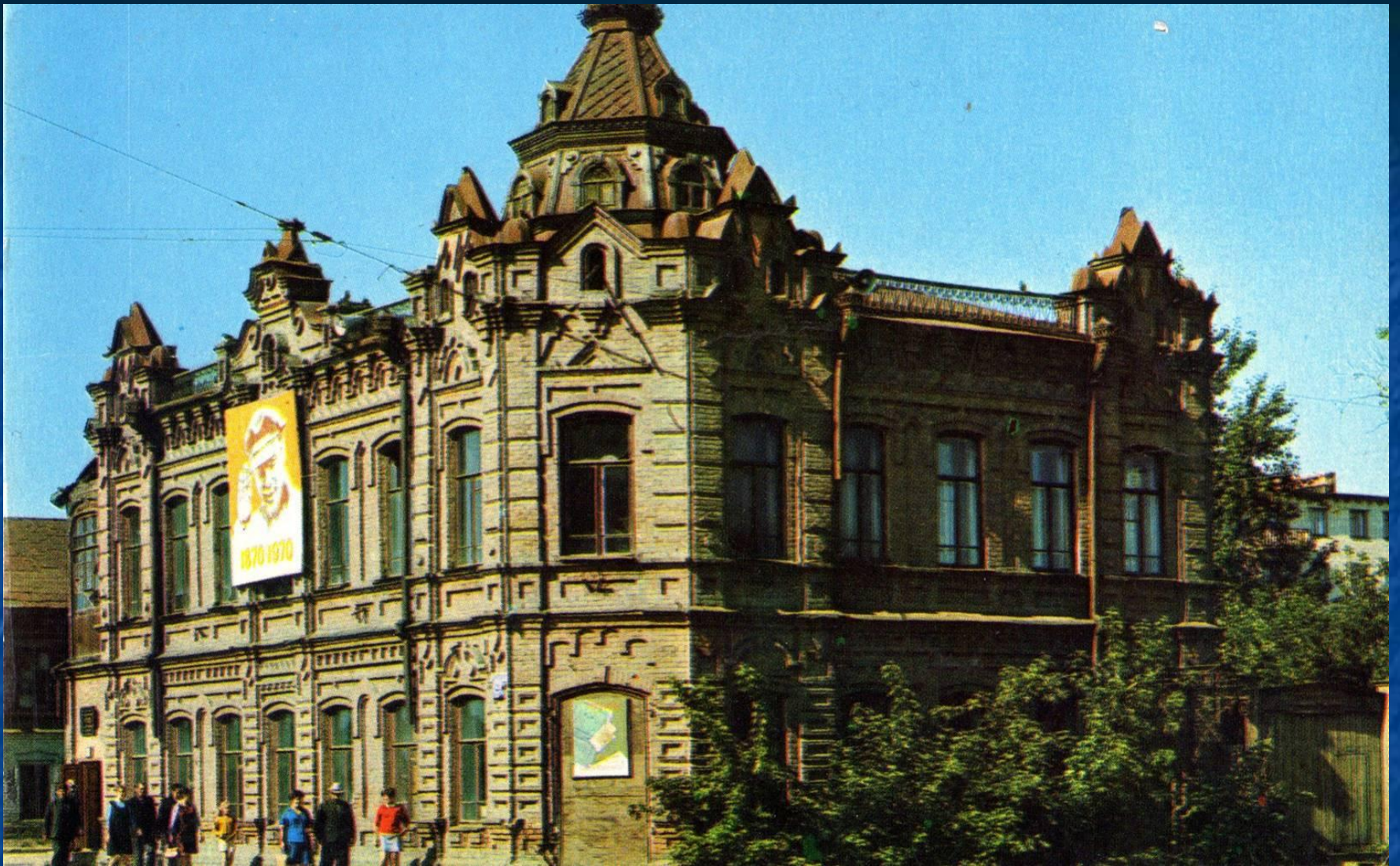
Краеведческий музей имени В.Бианки