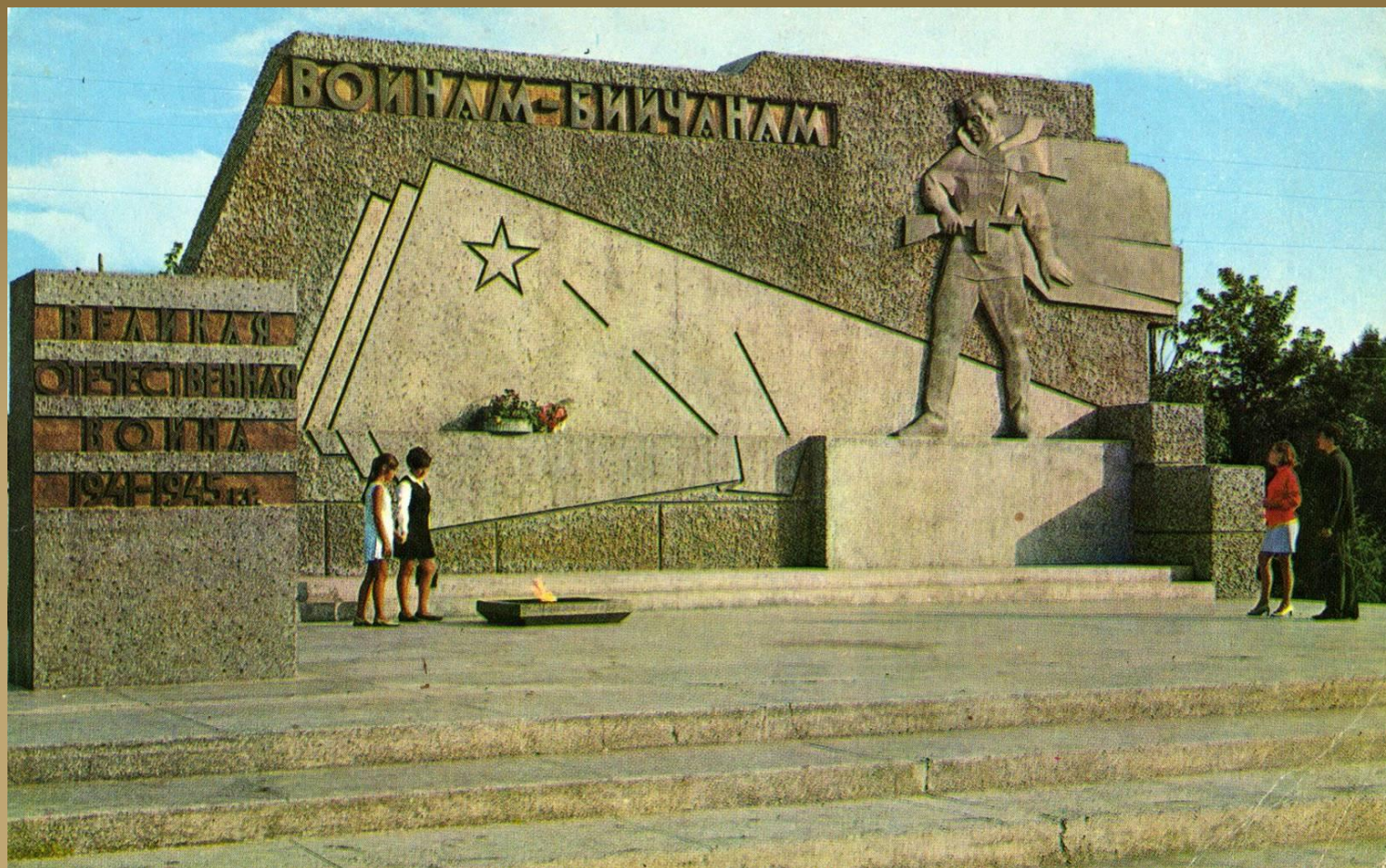
Монумент воинам-бийчанам в сквере Героев Великой Отечественной войны