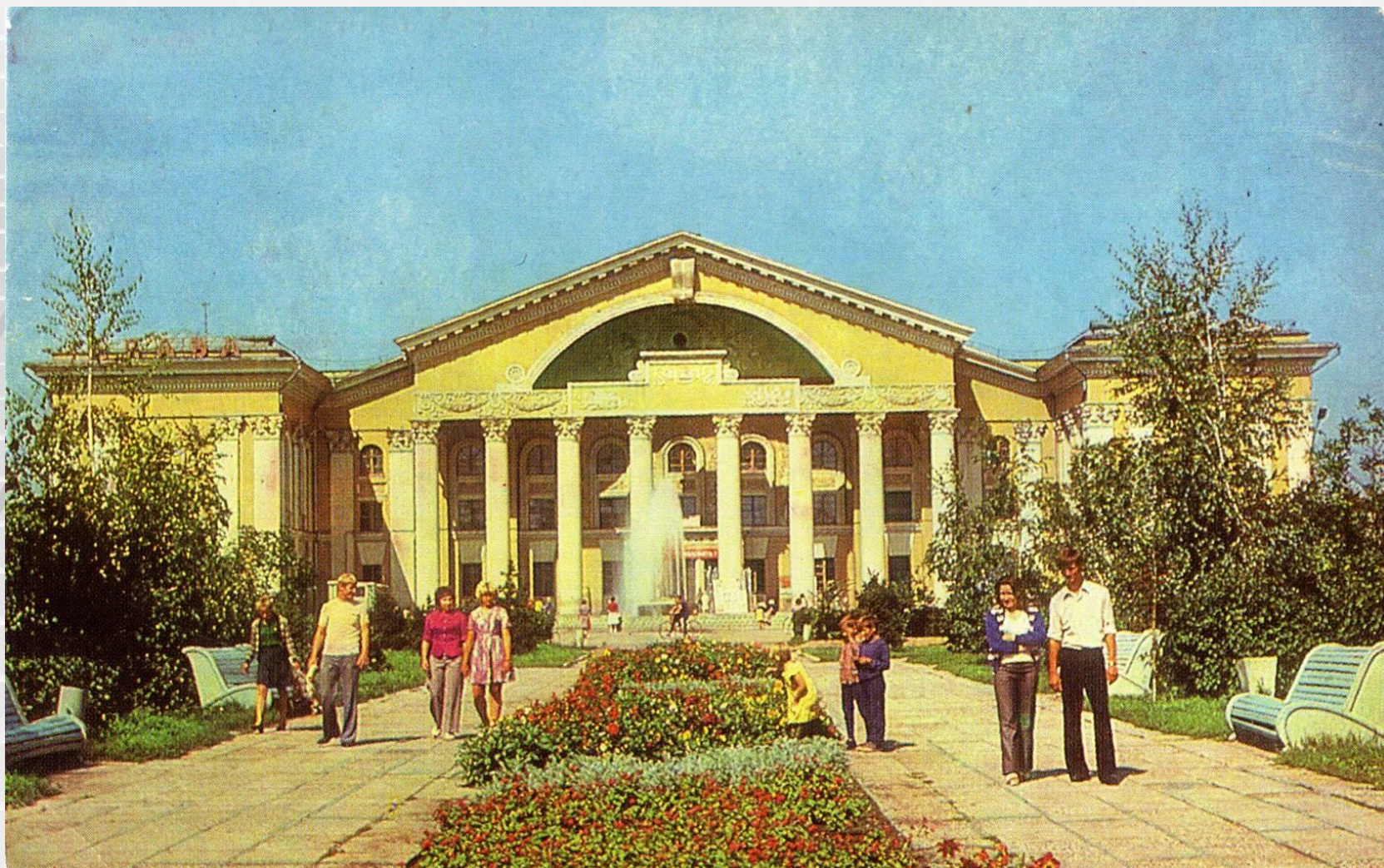
Городской дворец культуры