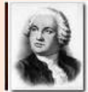
Алессандро Вольт Алессандро Вольт