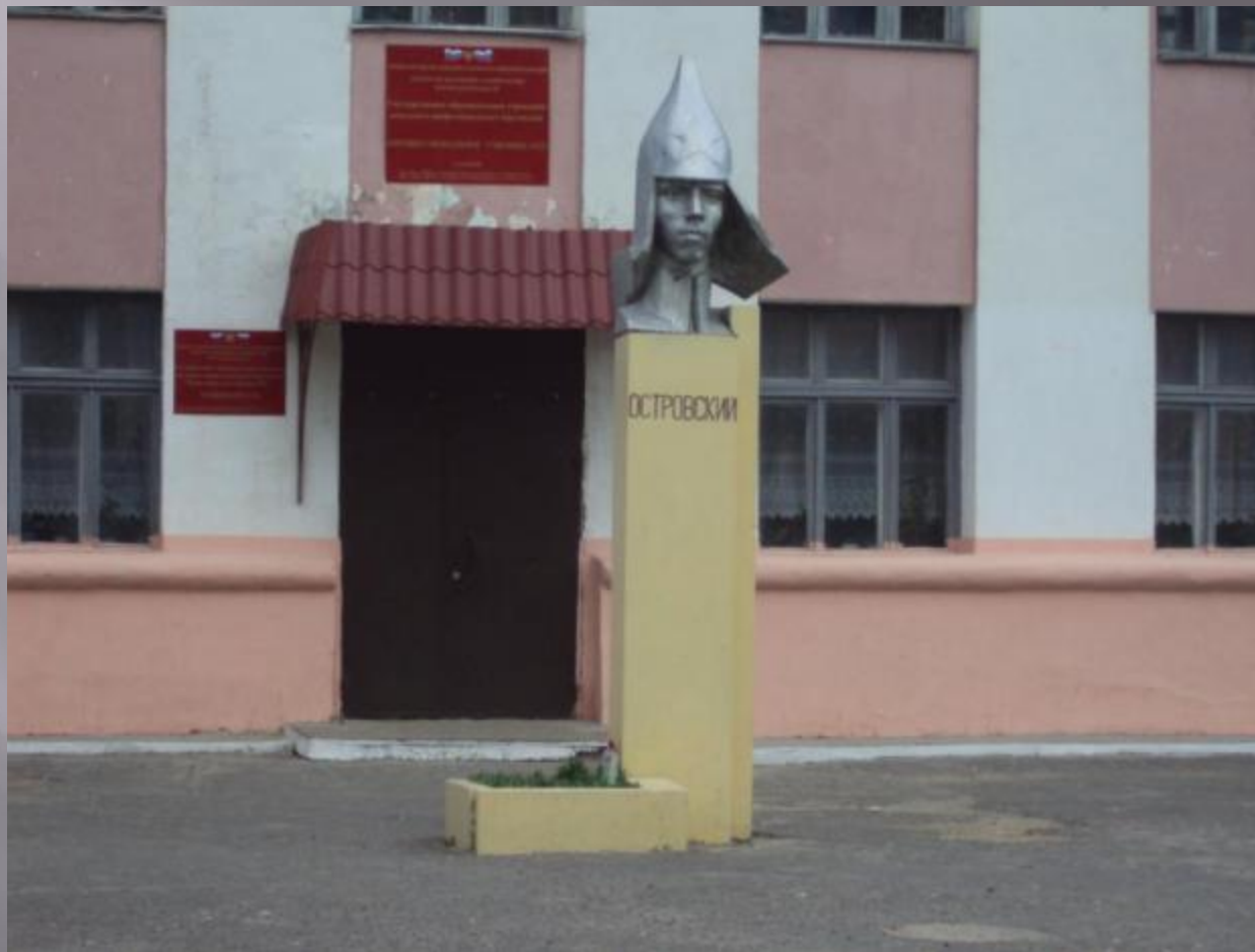
Бюст Н. А. Островского у профессионального училища №22