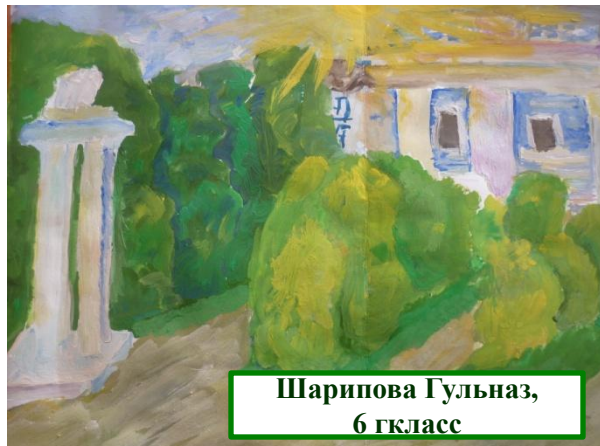
Шарипова Гульназ, 6 гккласс

Первый эшелон туймазинской нефти угленосных отложений был отправлен с разезда Уруссу на Серафимовский нефтеперерабатывающий завод 1 мая 1940 года.