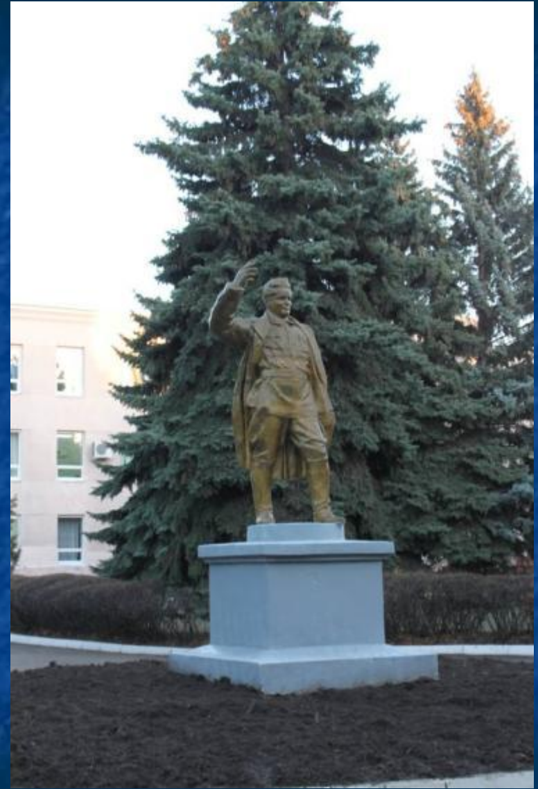
Памятник С.М. Кирову. 2010 г.