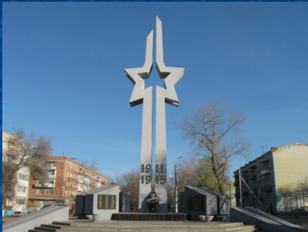
2010 год - после реконструкции.

К 65-летию Победы, в 2010 году, обелиск был капитально отремонтирован. Территория вокруг него была благоустроена. Подходы к нему выложили плиткой и разбили клумбы с цветами. Обелиск по праву считается любимым местом жителей посёлка. В школьном историко-краеведческом музее МОУ «СОШ №21» хранится уникальный альбом с фотографиями и информацией по хронологии изготовления и установке обелиска. Например: его высота – 21 метр, вес – 28 тонн, глубина фундамента – 4х4х2,5 м.