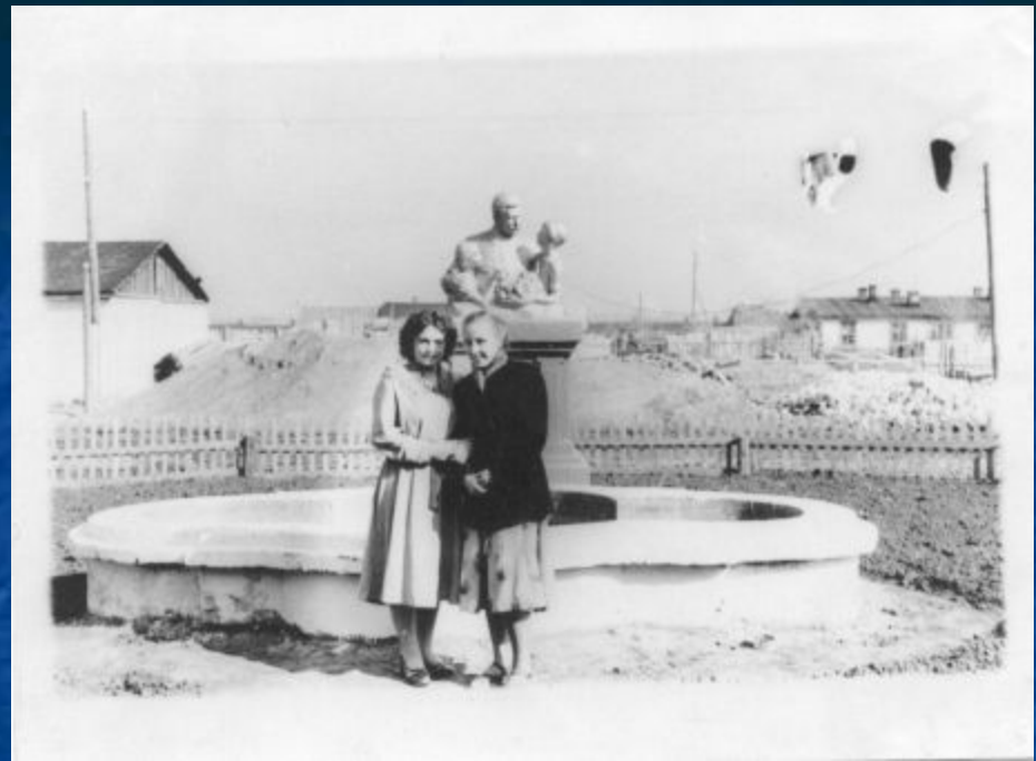
Бюст тов. И.В. Сталину. Пос. Приволжский.(кон. 30-кон. 50-х гг. 20 в.)

Приблизительно, с конца 30-х до конца 50-х гг. напротив конторы мясокомбината находился бюст И.В. Сталину. Композиция включала в себя Вождя, в окружении детей (обыватели поговаривали, что это дети Вождя – дочь Светлана и сын Василий). Вокруг памятника был разбит цветник и небольшой, действующий фонтан. В последствии, выполняя решения 20 съезда партии, который осудил культ личности Сталина, бюст был демонтирован.