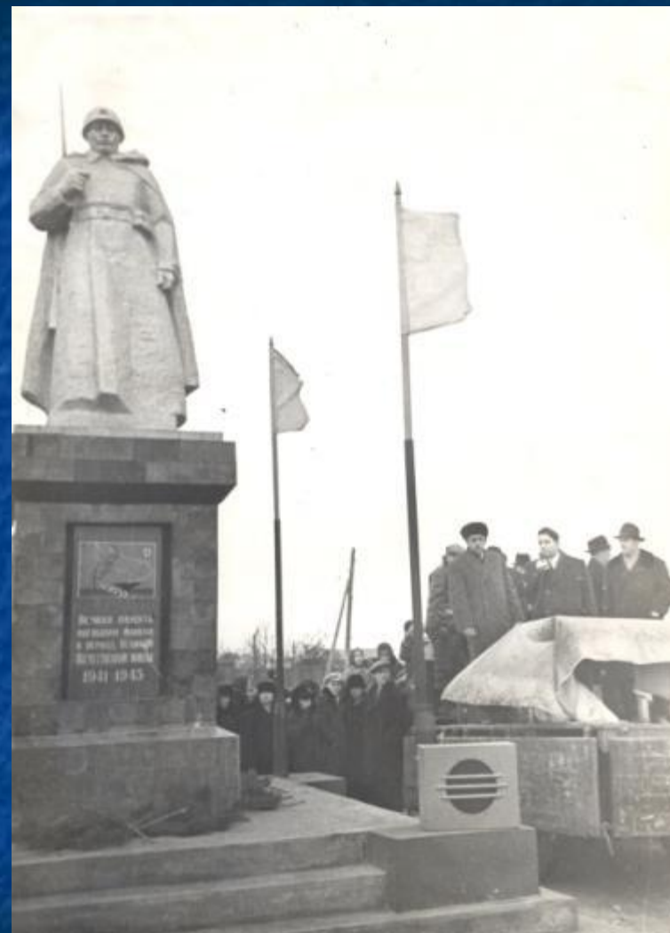
Открытие памятника. 3.11. 1968 г.