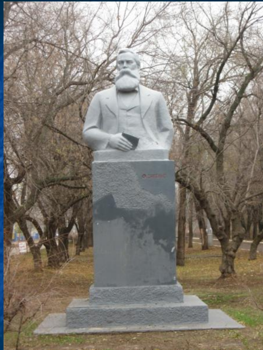
Памятник Ф.Энгельсу. 2010 г.

28 ноября 1966 года у здания управления мясокомбината был открыт памятник Фридриху Энгельсу. Городская газета «Коммунист» в номере за 2 декабря 1966 года, так откликнулась на эти события: «Приволжский посёлок. Празднично убранная площадь у здания управления мясокомбината. На лёгком ветру полощутся красные флаги. По поручению бюро горкома КПСС и горисполкома, секретарь горкома КПСС И.П. Подгайный открывает памятник – бюст Фридриху Энгельсу. С постамента спадает белое покрывало, и взору собравшихся предстаёт скульптурный бюст Фридриха Энгельса. В руке его книга, проникновенный взгляд устремлён в даль...».