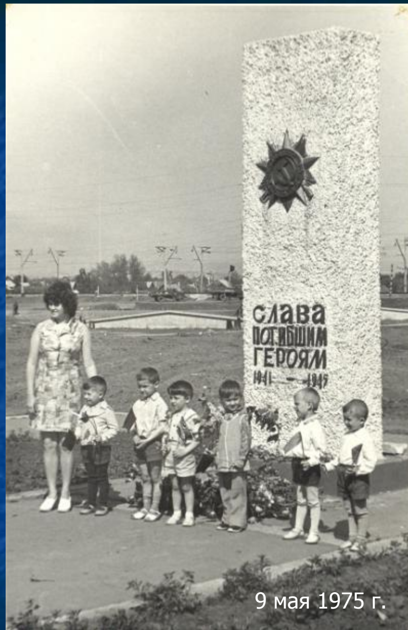
Воспитанники д/с у памятника погибшим героям.

Первый такой памятник был торжественно открыт, при большом стечении народа, в мае 1970 году к 25-ти летнему юбилею Великой Победы, в сквере, напротив Дома культуры мясокомбината. Он представлял из себя прямоугольное основание, на котором была установлена вертикальная прямоугольная бетонная стела с изображением ордена Отечественной войны, изготовленного из бронзы. Ниже помещалась надпись: «Слава погибшим героям 1941-1945 гг.». На оборотной стороне стелы размещались бронзовые доски с именами жителей посёлка, не вернувшихся с полей сражений.