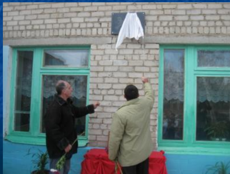
Открытие мемориальной доски. 27.11. 2009 г.