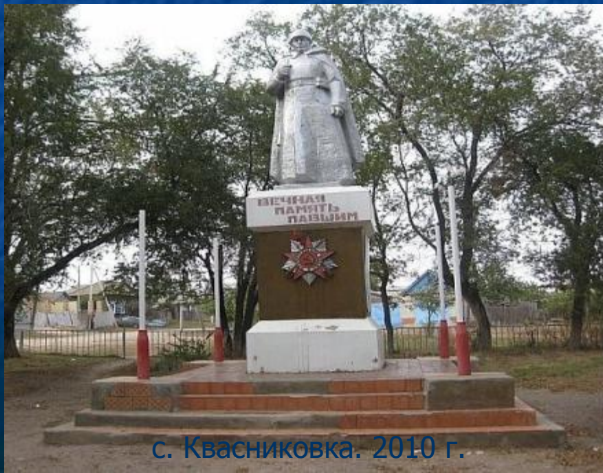
с. Квасниковка. 2010 г.

В селе Квасниковка 3 ноября 1968 года был открыт памятник героям, погибшим в годы Великой Отечественной войны. Автор С. Сазанов. Памятник представляет собой фигуру солдата, выполненную из металла. На постаменте изображён орден Отечественной войны, выше слова: «Вечная память павшим».