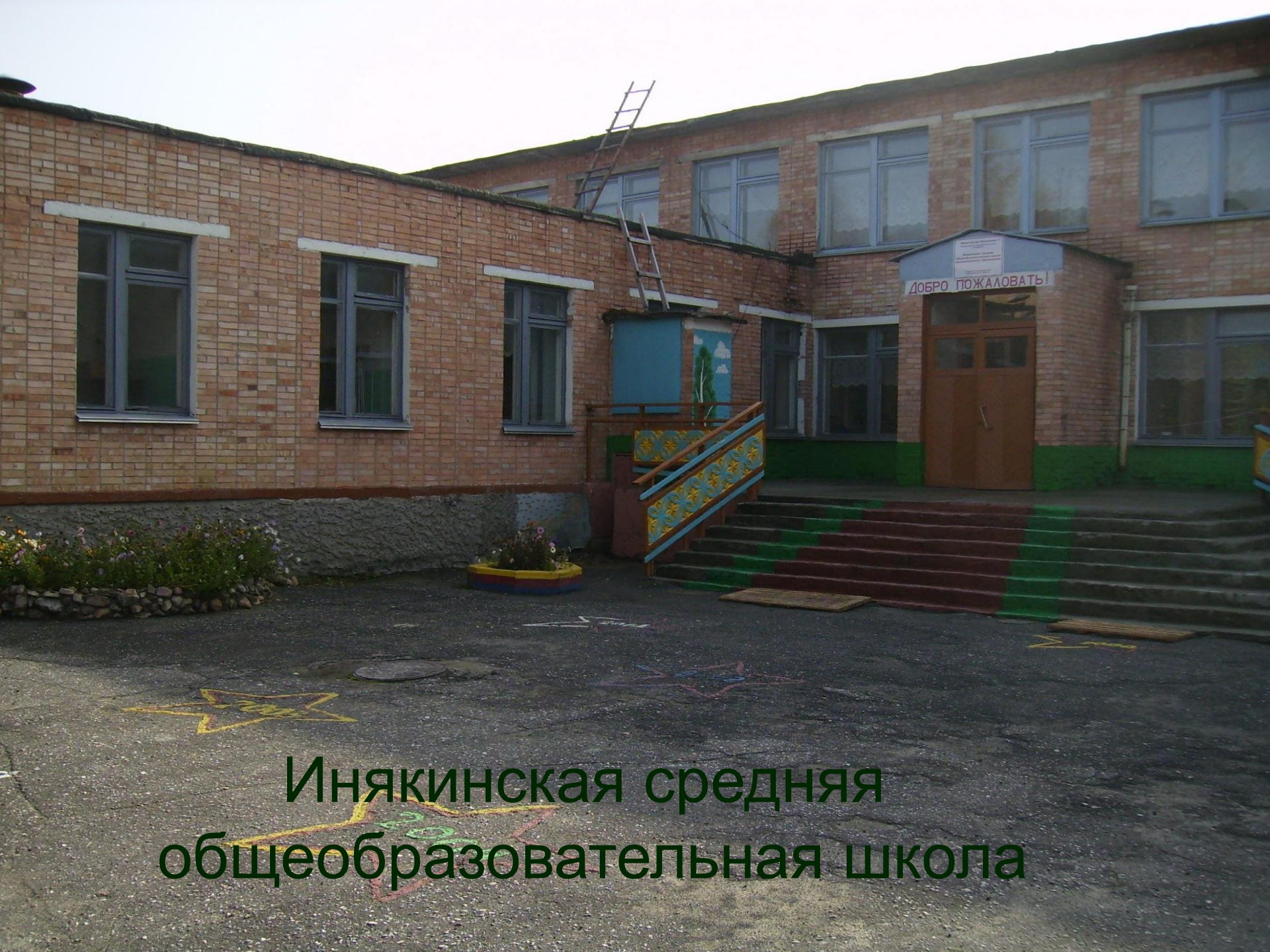
Инякинская средняя общеобразовательная школа