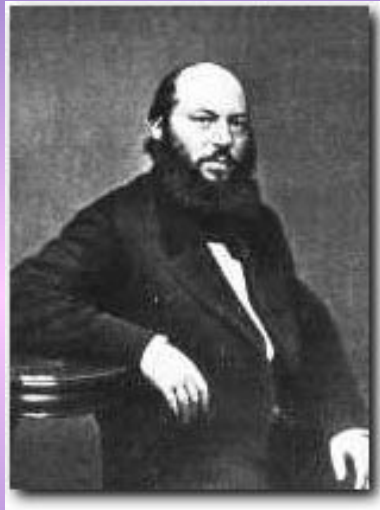
Афанасий Афанасьевич Фет (1820-1892)