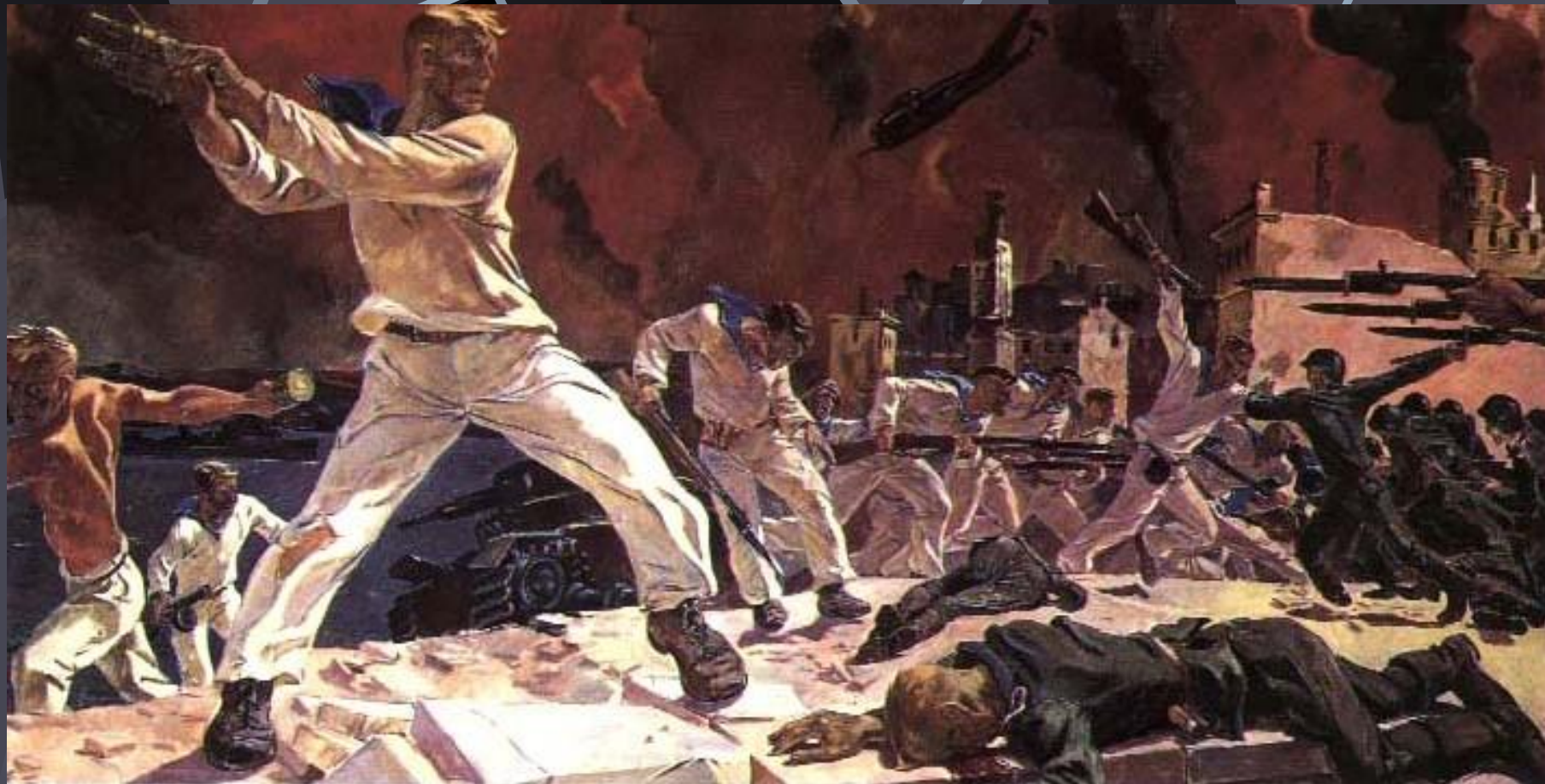
Дейнека А. «Оборона Севастополя» 1942

...кто говорит, что на войне не страшно, тот ничего не знает о войне. Ю. Друнина