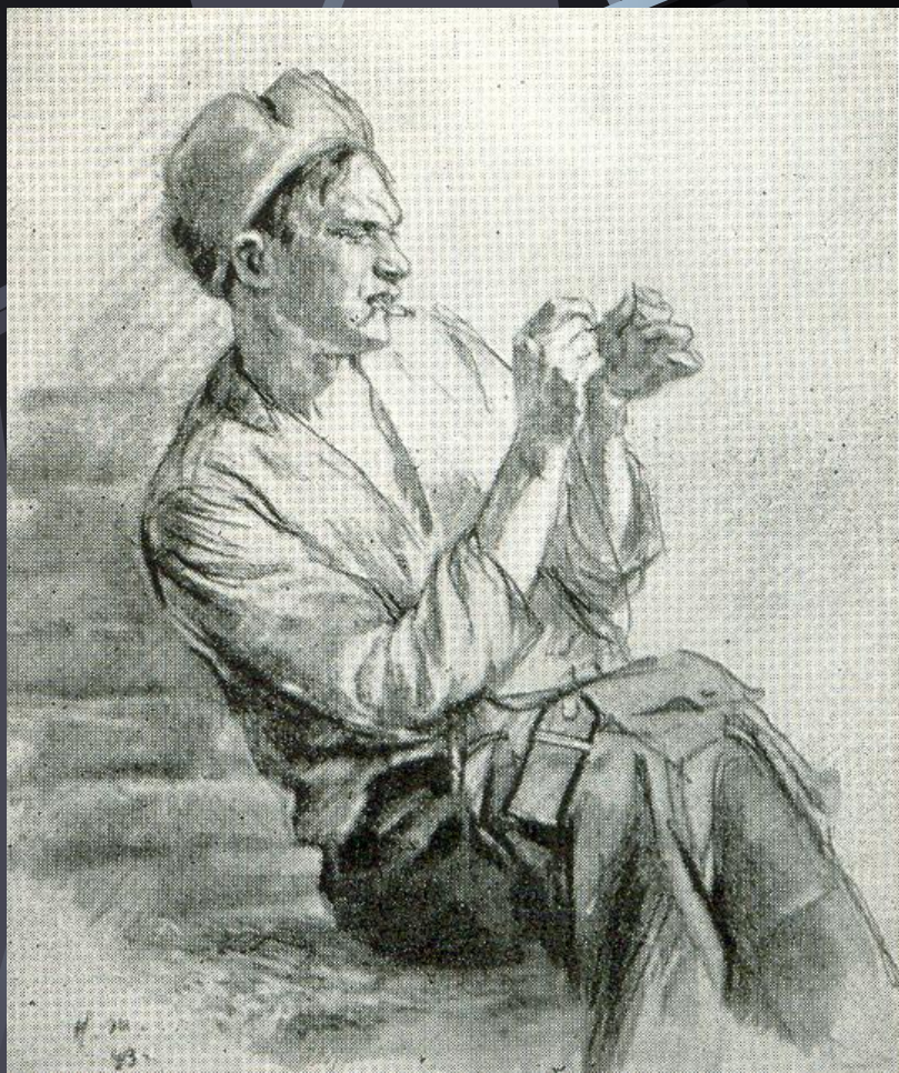
Николай Жуков «Лиха беда – начало»