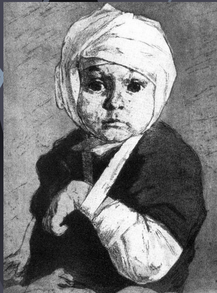
Харшак А. «За что?» (Раненый ребенок)