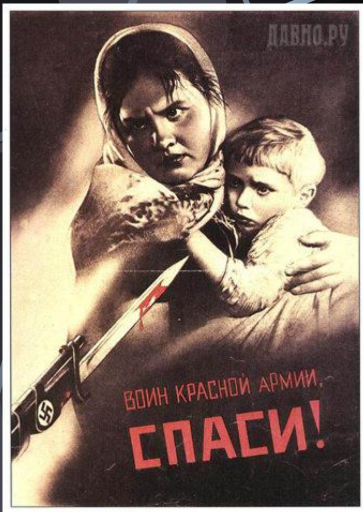
В.Б. Корецкий. 1942