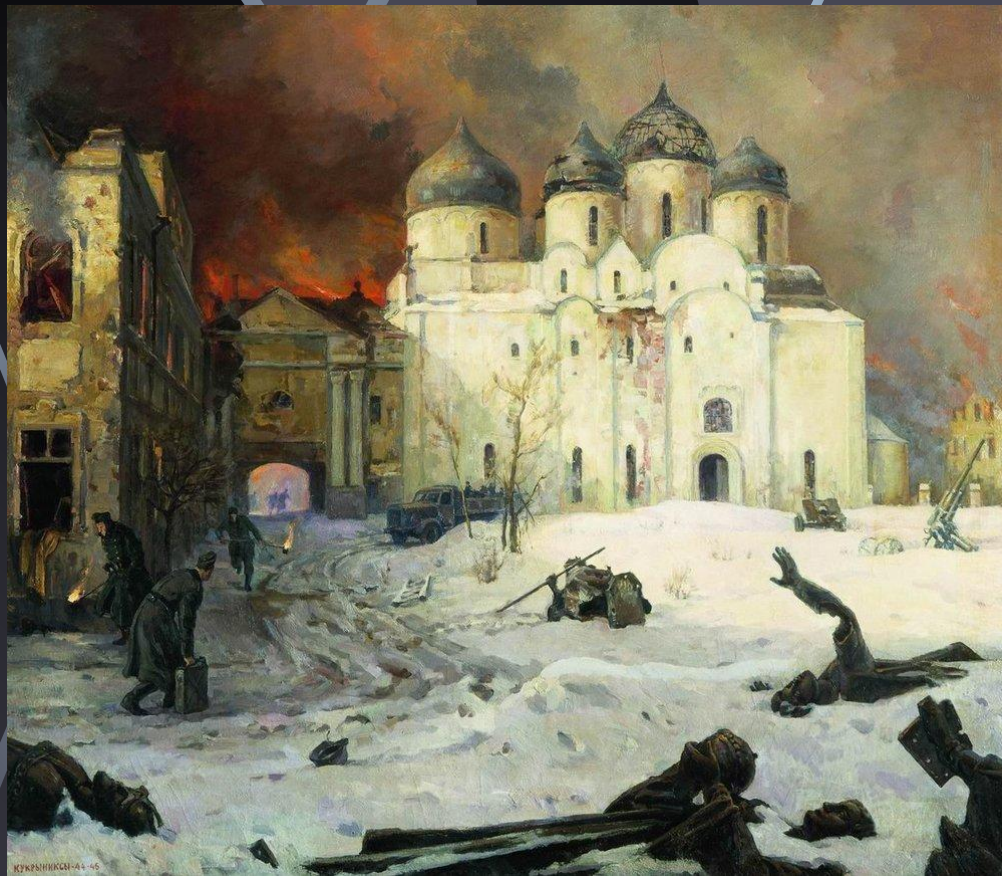
Кукрыниксы «Бегство фашистов из Новгорода»