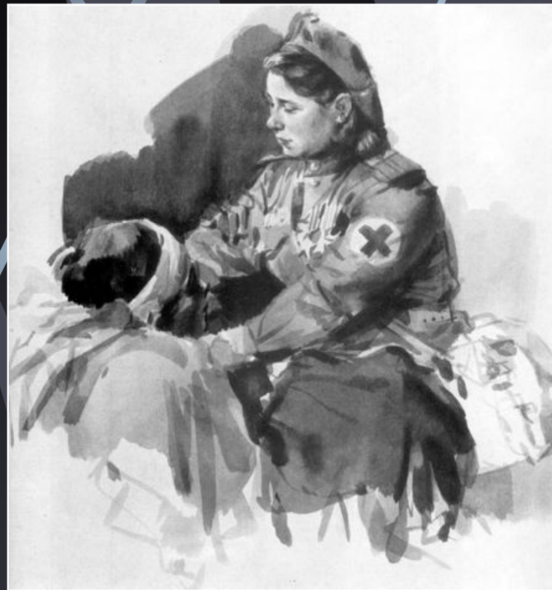
«Ласковые руки» Климашин. В. С.