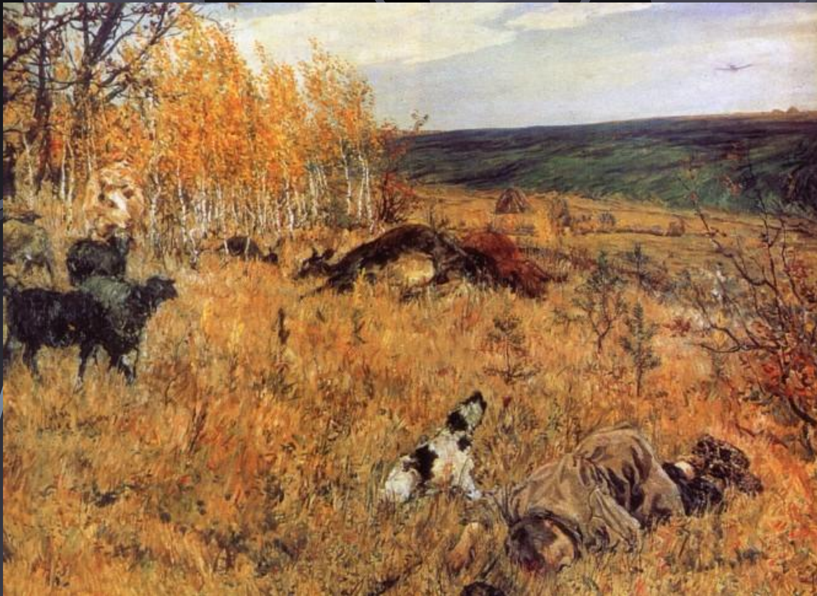
Пластов А. «Фашист пролетел» 1942