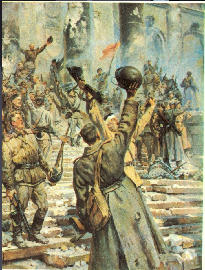
П. А. Кривоногов. Победа!