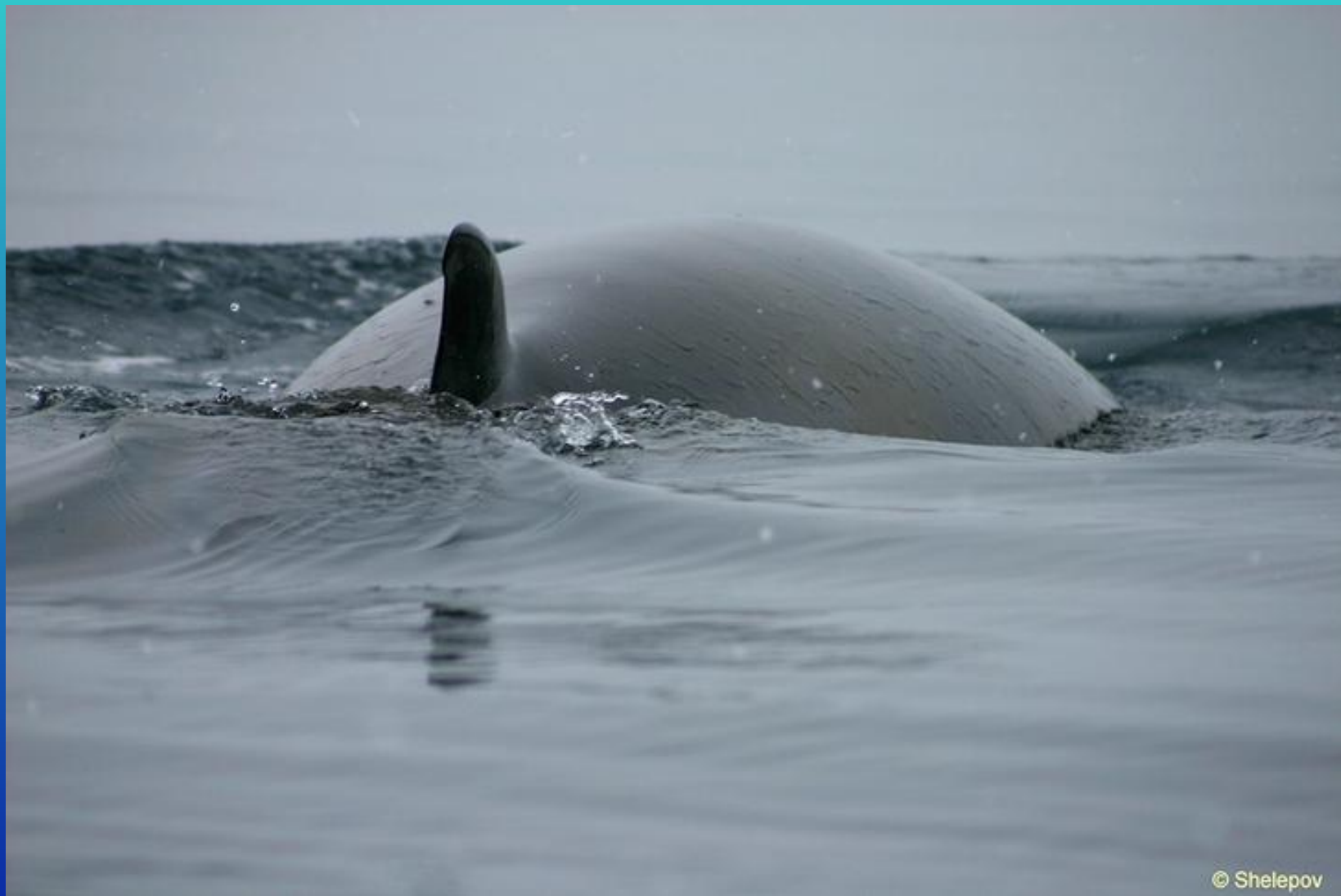
Кит малый полосатик