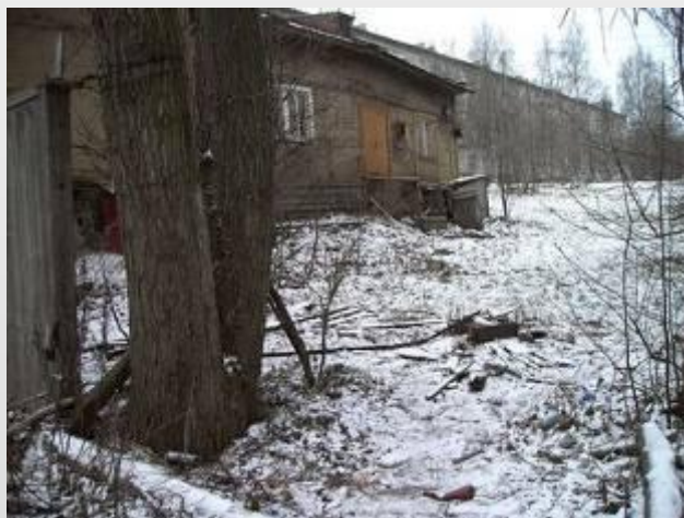
Опасный проходной двор

Маршрут 2: Жилой массив – пространство между ул. Лыжная, Балтийская, Ровио и Парфенова.