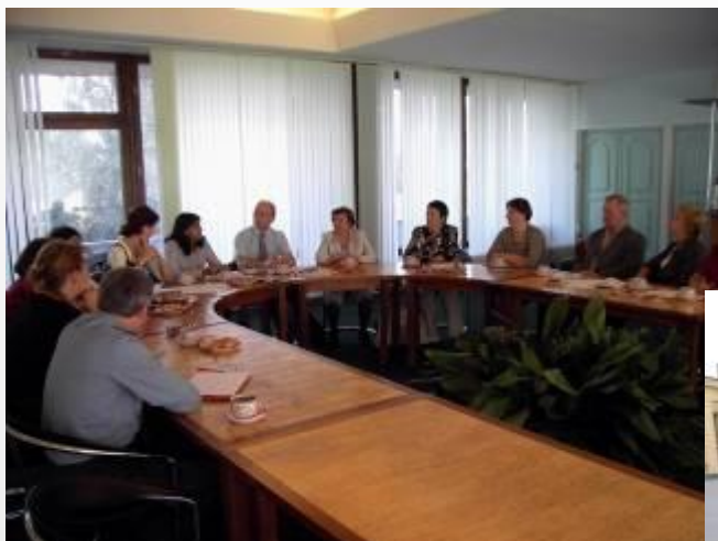
← Встреча в Администрации 20 августа 2009 г.