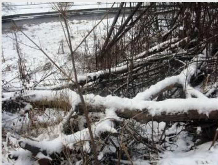
Берег реки Лососинки

Маршрут 2: берег реки Лососинки – от ул. Калинина до ул. Мерецкова. Время и дата аудита: 12 декабря 2009 г., с 12.00 до 13.30. Погода: -11 С.