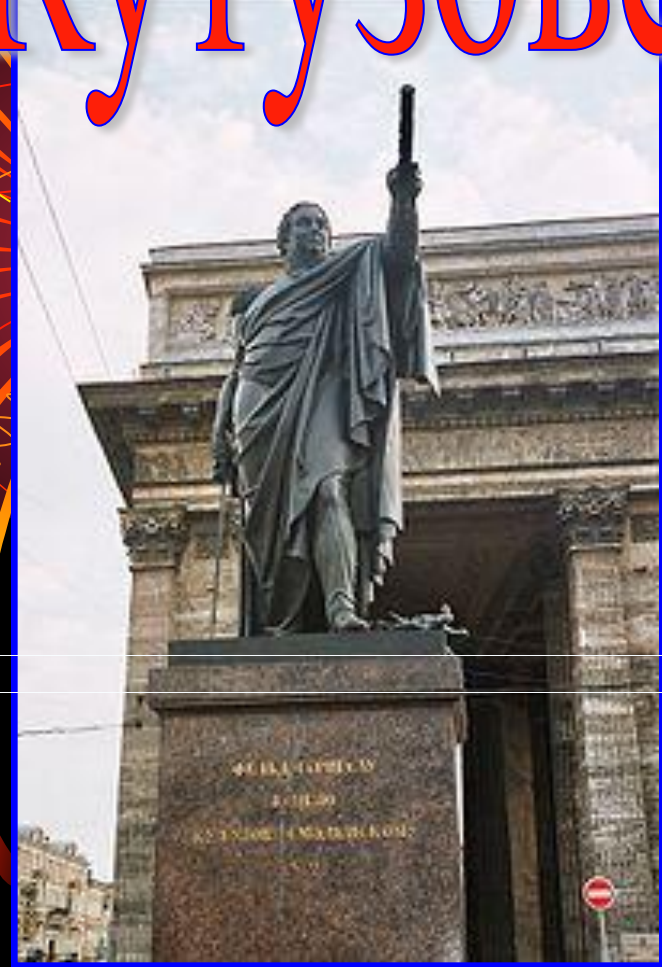
Памятник Кутузову в Москве