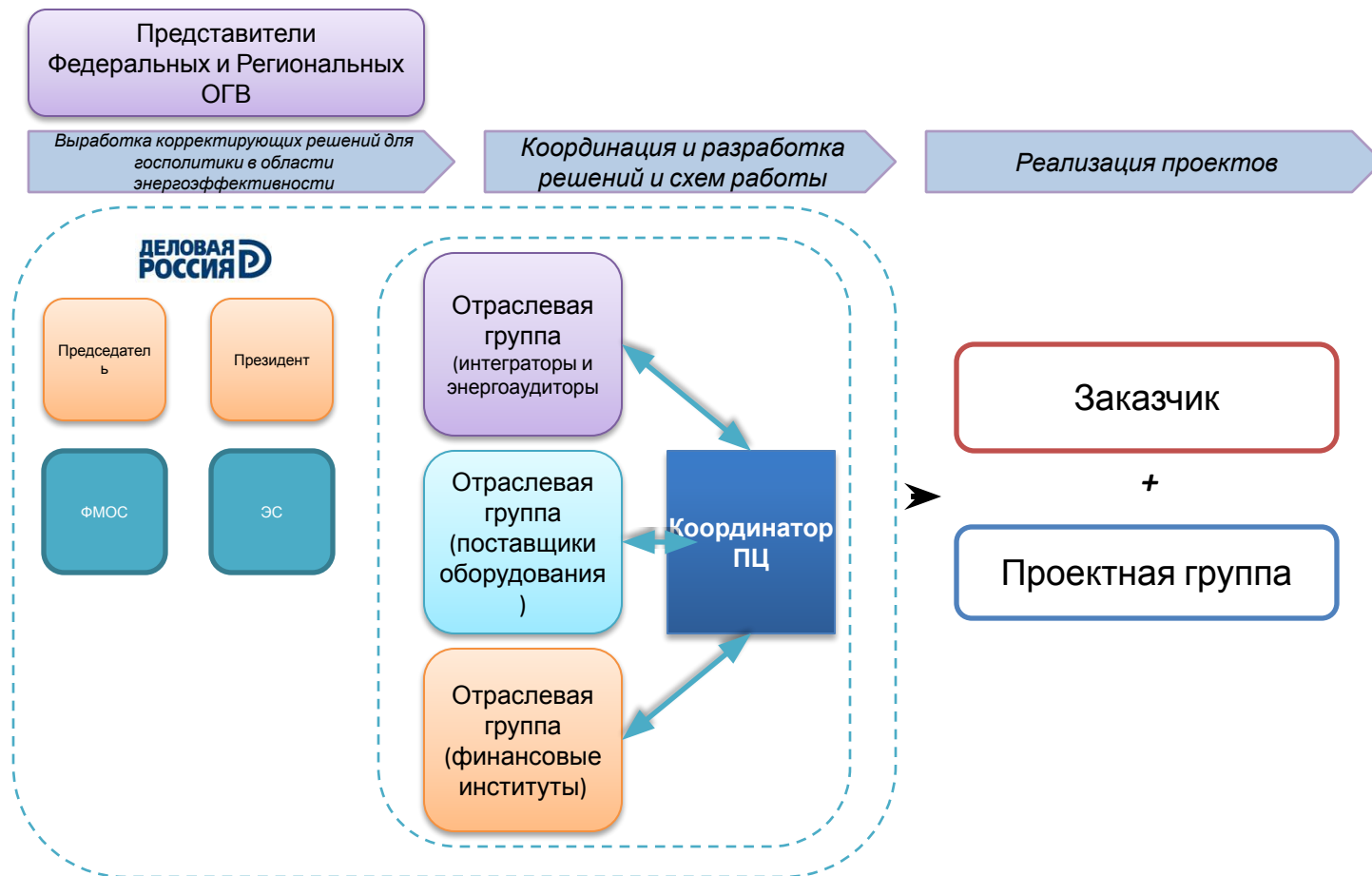
Схема работы Проектного Центра – отражение проектного подхода к энергоэффективности, интегрирующая на площадке Центра производителей, консультантов, финансовые институты и Заказчика