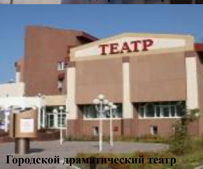
Городской драматический театр