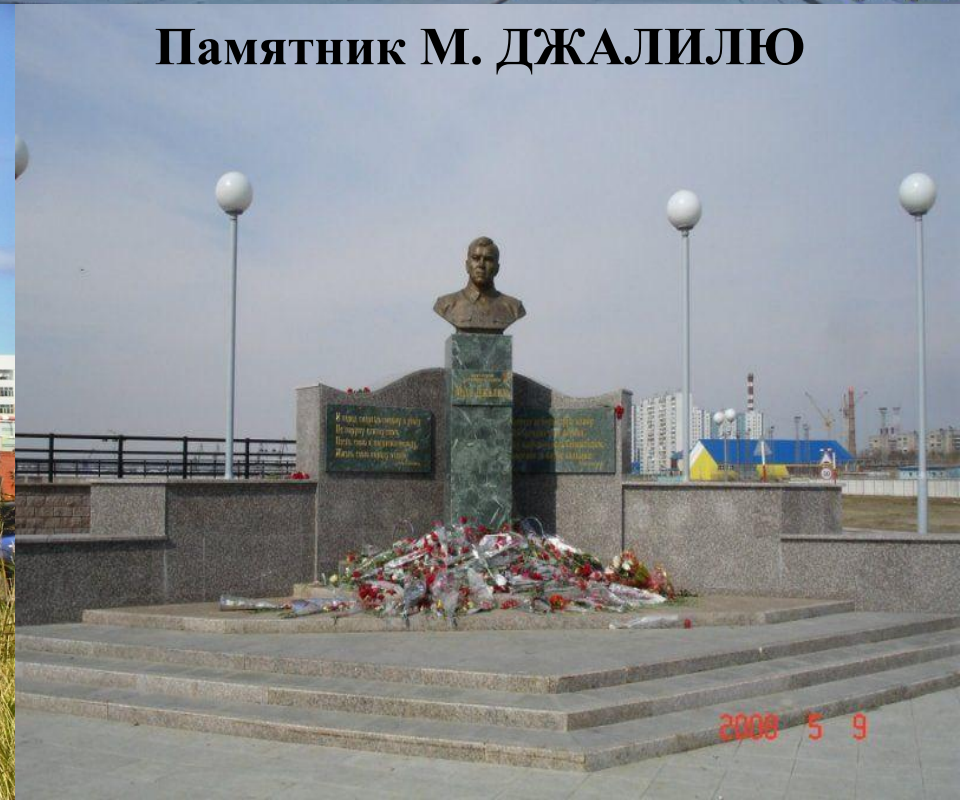
Памятник М. ДЖАЛИЛЮ