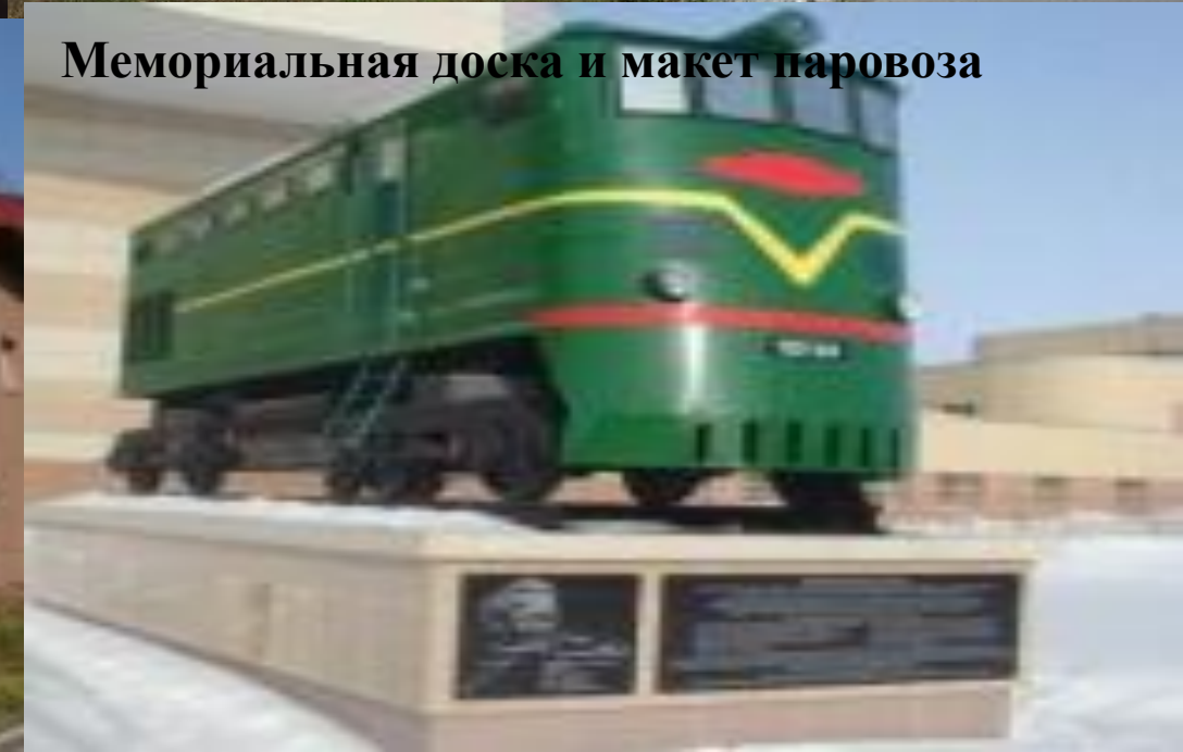
Мемориальная доска и макет паровоза