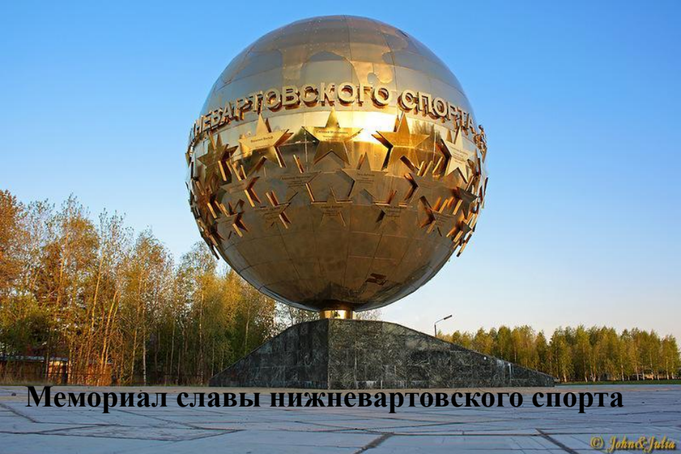
Мемориал славы нижевартовского спорта