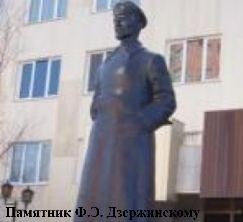
Памятник Ф.Э. Дзержинскому