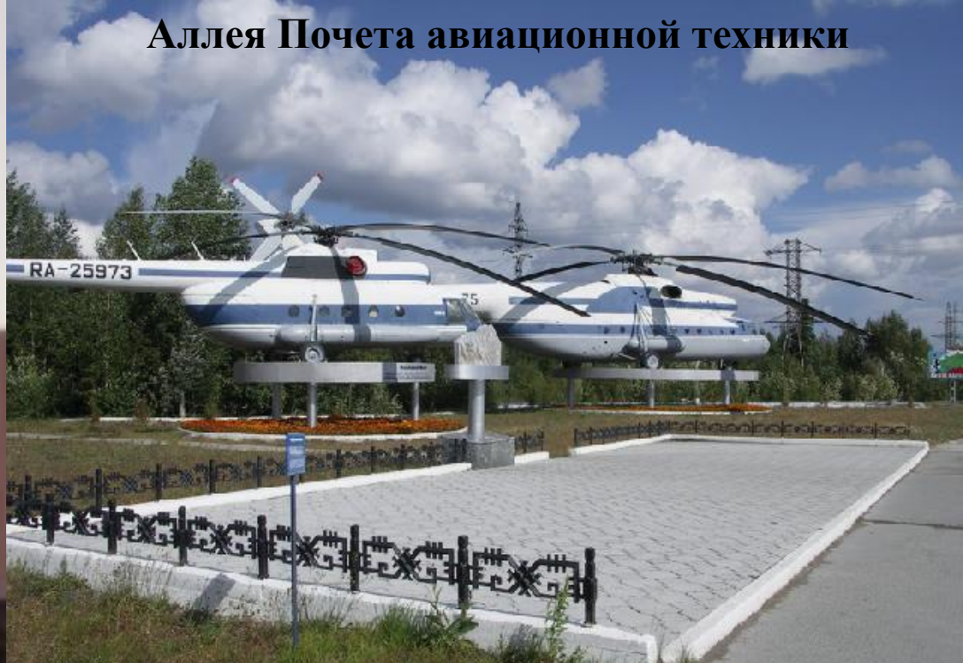
Аллея Почета авиационной техники