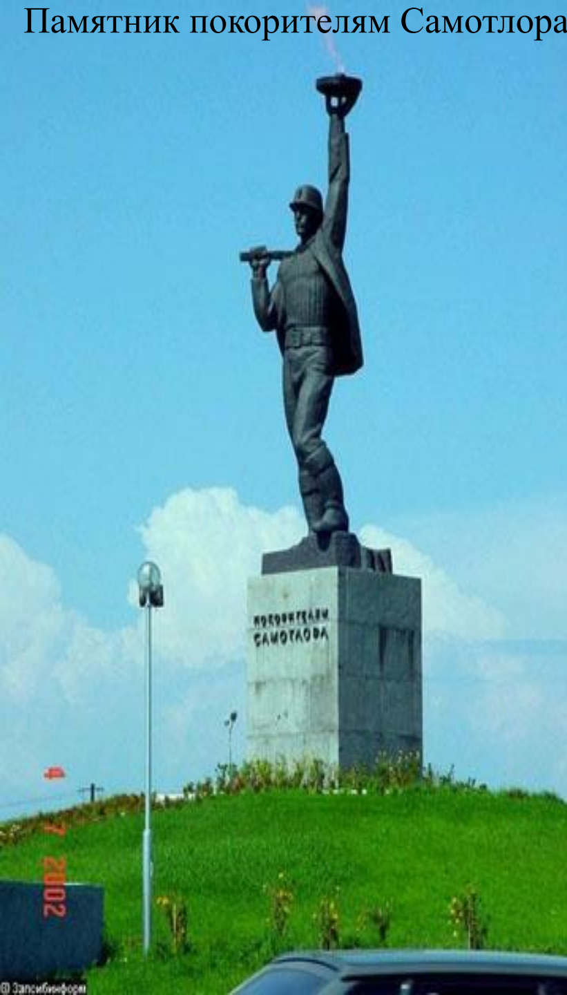
Памятник покорителям Самотлора