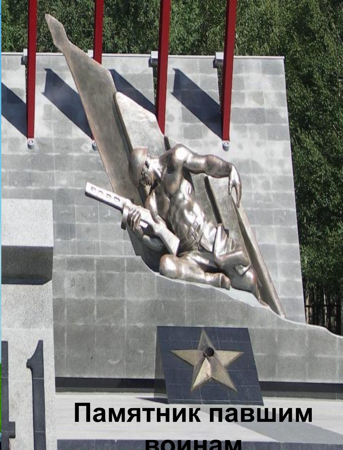
Памятник павшим воинам