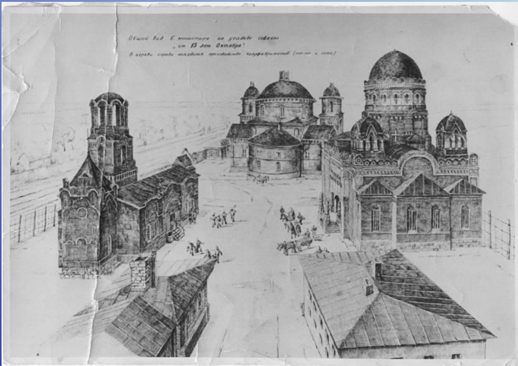
Вид монастыря в начале 20 века

Общий вид Е. монастыря на усадьбе сохранил к 15 лет Октября! В церкви слева находится произведение каменотесов (меч и крест)