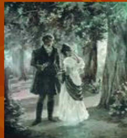
«Двое в декабре»