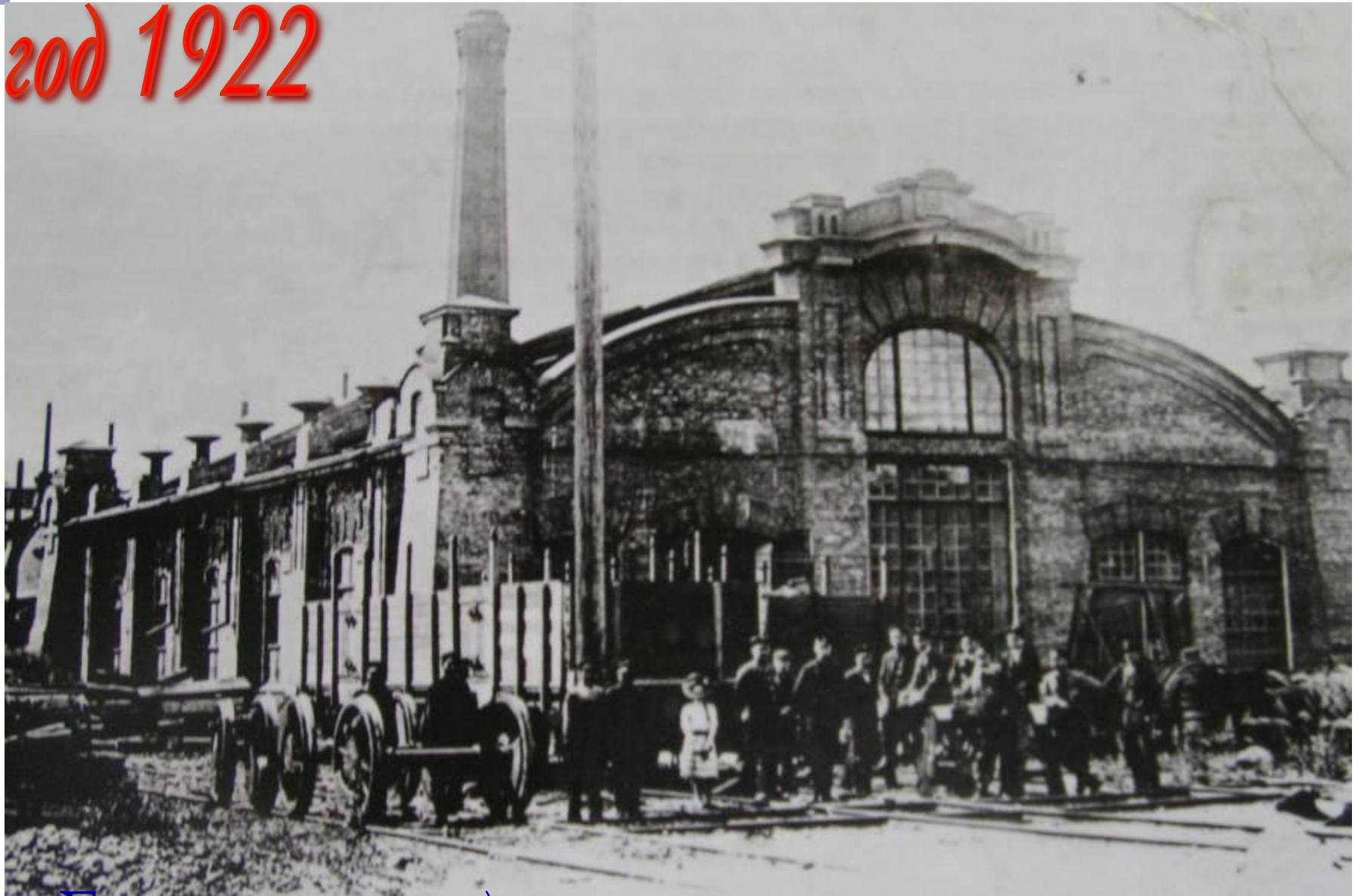
Главные железнодорожные мастерские