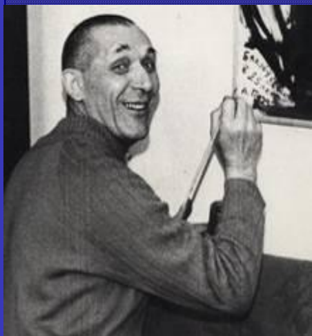
В. П. Астафьев