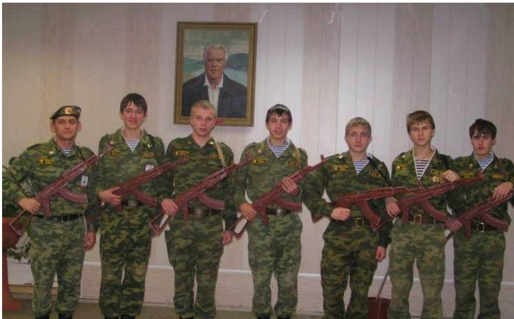
В училище работает армейско-спортивный клуб «Защитник»