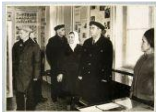
Экспозиции по другим предприятиям узла. Открыты в 1981г.