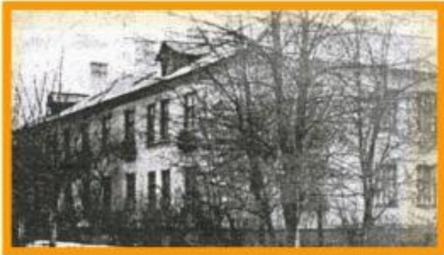
Первый жилой дом, построенный в годы народной стройки