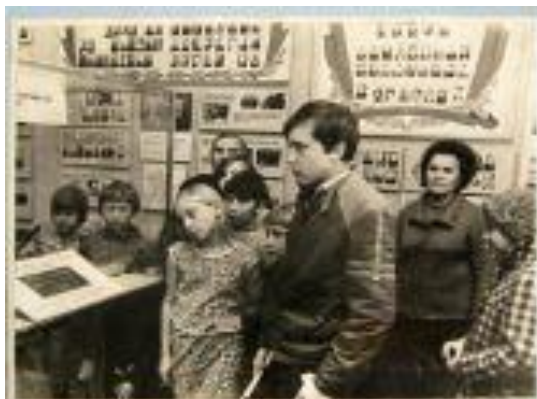
Экспозиции по материалам локомотивного депо открыты в 1980 году.