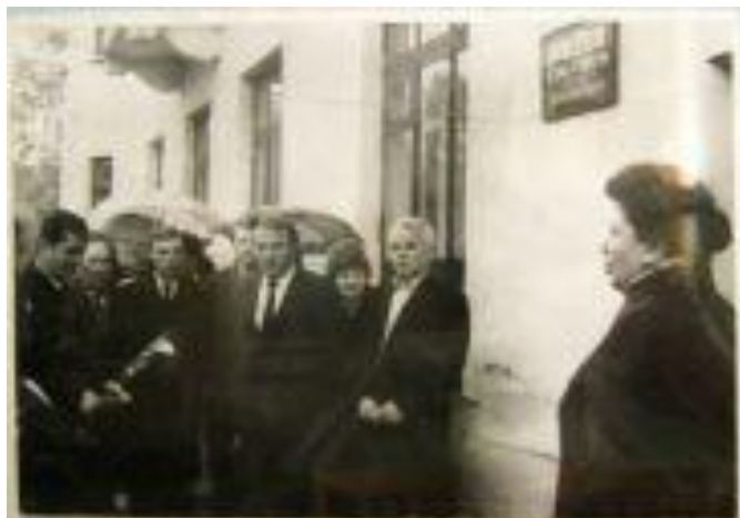
Открытие музея 8 мая 1990г.