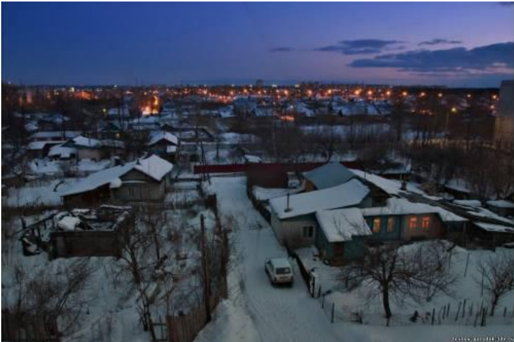
Частный сектор поселка Сортировочный