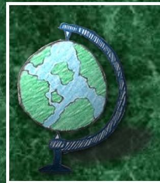
потребление товаров и услуг