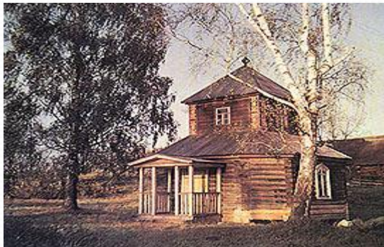
Часовня в Малинниках

Сегодня Малинники – это небольшая живописная деревенька. От прежнего времени остался разросшийся парк, спускающийся к речке Тьме, фундамент усадебного дома, часовня. В парке установлена гранитная стела с пушкинским профилем.