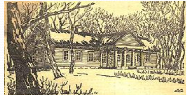
Дом в Малинниках