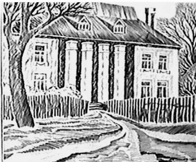
Дом в Курово-Покровском