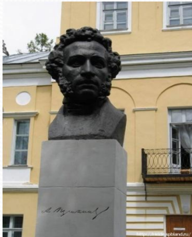
Памятник А. С. Пушкину

Одно из любимых мест Пушкина в Тверской губернии – село Берново древнее, красивое расположенное вдоль речки Тьмы, с обветшавшей церковью, с белеющим на взгорке старым особняком... И на первый взгляд ничего необычного мало ли таких сел по России! Но перед приезжими людьми открывались удивительные, живописные места с гостеприимными, скромными, чтящими былые люди. Берново- это место, где сохранился дух Пушкина и его времени, где еще поэт гулял в парке под пышными кронами тех деревьев, которые растут и сейчас, по тем дорожкам и около того пруда, что продолжает жить своей жизнью и сейчас. В доме Вульфов сохранились гостиные, спальни, залы, в которых Пушкин отдыхал и работал.