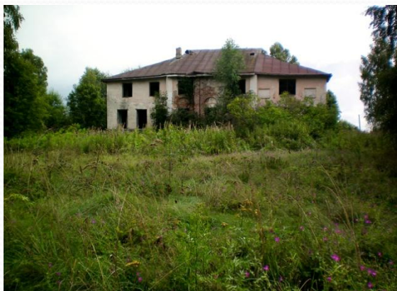
Усадьба в Курово-Покровском современный вид