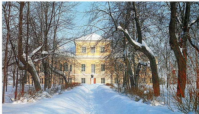
Музей А. С. Пушкина. Бывшая усадьба Вульфов