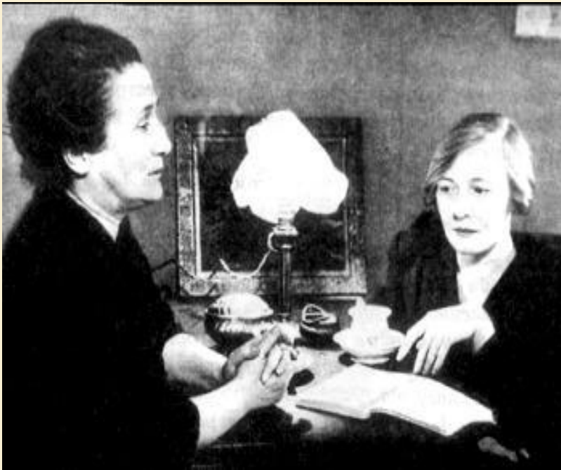
Анна Ахматова и Ольга Берггольц.