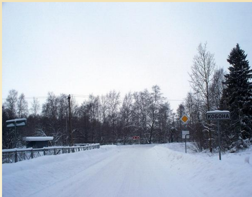
Родная деревня - Кобона.