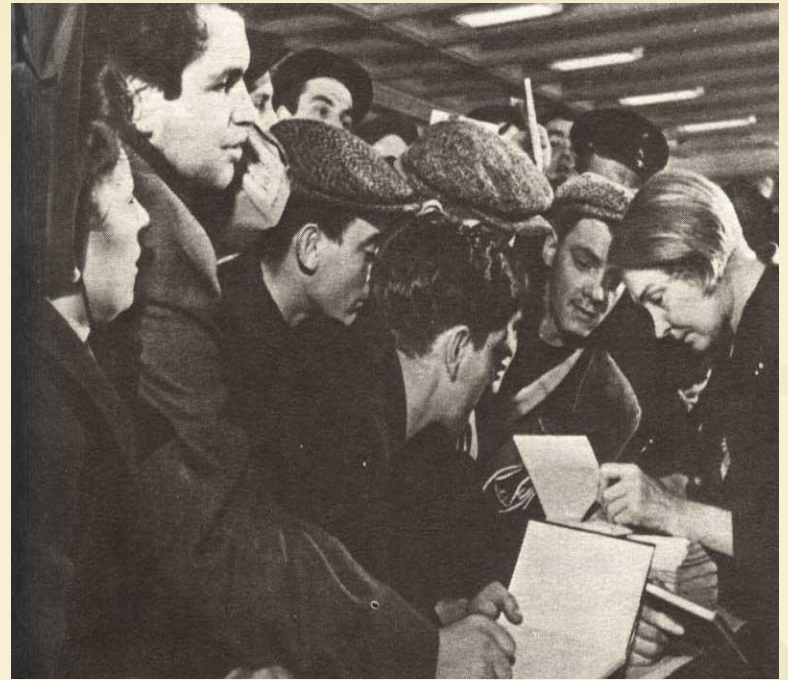
Ольга Берггольц. подписывает свои книги.

Летом 1939 года Берггольц была освобождена И полностью реабилитирована.