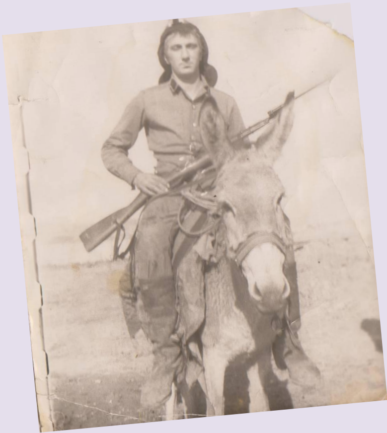
« На войне ,как на войне..»