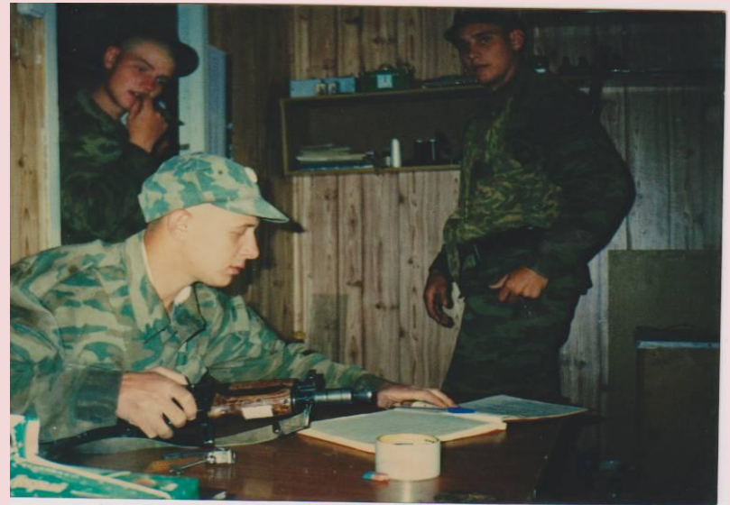
Подготовка к рейсу