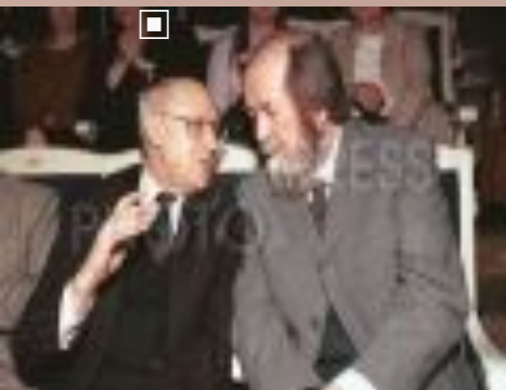
Солженицын и академик А.Сахаров.