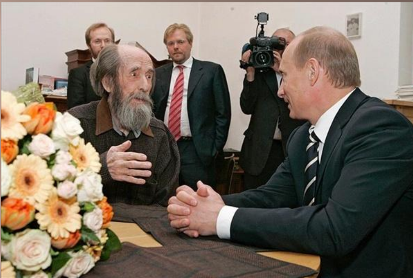
С президентом РФ Владимиром Путин ым во время вручения Государственной премии Александру Солженицыну , Троице - Лыково, 2007 год