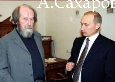
Бесела с президентом.

В декабре 1998г 80-летие писателя отмечалось в театре на Таганке.