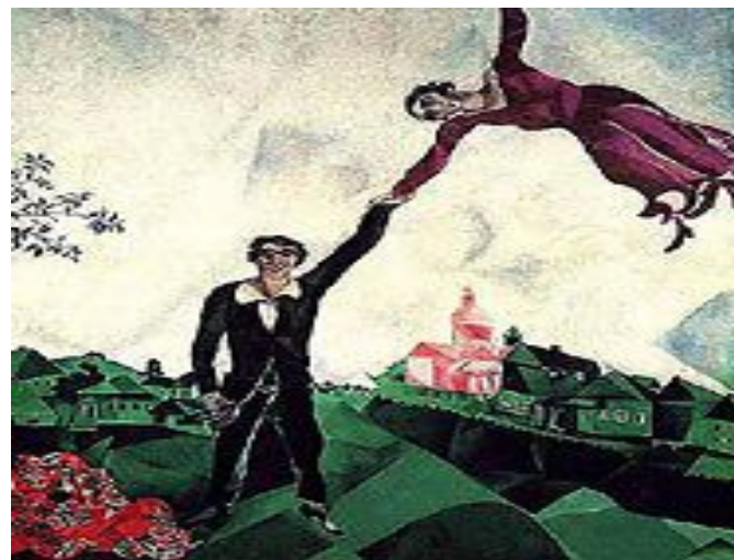
Марк Шагал. Влюбленные. Прогулка. 1917. Государственный Русский музей.