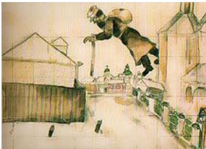
Марк Шагал. Над Витебском. 1914. Русский Музей