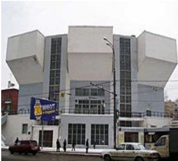
Клуб им. Русакова в стиле конструктивизм (1927-1929). Архитектор К. С. Мельников