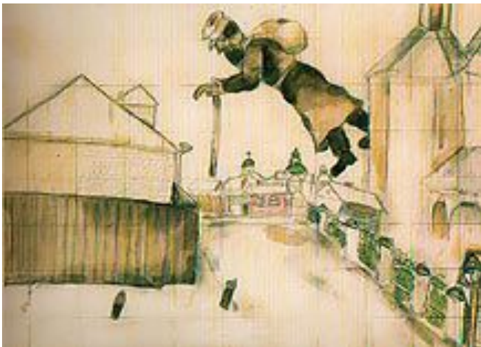
Марк Шагал. Над Витебском. 1914. Русский Музей