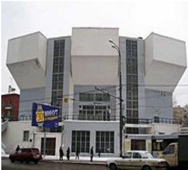
Клуб им. Русакова в стиле конструктивизм (1927-1929). Архитектор К. С. Мельников