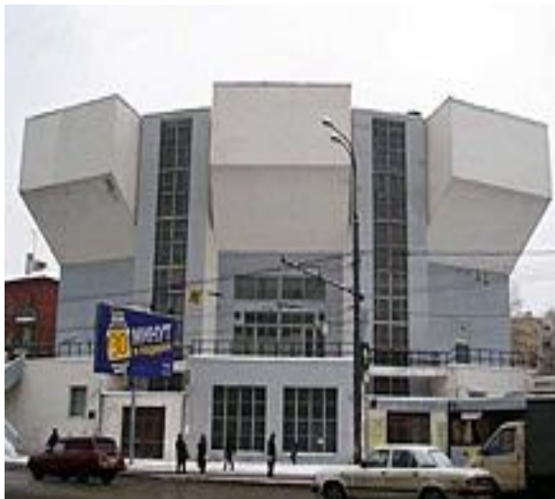
Клуб им. Русакова в стиле конструктивизм (1927-1929). Архитектор К. С. Мельников