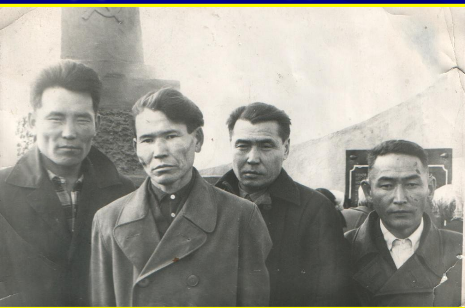
На открытии памятника (1965г)