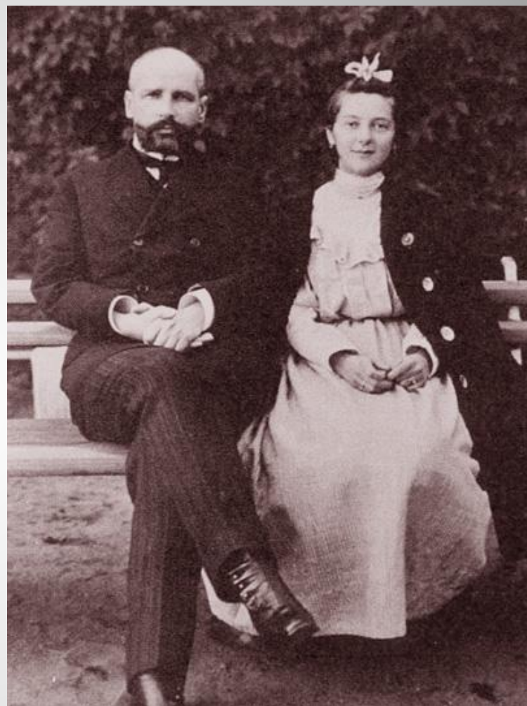
П.А.Столыпин и Наталья Петровна.

Наталья Петровна - родилась в 1889; 12 августа 1906, в момент покушения на ее отца, являвшегося премьер-министром, находилась в его резиденции; в результате теракта у Натальи были изуродованы ноги и она навсегда осталась инвалидом; стала фрейлиной императрицы; в 1915 вместе с сестрой Ольгой сбежала на фронт, но беглянок арестовали и вернули в родительский дом; вышла замуж за князя Юрия Волконского, исчезнувшего после ряда неудачных финансовых сделок в 1921; переехала во Францию, где осенью 1949 умерла от рака.