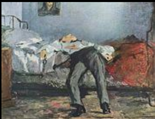
Эдуард Мане: Суицид, 1877