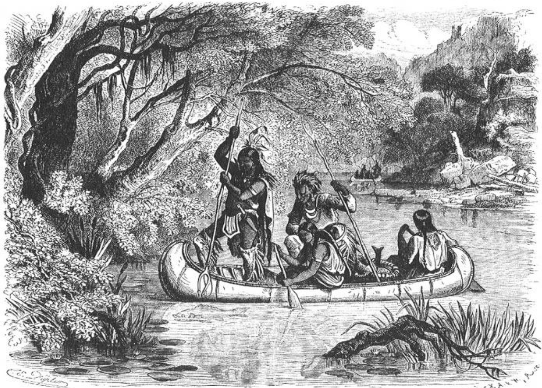
Сѣверо-американскіе дивари, ловящіе рыбу острогами.