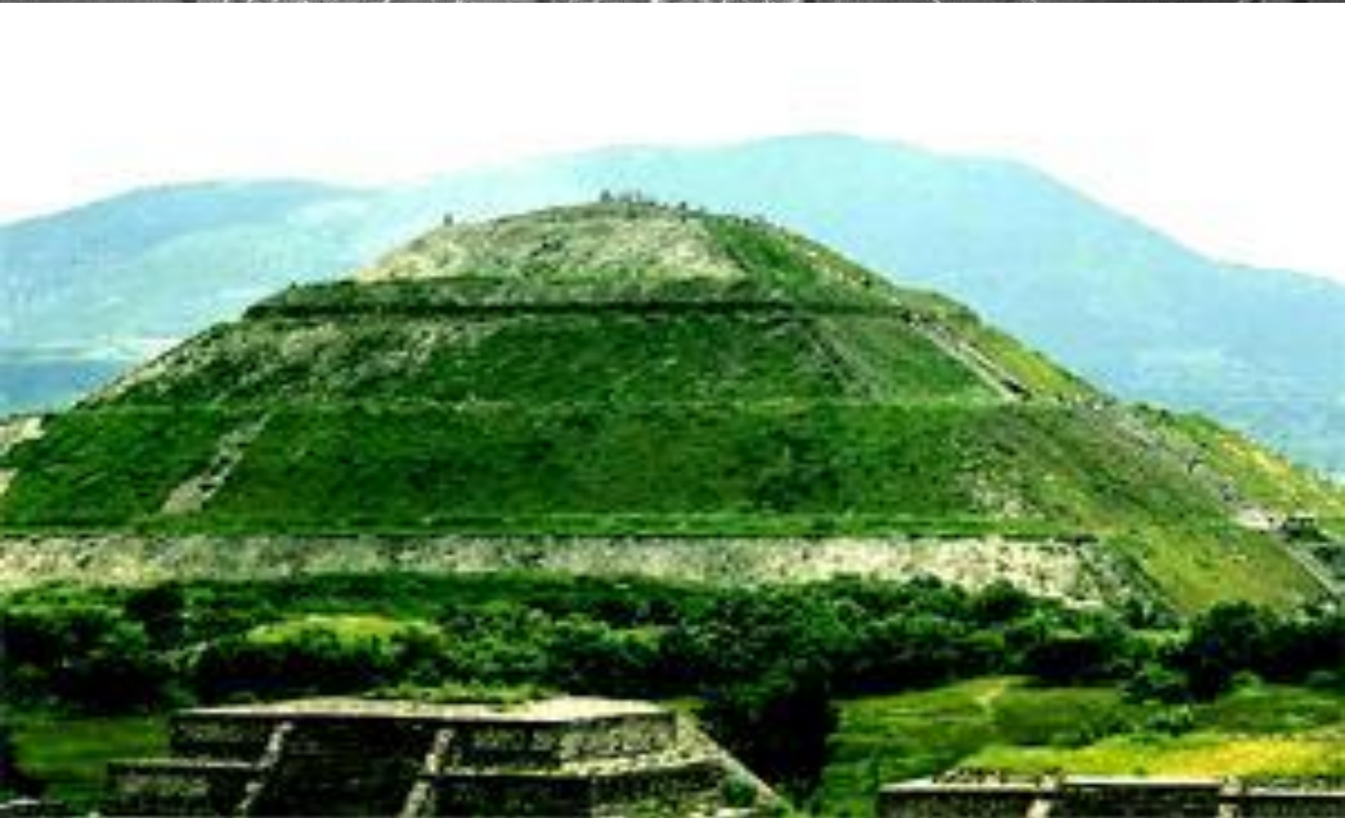
Пирамида Солнца — самая крупная пирамида Теотиуакана