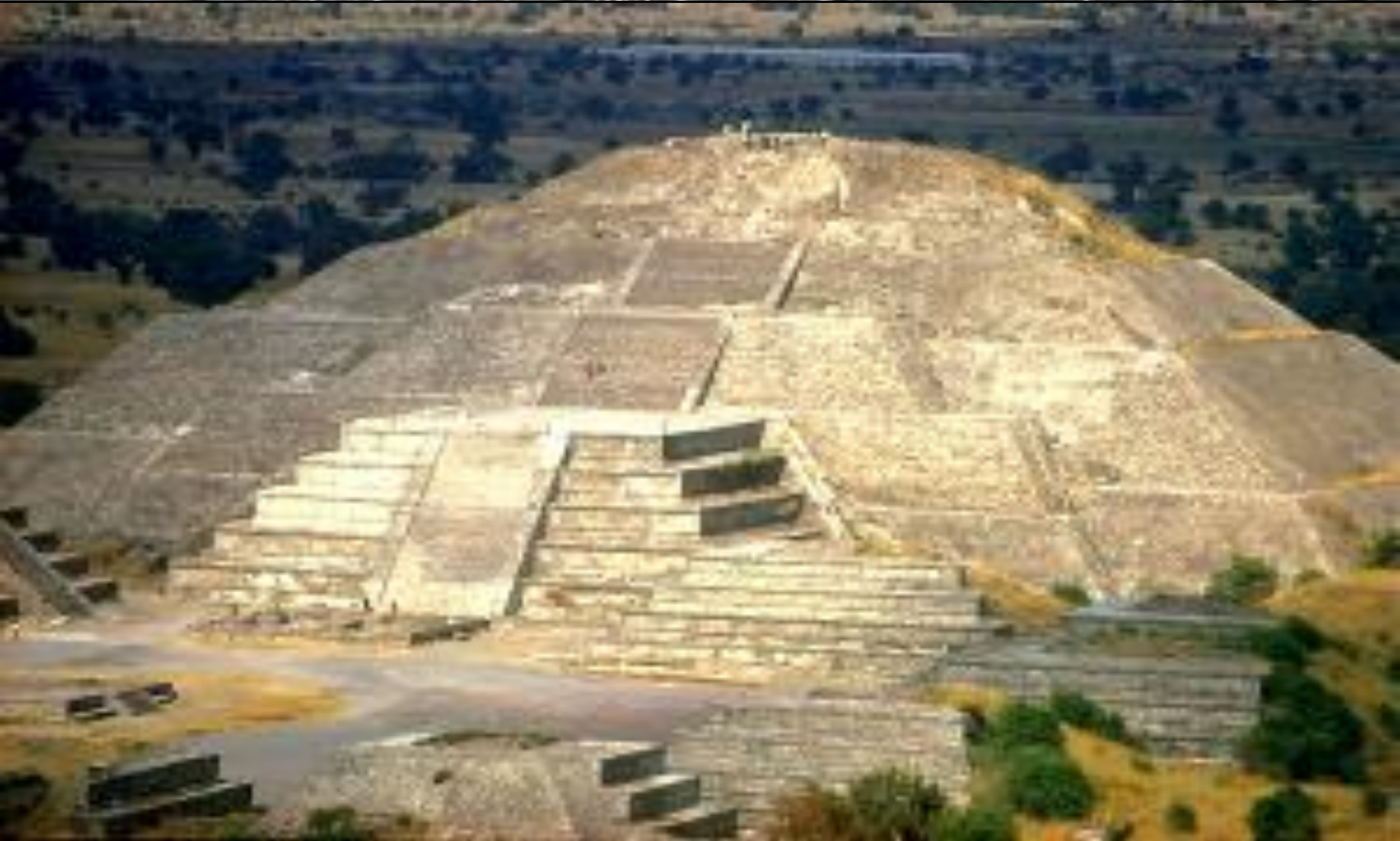
Пирамида Солнца — самая крупная пирамида Теотиуакана