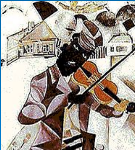
Марк Шагал. Музыка.1920.

В 30-е гг. творчество Шагала стали определять две основные темы: современная история и библейская тема. В 50-е гг. художник создал циклы картин, посвящённых Парижу, цирку, музыке.