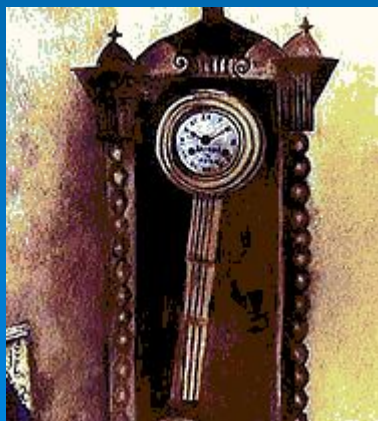
Часы (время). 1911.

Полотна «Суббота», «Мастерская», «Урожай» написаны в 1910г. по парижским впечатлениям. Картина Шагала «Париж из окна» (1913) явилась своеобразной интерпретацией кубизма. Она написана под влиянием таких художников, как А. Модильяни и П. Пикассо .