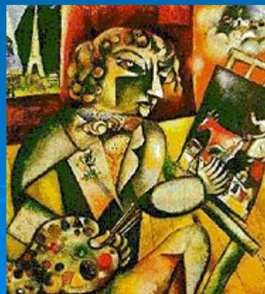
Автопортрет с семью пальцами. 1912