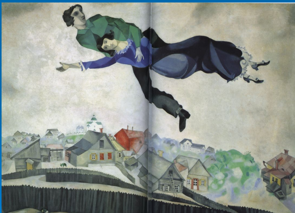
«Над городом» (1914-1918).

В 1914г. Шагал вернулся на родину, где приобрёл известность благодаря статьям А. Бенуа и др. Он писал портреты родных и близких, автопортреты, виды Витебска и интерьеры. В этот период написаны картины «Над Витебском» (1914—1920), «Продавец газет» (1914), «Над городом» (1914-1918).