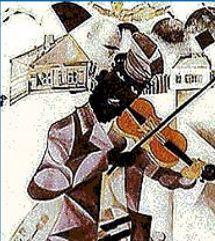
Марк Шагал. Музыка.1920.

В 30-е гг. творчество Шагала стали определять две основные темы: современная история и библейская тема. В 50-е гг. художник создал циклы картин, посвящённых Парижу, цирку, музыке.