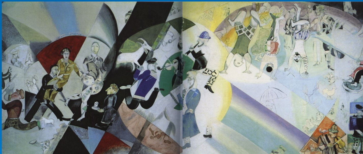
Введение в еврейский театр 1920

В 1920г. Шагал оставил пост руководителя и переехал в Москву, где создал семь панно для Камерного еврейского театра и оформил ряд спектаклей.