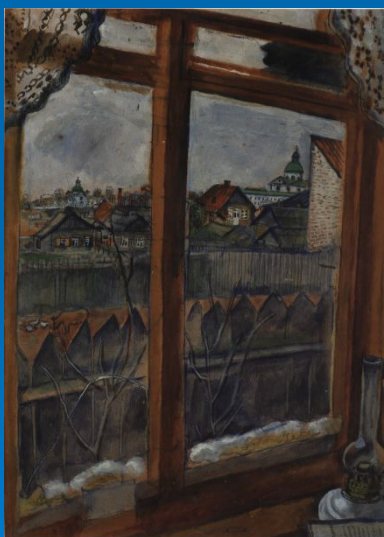
Вид из окна. Витебск.