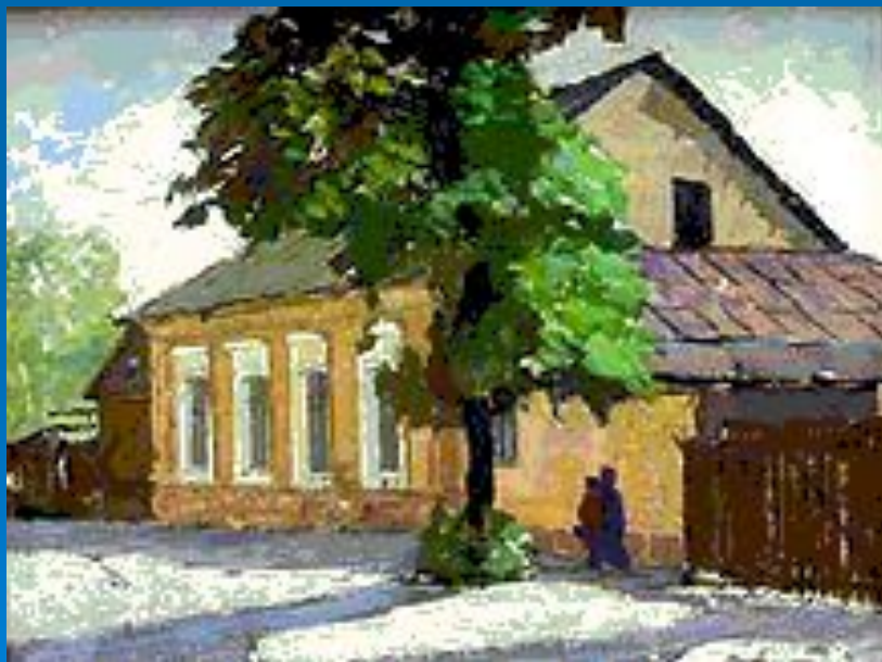
Витебская область. Дом-музей Марка Шагала в Витебске

После революции 1917г. Шагал был назначен уполномоченным по делам искусств в Витебской губернии. В Витебске он создал народное художественное училище, организовал музей, занимался оформлением праздников.