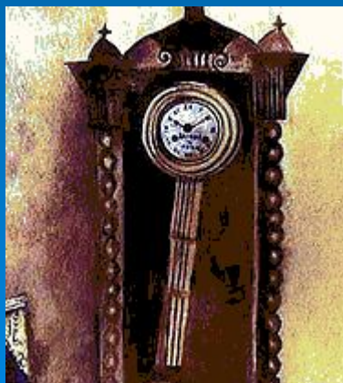
Часы (время). 1911.

Полотна «Суббота», «Мастерская», «Урожай» написаны в 1910г. по парижским впечатлениям. Картина Шагала «Париж из окна» (1913) явилась своеобразной интерпретацией кубизма. Она написана под влиянием таких художников, как А. Модильяни и П. Пикассо .