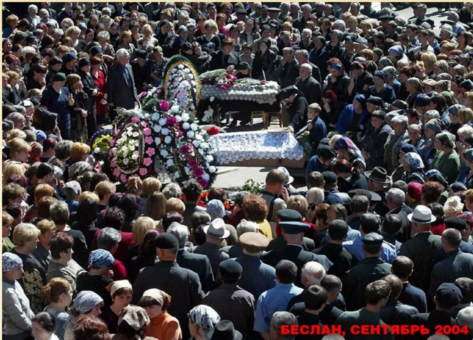
БЕСЛАН, СЕНТЯБРЬ 2004