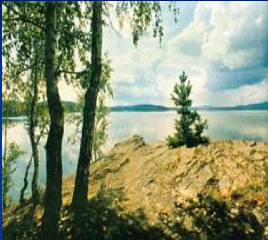
Ильменский заповедник Озеро Большое Миассово