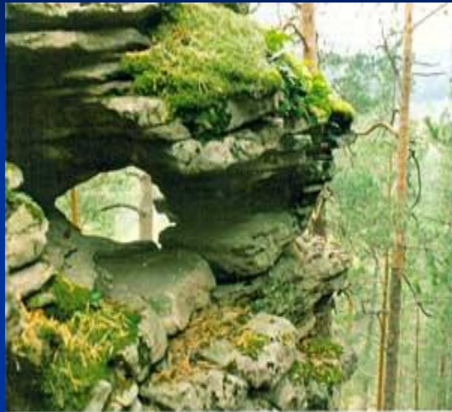
↑ Соколиная гора