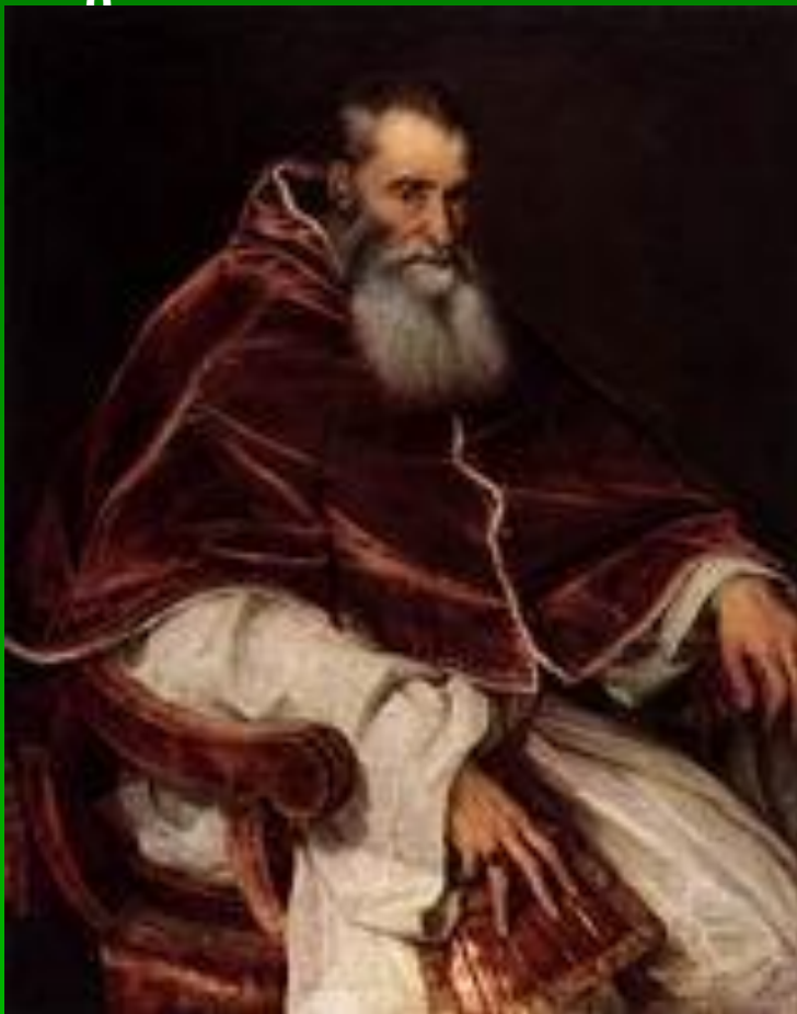
Портрет инквизитора, дожа Андреа Гритти, 1545. Холст, масло, 133x103.

Вашингтон, Национальная Галерея искусств, США