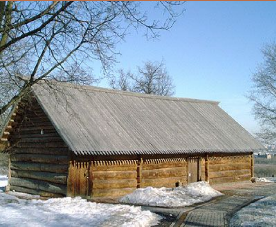
Хозяйственная постройка Петра I в селе Преображенском

После того как состоялась торжественная церемония венчания на царство царевичей, наречённых царями Иваном V и Петром I, правительница Софья, подозревавшая Наталью Кирилловну в интригах, вынудила её вместе с Петром покинуть Москву. Царица Наталья обосновалась в подмосковном дворце в селе Преображенском. В Преображенском Пётр пользовался полной свободой. Пётр с ватагой сверстников из дворовых слуг убегал в окрестные поля и леса. На вольном воздухе