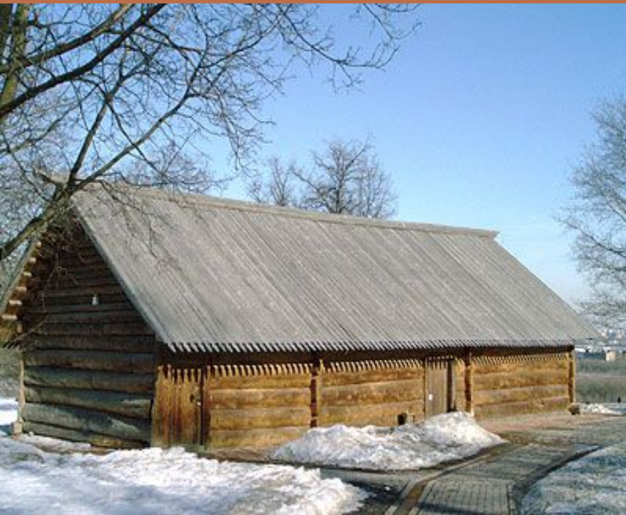
Хозяйственная постройка Петра I в селе Преображенском

После того как состоялась торжественная церемония венчания на царство царевичей, наречённых царями Иваном V и Петром I, правительница Софья, подозревавшая Наталью Кирилловну в интригах, вынудила её вместе с Петром покинуть Москву. Царица Наталья обосновалась в подмосковном дворце в селе Преображенском. В Преображенском Пётр пользовался полной свободой. Пётр с ватагой сверстников из дворовых слуг убегал в окрестные поля и леса. На вольном воздухе