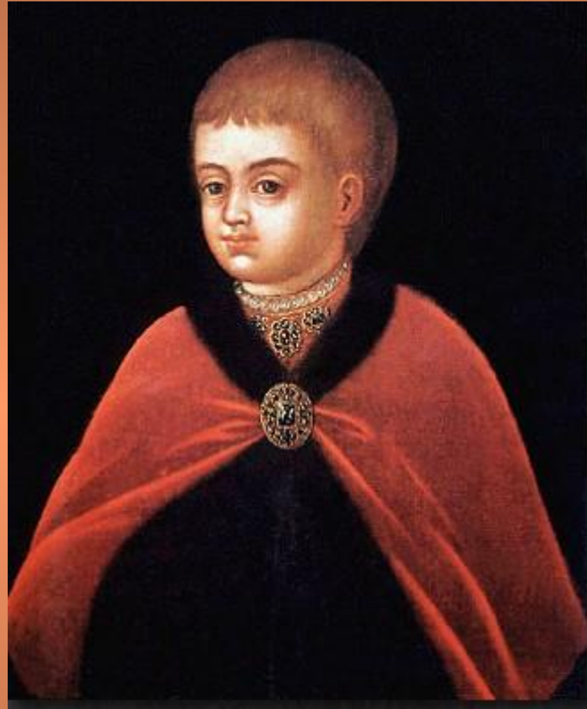
Петр в детстве

а он тянулся к солдатикам, конькам и пушечкам. Когда Петру исполнилось три года, отец подарил ему детские ружье и сабельку. Благодаря первым годам жизни, проведённым в материнской горенке, Пётр навсегда полюбил небольшие, уютные комнаты с низкими потолками и маленькими оконцами.