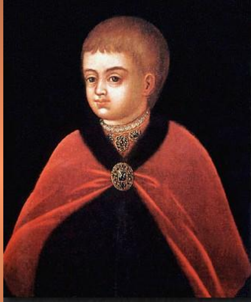
Петр в детстве

Со временем у царицы появились и другие дети, а к Петру были приставлены мамки и няньки, но Наталья Кирилловна ни на миг не отпускала от себя своего любимца. Малыша развлекали погремушками, а он тянулся к солдатикам, конькам и пушечкам. Когда Петру исполнилось три года, отец подарил ему детские ружье и сабельку. Благодаря первым годам жизни, проведённым в материнской горенке, Пётр навсегда полюбил небольшие, уютные комнаты с низкими потолками и маленькими оконцами.