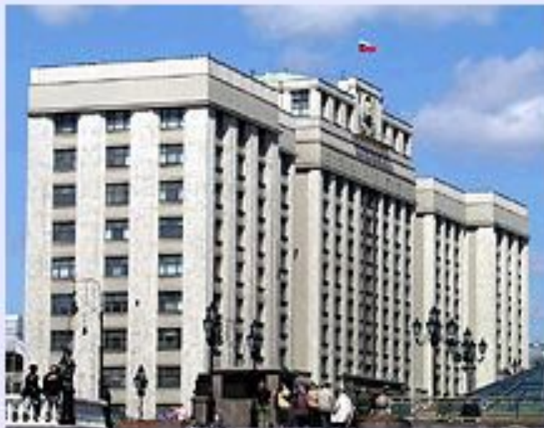
Москва. Здание Государственной думы Российской Федерации.