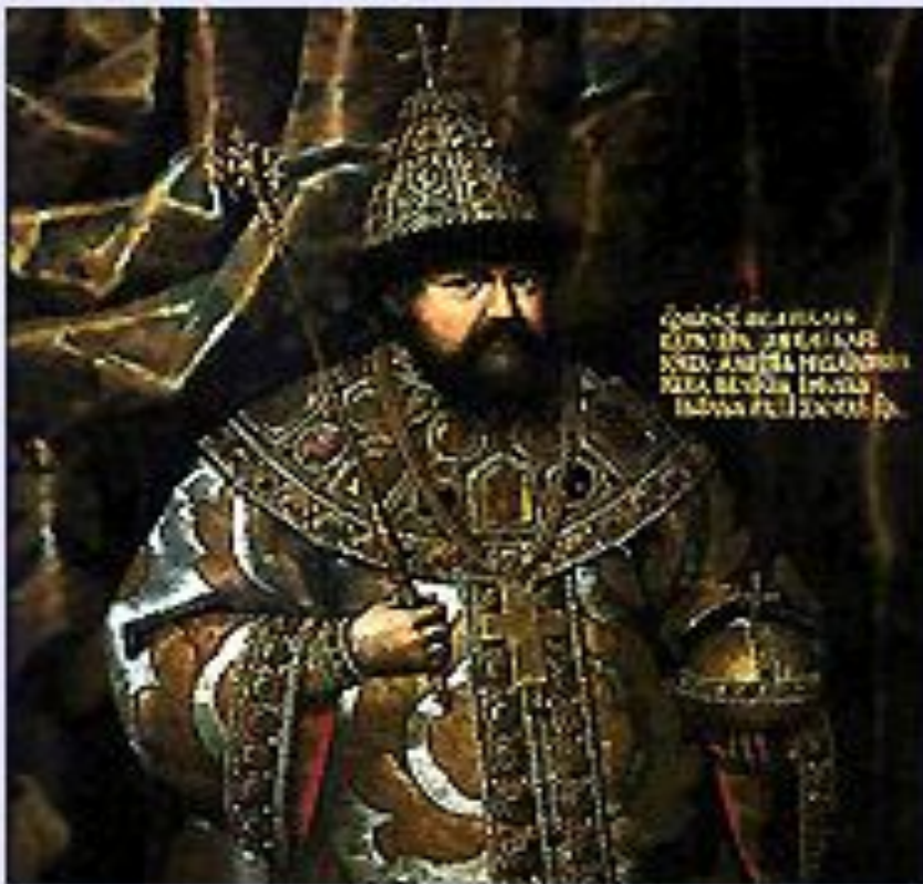
«Образ великого государя царя и великого князя Алексея Михайловича Великая и Малыя и Белья России самодержца».