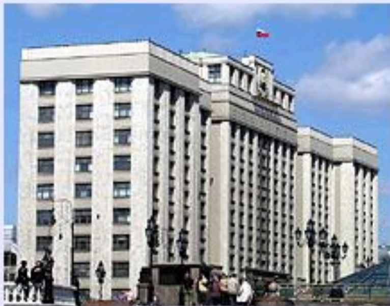
Москва. Здание Государственной думы Российской Федерации.