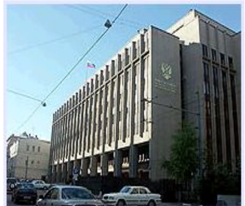
Москва. Здание Совета федерации.