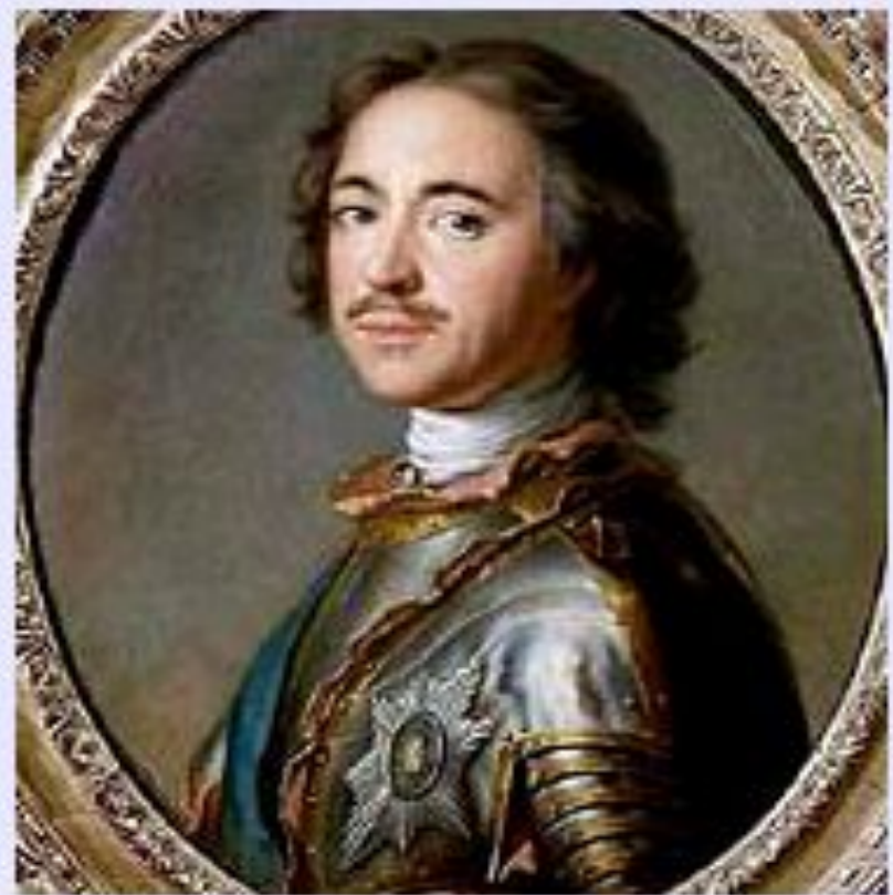
Петр I. Парадный портрет.

«Образ великого государя царя и великого князя Алексея Михайловича Великая и Малыя и Белья России самодержца».