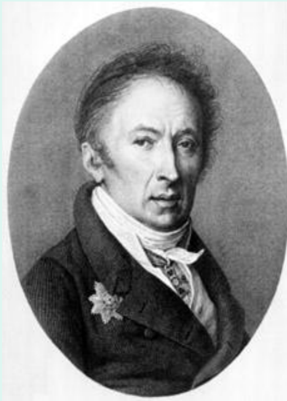
Николай Михайлович Карамзин (1766–1826), писатель, государственный историограф Российской империи (с 1803 г.)