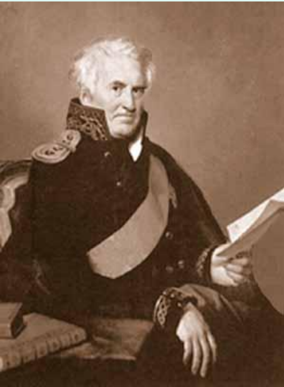
Александр Семенович Шишков (1754–1841), адмирал, писатель, основатель литературного общества «Беседы любителей русского слова».