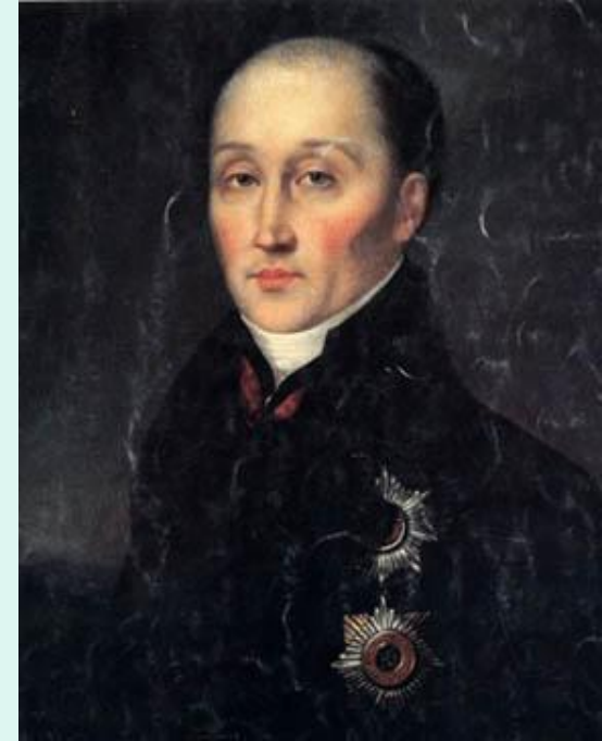
Михаил Михайлович Сперанский

«Никакой новый закон не может быть издан без уважения Думы»