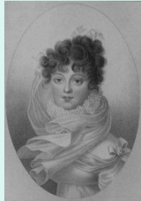
Екатерина Павловна (1788–1819), великая княжна, четвертая дочь императора Павла I, герцогиня Ольденбургская