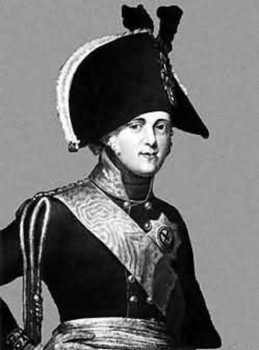
Император Александр I