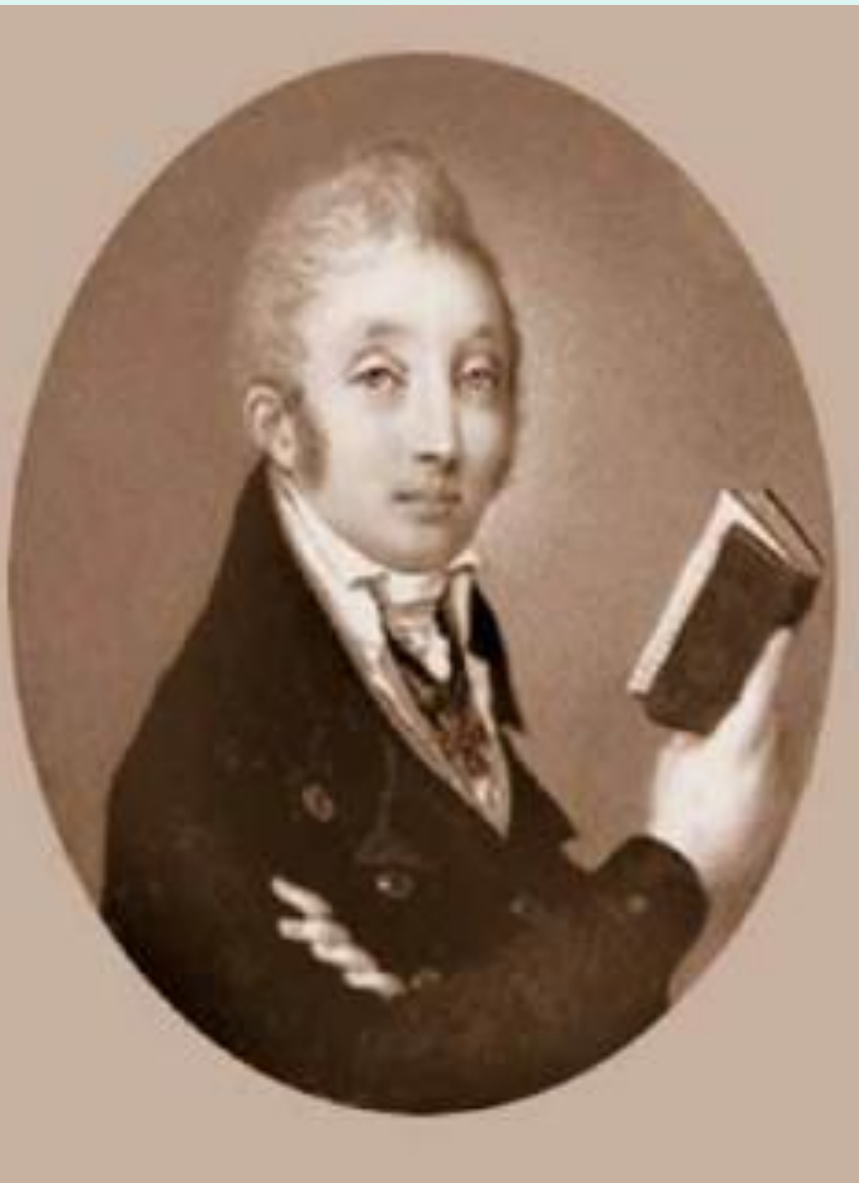
М.М. Сперанский в 1790-х гг.

Родился в 1772 г. в семье сельского священника. Учился во Владимирской духовной семинарии. В 1788 г. переведен в столичную Александро-Невскую семинарию.