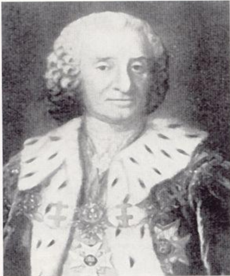
Барон О. Ф. фон Розен. Подписанная им в 1739 году декларация значительно ухудшила положение крестьян на территории Эстонии и Латвии

Лифляндский советник барон фон Розен, составивший в 1739 году декларацию.