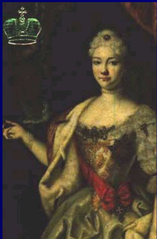
Русская императрица (1730-1740)

В управлении опираются на прибалтиско- немецкие круги и приглашенных в Россию иностранцев.