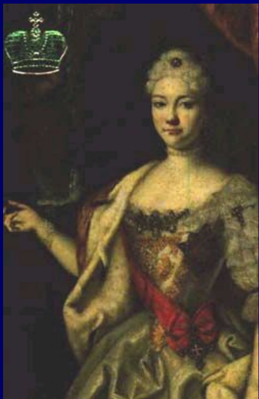
Русская императрица (1730-1740)

В управлении опираются на прибалтиско- немецкие круги и приглашенных в Россию иностранцев.