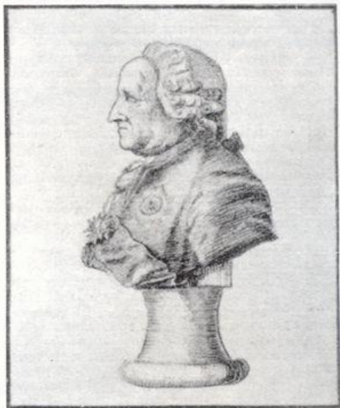
Рижский генерал-губернатор Джордж Браун

Рижский генерал-губернатор, утвердивший пропозиционные пункты , направленные на облегчение положения крестьян.