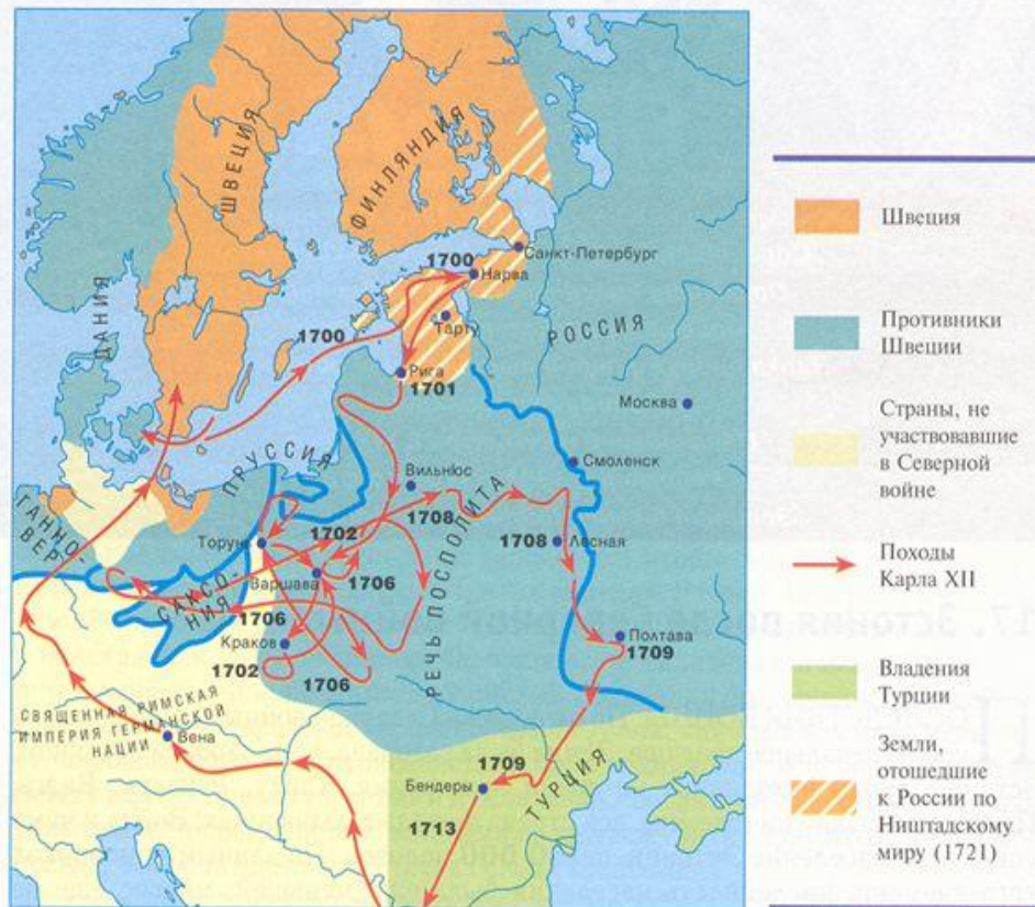
Ход Северной войны и расширение российских владений по Ништадскому миру.

Вследствие Северной войны (1700-1721) Эстония была присоединена к России.