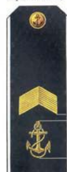
Главный старшина (для курсантов вузов, ВМФ)