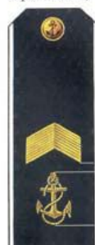
Главный старшина (для курсантов вузов, ВМФ)