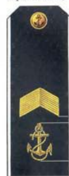
Главный старшина (для курсантов вузов, ВМФ)