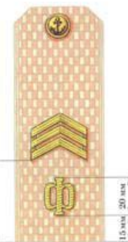
Старшина 1 статьи