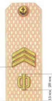
Старшина 1 статьи