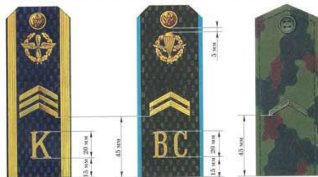
Сержант (для курсантов вузов, кроме ВМФ)