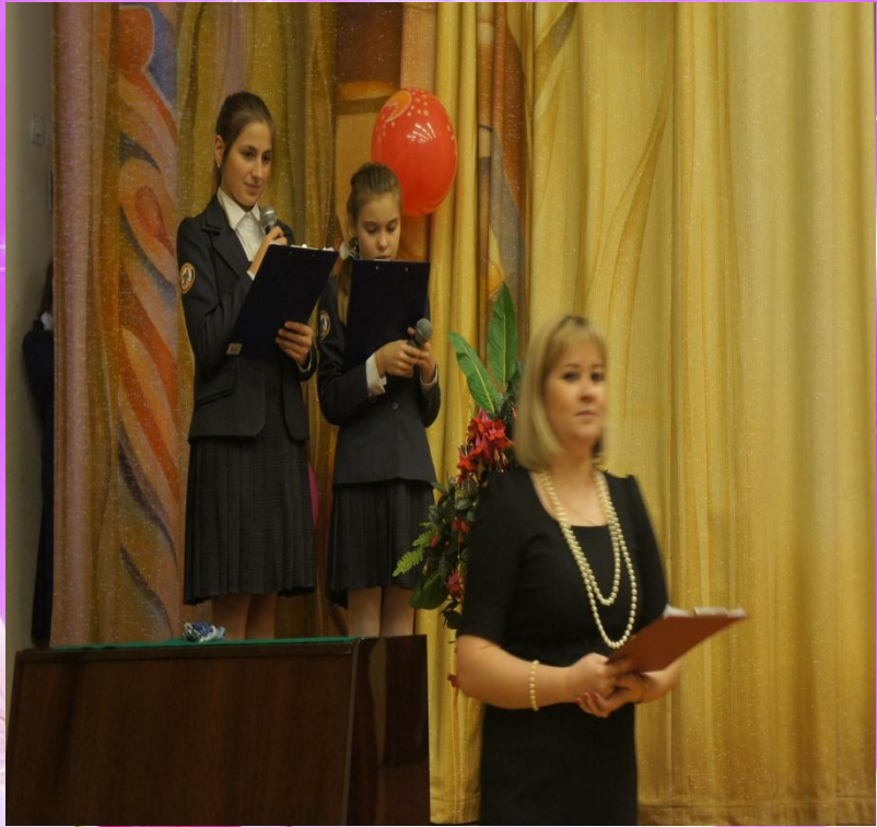
Посвящение в гимназисты