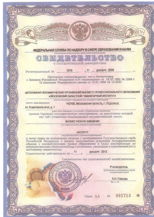
Свидетельство о государственной аккредитации