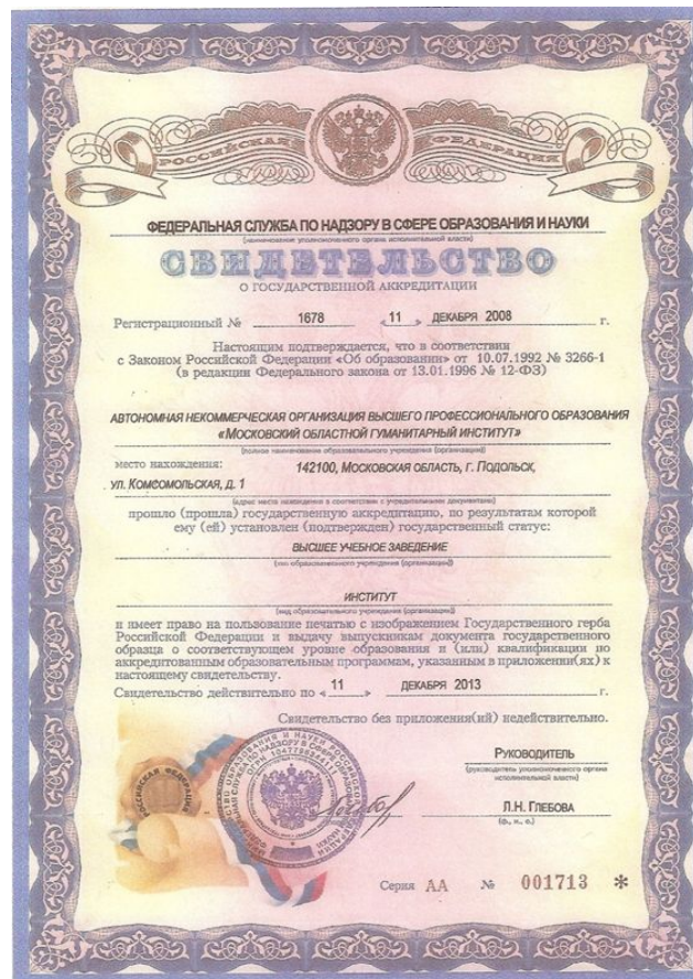
Свидетельство о государственной аккредитации