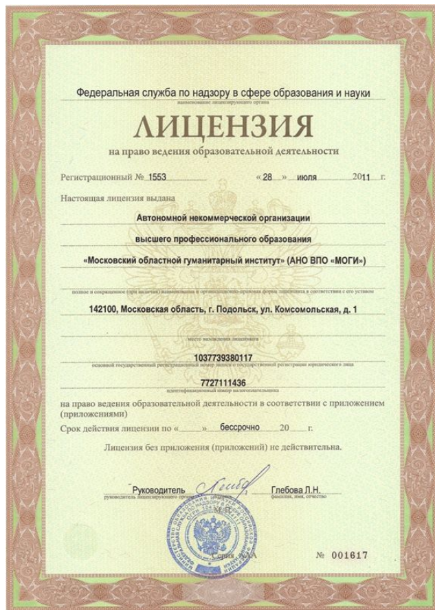
Лицензия на право осуществления образовательной деятельности