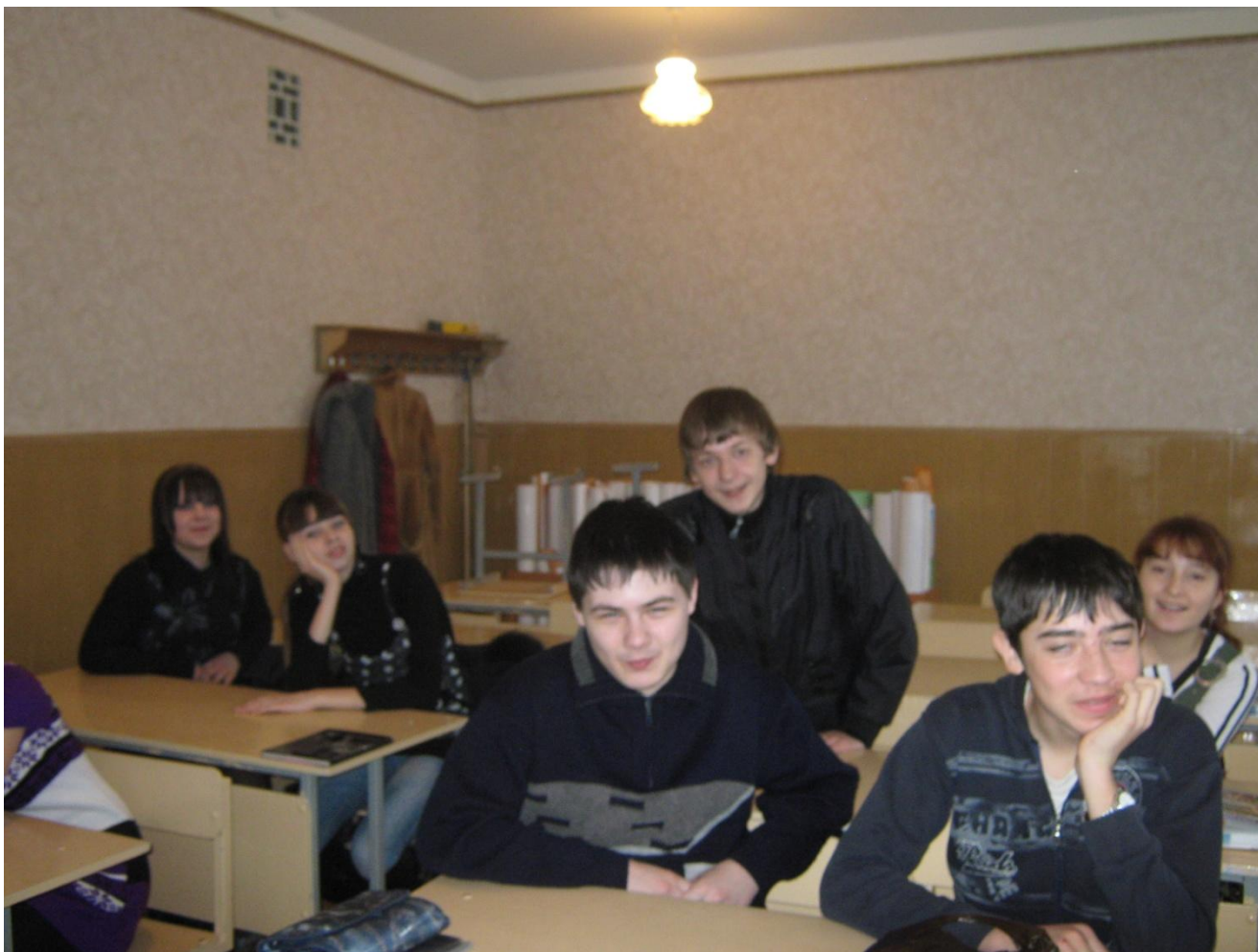
Участие в выборах органов ученического самоуправления