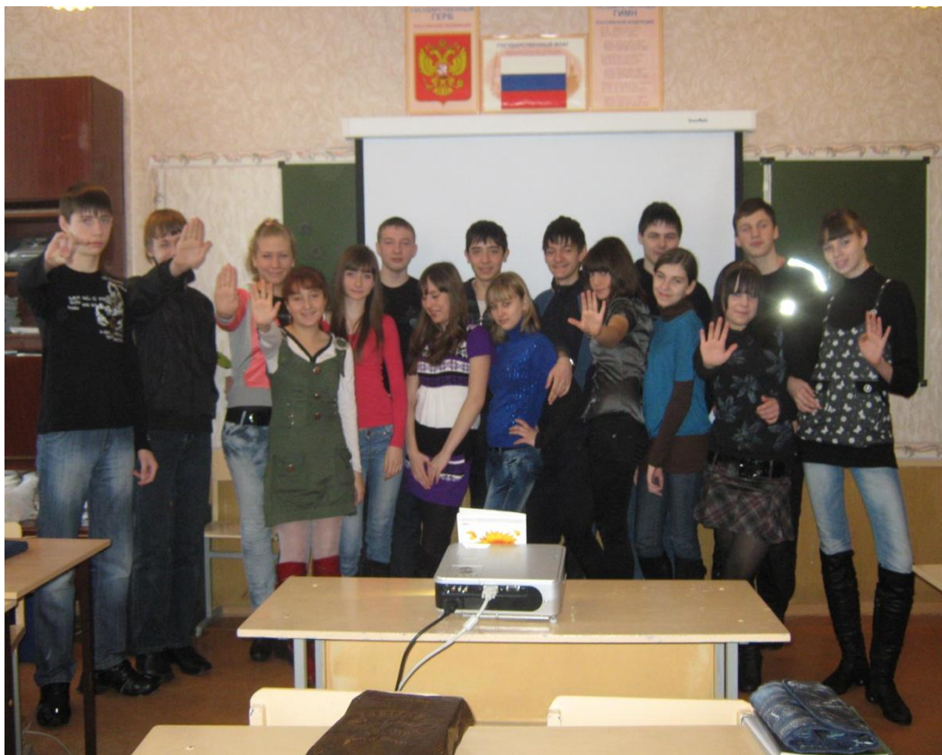
Классный час: «Право ребенка на здоровье»